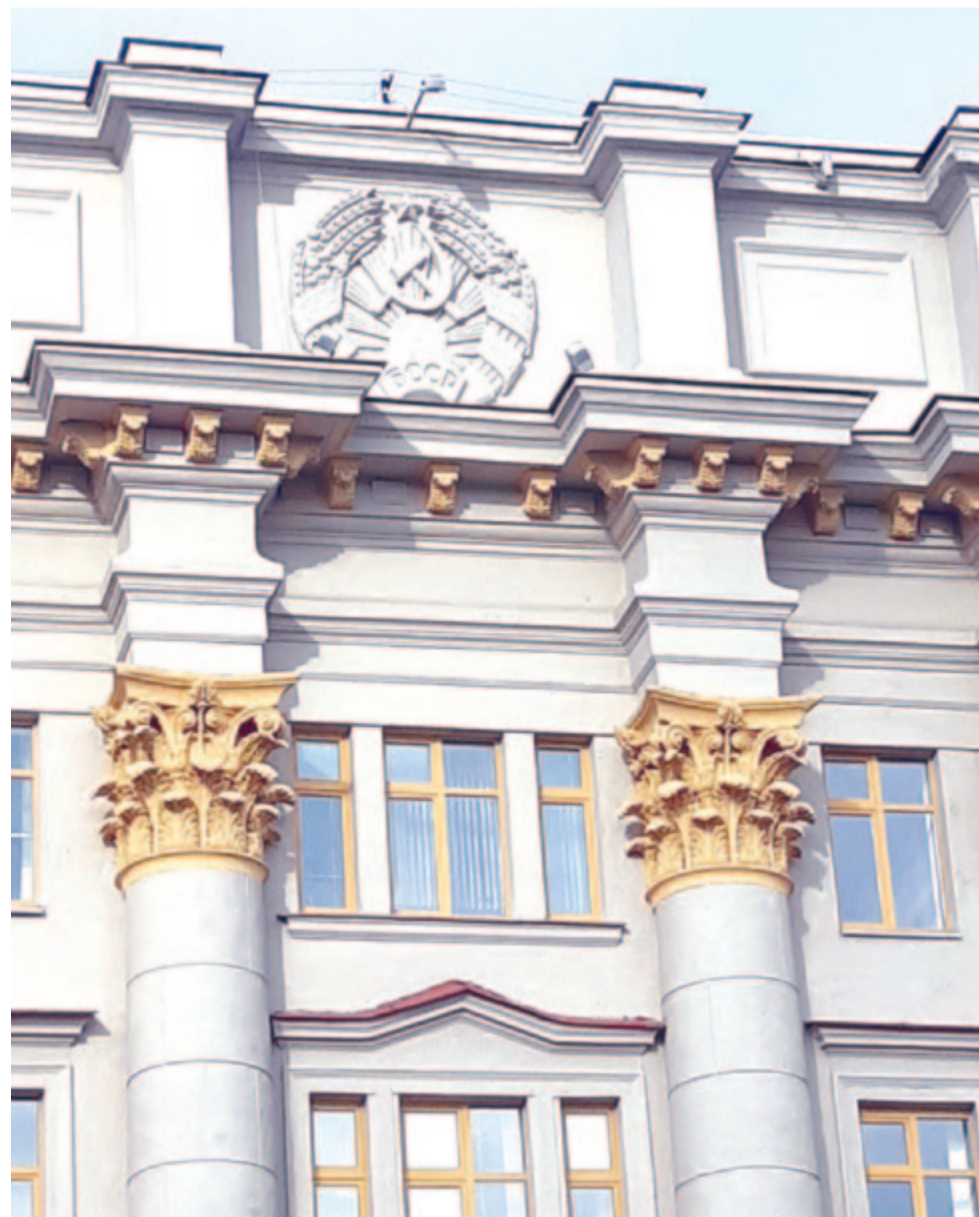
Sarló és kalapács a homlokzaton

nyait sikerült megőrizni. A leírás kiemeli, hogy a kastélyhoz vezető mintegy háromszáz éves híd a legrégebbiek közé tartozik az egész országban. Manapság a régi kastélyt a leírásokban, több internetes honlapon is, ugyanakkor a közbeszédben egyaránt Báthory-kastélyként szokás emlegetni.