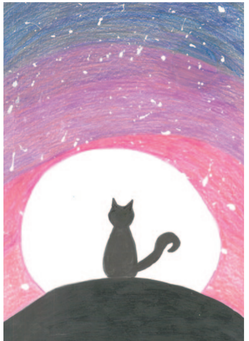
Seres Blanka rajza

– Régióta figyelem, hogy a lakóhelyem környékén milyen gyorsan szaporodnak a gazdátlan állatok, amelyek aztán előbb-utóbb megsebesülnek, illetve elpusztulnak. Az interneten kutakodtam a téma kapcsán, és szakavatott honlapokról tudtam meg, hogy az etetgetett utcacicákból eltűnik a vadászószton. Mivel az energiájukat nem kell már a létfenntartásra fordítaniuk, az túlzott mértékben a párosodásra irányul. Tehát, ha nem traktáljuk őket