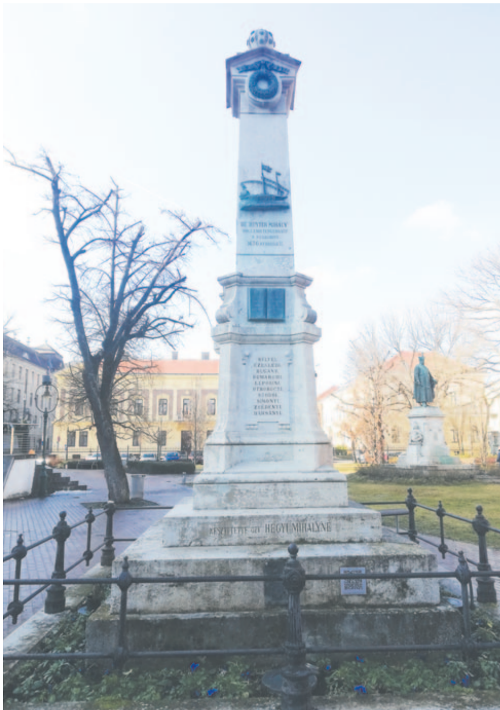
A gályarabok emlékműve Debrecenben