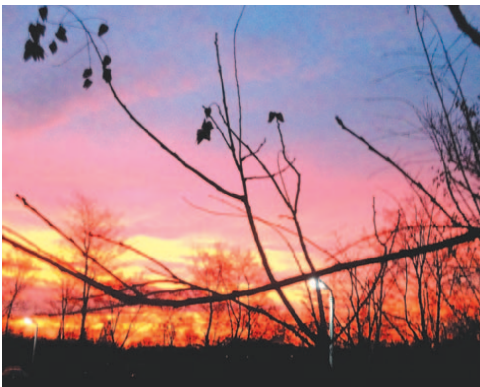
Az esti égen violás a szín és kikeletben járnak álmain

Ugyancsak február 13-án, 1842-ben született Ponori Thewrewk Aurél orvos-anropológus, a koponyamérő szerkezet (craniométer) megkonstruálója, magyar történelmi személyek ( II. Rákóczi Ferenc , Thököly Imre , III. Béla ) és honfoglaló őseink antropológiai kutatója. (A mostani genetikai kutatások igazolják akkori megállapításait, méréseit.) 1867–69-ben a