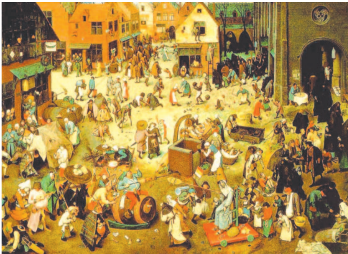
Id. Pieter Brueghel: A Karneval és a Bört viadala, 1599