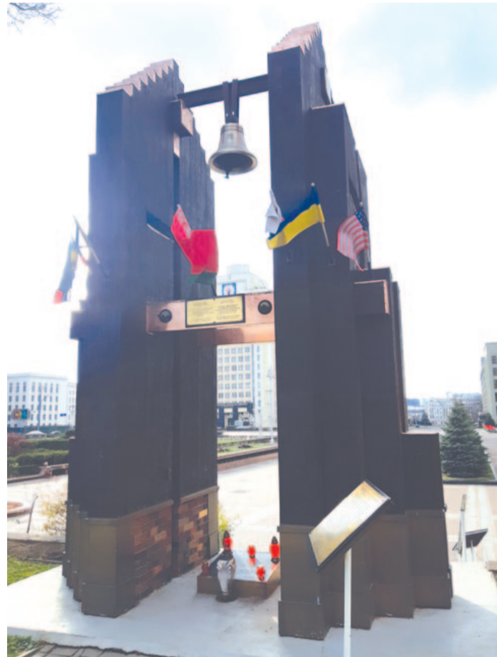
Csernobili emlékmű (Minszk)

A rövid, háromnyelvű (fehérorosz, orosz, angol) leírás szerint a régi kastély 12–19. századi műemlék, amely hercegek, nagyhercegek és királyok székhelye volt a lengyel-litván dualizmus korában. A kastélykomplexumban történelmi és régészeti múzeum várja a látogatókat, a 12. századi hercegi palota és az altemplom maradvá-