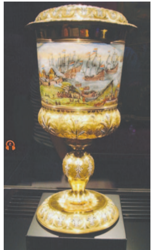
A chatham-i ütközetben elért sikere jutalmául 1667. november 7-én ezzel a díszes aranyserleggel jutalmazták Ruyter admirálisát, akárcsak két másik magas rangú társát. Abban az időben gyakran adományoztak arany- vagy ezüsttárgyakat elismerésként, ugyanis a pénzbeli jutalmat nem tartották illőnek.

Nemcsak manőverezésével és stratégiai érzékével tűnt ki,