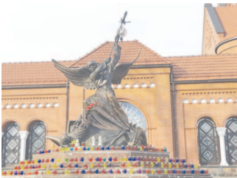
Sárkányölő Szent György (Minszk, Vörös templom)