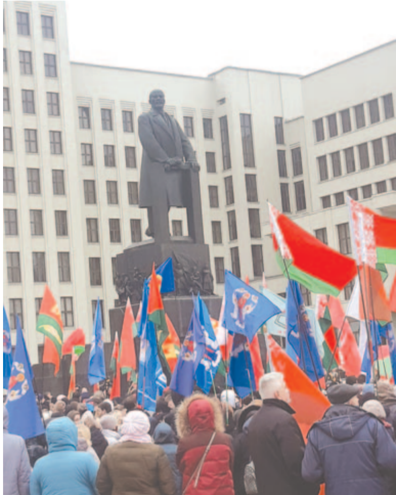
Megemlékezés Lenin szobra előtt (Minszk, parlament)

Az idegen nyelvek tanszékén arról számoltak be, hogy az ott tanuló hazai diákok az angol mellett jóval kisebb létszámban németül és franciául tanulnak. És alapszinten zajlik a latin oktatása is, amely az orvostudomány egykori alapnyelvéből immár „holt nyelvvé” vált ugyan, de a szakkifejezéseket uralja. Persze, nekik nehezebb a helyzetük, mint például a latin nyelvek családjának valamelyikét beszélőké, akik számára könnyebben érthető a latin szakkifejezések. Aprópó, holt nyelvek! Hogy nem