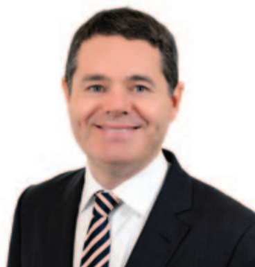
Paschal Donohoe

Az eurózóna Brüsszelben ülésző pénzügyminiszterei további költségvetési eszközöket ígértek, amelyekkel kiegyensúlyoznák a