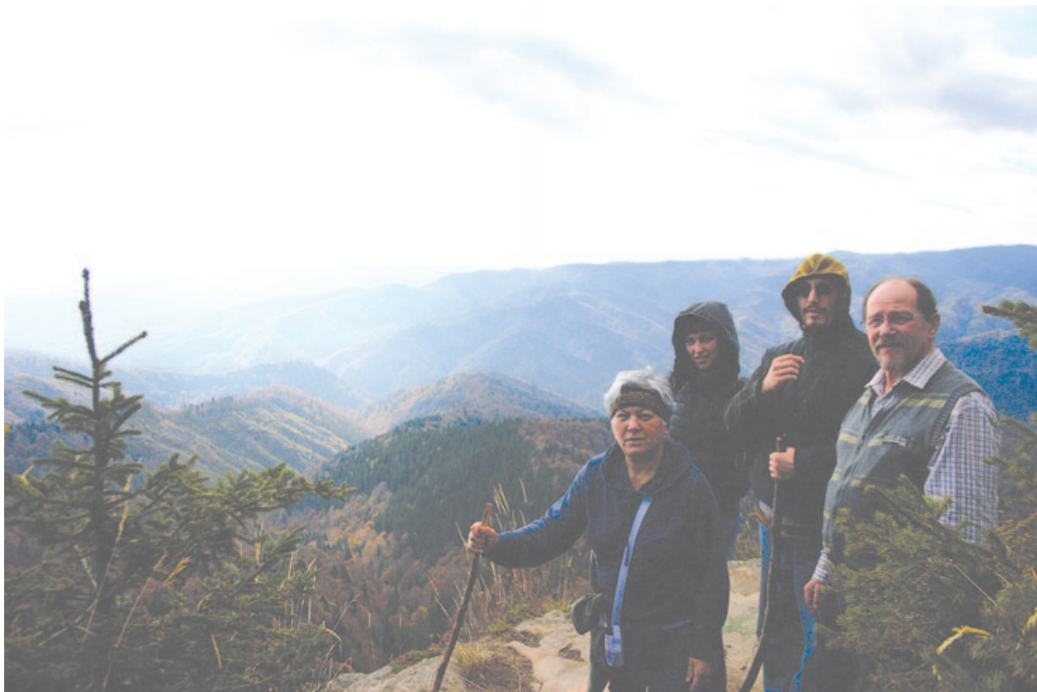
Istenszékén – a ködön túl sejdül a város

Kelt 2022. február 4-én, kilenc és három fertály évnnyire A természet kalendáriumának beharangozó levele után