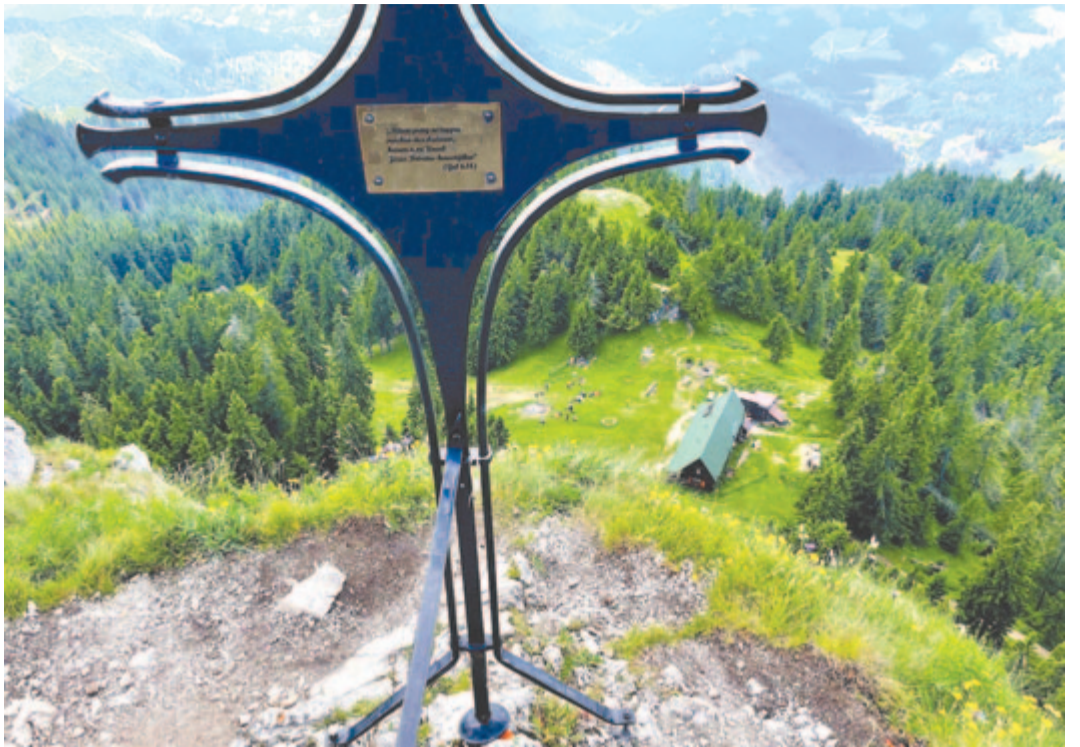
A Egyesítő keresztje védi a tájat

Így vagyok velem én is. Palocsay Zsigmond Trópusokja 1969 őszén született. Az RKP X. kongresszusa alkalmából „kérték fel” a kor (erdélyi magyar) költőit (is), írniak dícsőítő verseket. Bizony sokan megtették –