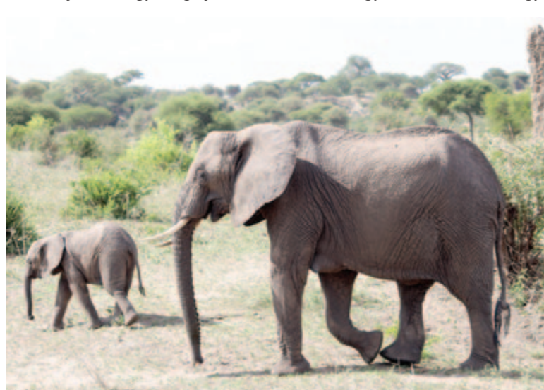
Simogatásnyira az elefántoktól

Elő nap hegyi esőerdőben tekergettünk, mohás fák, liánok, gyönyörű virágok között. Kíváncsis-kodó majomcsapatok fürkészték bennünket, mi pedig viszont közeli rokonainkat. 3000 méteren éjszakáztunk, ahol elfogyasztottuk első tábori vacsoránkat, amibe kiváló szakácsunk a – tudományán kívül – szívét-lelkét is belefőzte. Második napon fás hangával benőtt lágavagincen kapaszkodtunk, ekkor már találkozhattunk a hegy emblematisz növényeivel, a lobéliákkal és a gigantikus szenciókkal is. 3800 méteren sátoroztunk, látva a hegy lepusztult Shira-kráterének gerincvonulatát, a távoli Meru-hegyet és a Kilimandzsáró karnyújtásnyira tűnő, de valójában még többnapos járásra levő központi tömbjét, a Kibót. Harmadik napunkon újabb szintet léptünk, megérkeztünk a magashegyi sivatag zord és életlen világába. Felhágunk a 4630 méteren ágaskodó Láva-toronyhoz, majd aláereszkedtünk 4000 méterre, a szenciókkal övezett, gyönyörű fekvésű táborig. A negyedik napon nagy magasságban, nehéz, hullámzó terepen gyalogoltunk, megkerülve alulról a Kibót, megérkezve túránk legmagasabb fekvő táborába, ahonnan nyakunkat tekerve álmétködtünk a csúcson, és ráláttunk a Kilimandzsáró harmadik tömbjére, a félelmetes Mawenzire. Azon az estén korán ágyba, azaz sátorba bújtunk, hogy még éjfél előtt