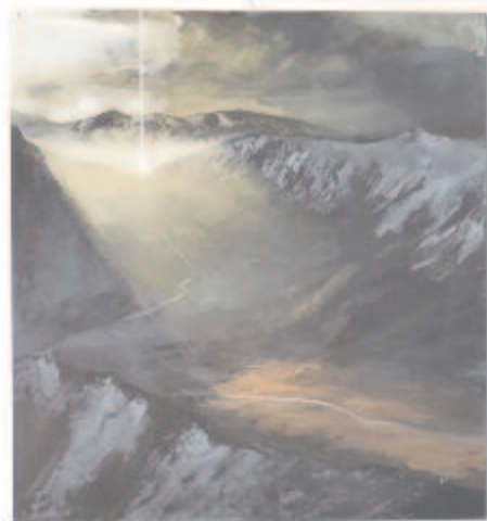
Căbuz Andrea tájríptichonja