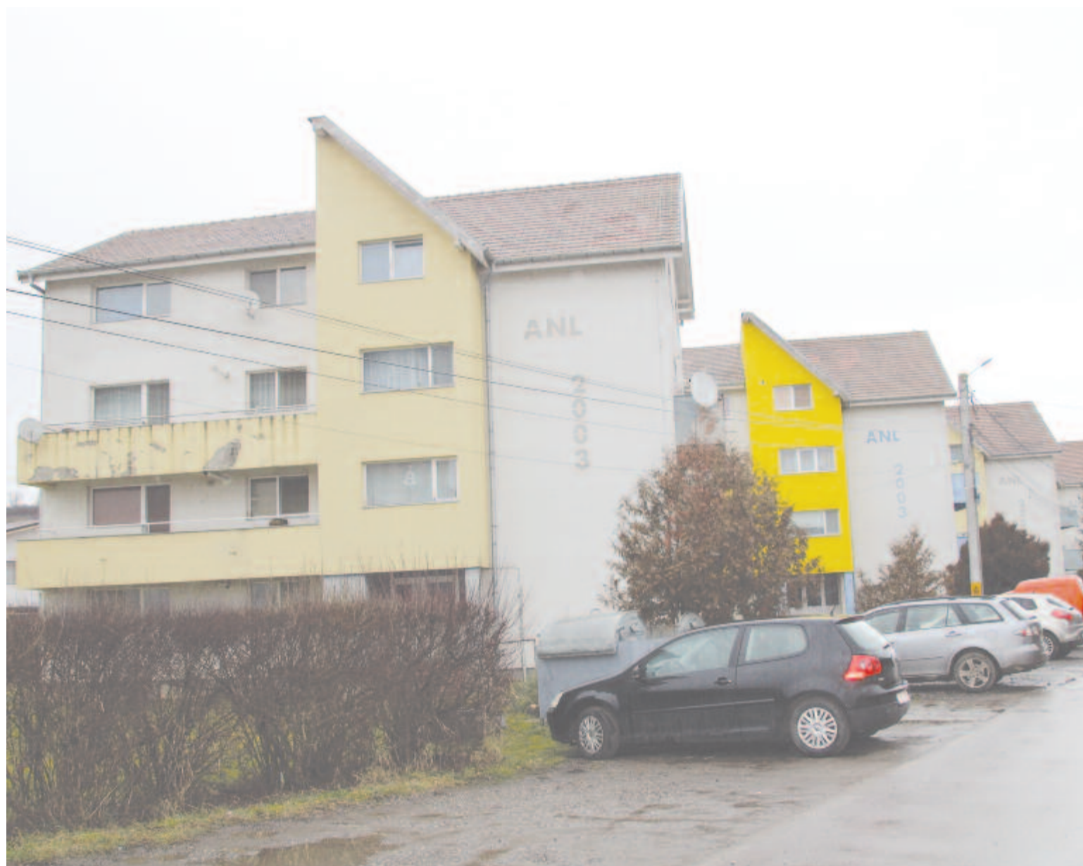
Állami alapból épített lakások Marosszentannán