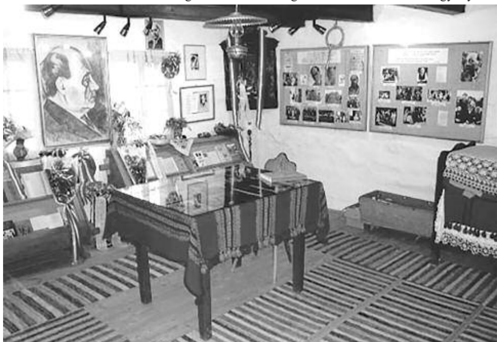
Az író szobája a farkaslaki Tamási-emlékházban