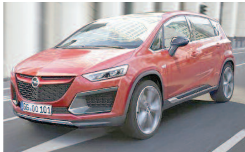
Az Opel új terepjárója

A Mercedes az ideai CES-en mutatta be a Vision EQXX-et. Bár feltehetően olyan bemutatót terveztek, ahol a közönség jelen van, ez nem történhetett meg, hiszen a CES 2022-es kiadását is online tartották meg a koronavírus-járvány újabb hulláma miatt. Ez talán csalódásra adott okot, de az autó képes ezt kárpótolni, a típus egyértelműen jelzi, hogy milyen irányban fejlődhet tovább a Mercedes villanyautó-flottája.