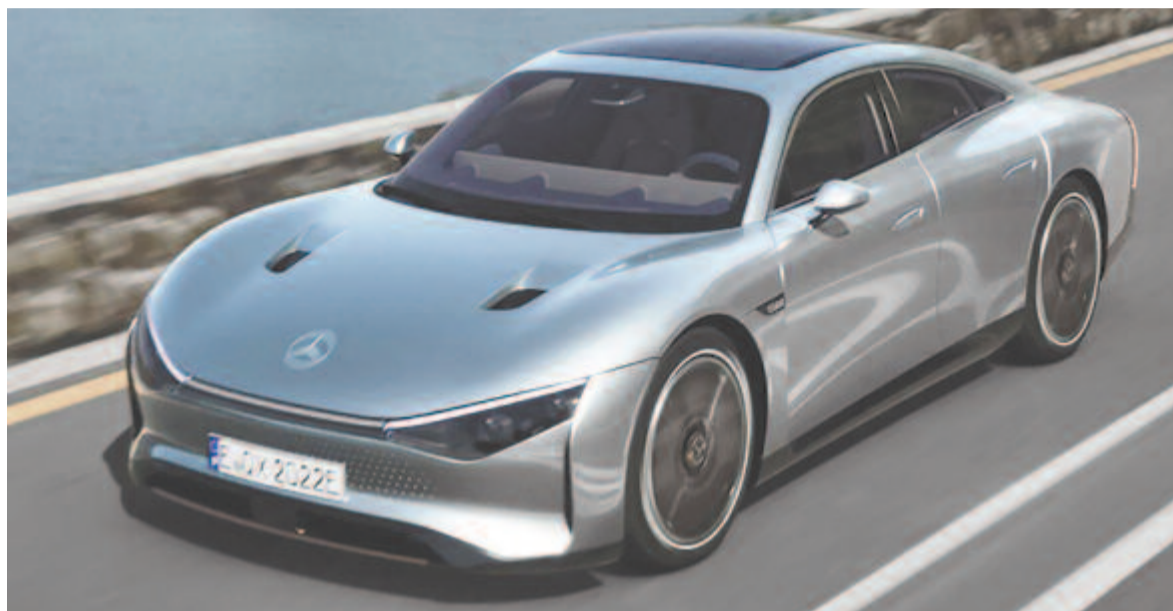
Mercedes Vision EQXX 2022