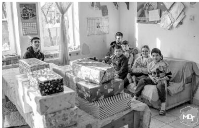
Az adományoknak örvendő gyermekek

– Amit kiemelnék, az az összefogás. Nagy boldogsággal tölt el az, hogy Maros megyében ennyire aktívak a diákok, és szeretnének tenni a közösségükért. Karácsonykor a legszebb dolog az összefogás és a szeretet, és a Maros megyei diákok most bebizonyították, hogy mennyire szeretnek adni, nem csak kapni.