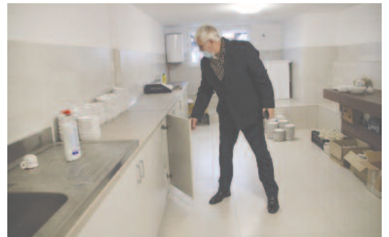
A marosszentannai kultúrház korszerű konyhája