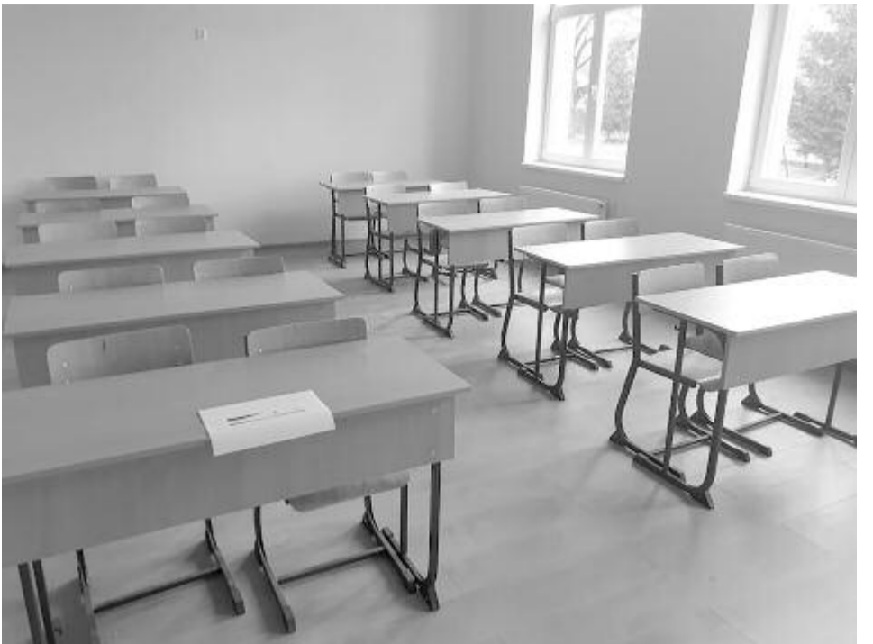
Egy osztályba való új bútorzat már biztosítva van Csikfalván