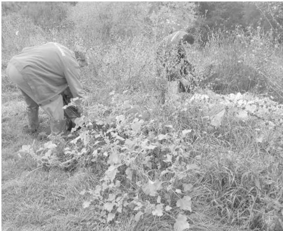
A Kis-Küküllő partján, Erdőszentgyörgynél