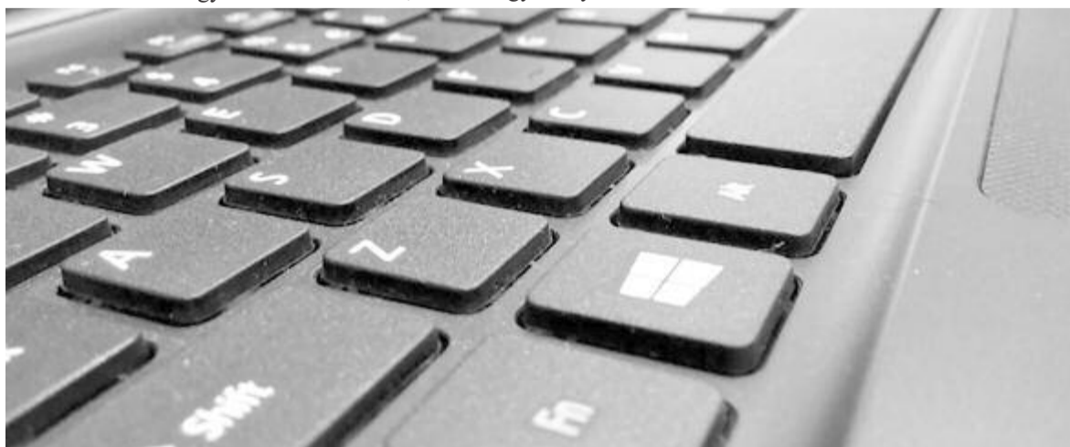
Összedőlt informatikai rendszer, illusztráció