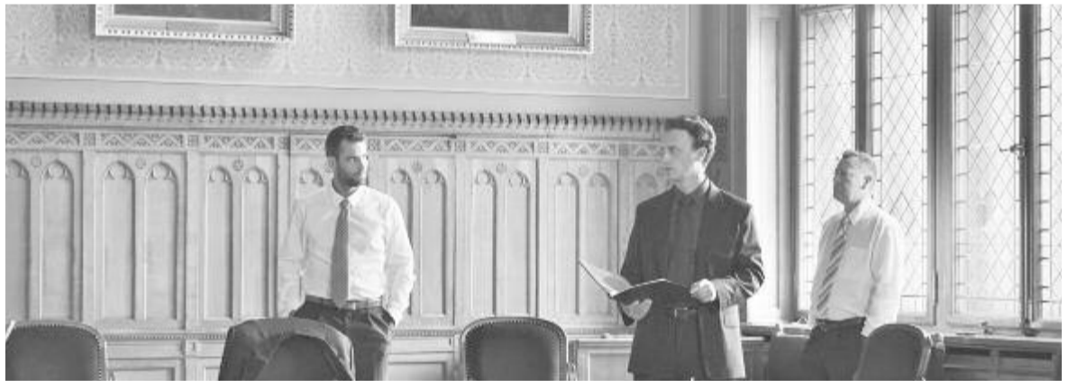
Jelenet az Elk*rtuk című filmből

Egy ideig azt mondtam, hogy a lelki béke megőrzéséért nem szabad kommenteket olvasni, most meg úgy gondolom, a türelemgyakorlás legjobb módja, ha olyan hozzáfűzésekkel olvasok, ahol ismerősök vagy ismeretlenek név nélkül negatív kritikát fogalmaznak meg, lehetőleg gyűlölködő hangnemből. De visszatérve a credómhoz, én egy művész alkotásban vettem részt, amit művészileg vállalhatónak tartok, és majd eldől, hogy a film kiállja-e az idő próbáját vagy sem. Örülök, hogy tavaly ez lett a legnézettebb magyarországi film, és nem bántam meg, hogy elvállaltam. Olyan csodálatos szakmai stábbal dolgozhat-