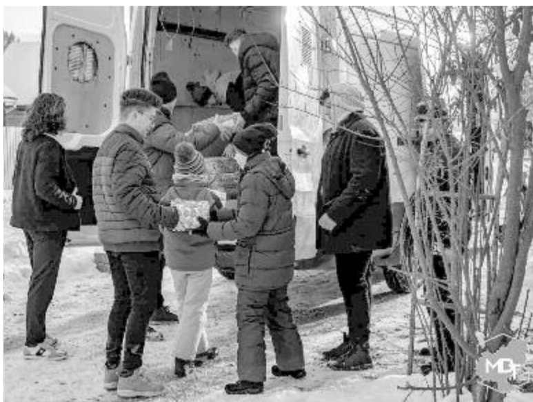
Az adományok kiosztása

– Első perctől nagyon reménykedtünk abban, hogy a Maros megyei diákok fontosnak tartják, hogy segítsék azokat a társaikat, akik hátrányos helyzetben élnek. Azonban be kell vallanom, hogy egyáltalán nem számítottunk ekkora lelkes-