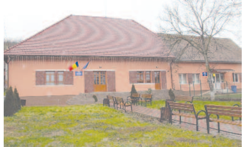
A várhegyi művelődési otthon

A Marosvásárhelyi Állami Filharmónia igazgatójáról, a 2020 októberében eltávozott Vasile Cazan kultúrmenedzserrel és karmesterről nevezik el a várhegyi művelődési otthont, ugyanakkor post mortem díszpolgári címmel adóznak emléke előtt.