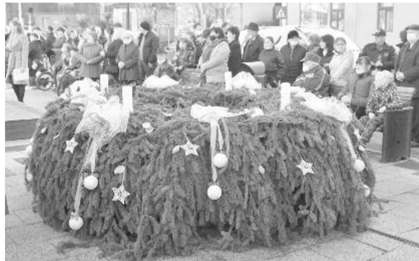
Számos helyen köztéri adventi koszorúk mellett hangolódnak az emberek a mennyei fény befogadására

Lassan a köztereken is kigyúlnak az ünnepi fények: pénteken Erdőszentgyörgyön kapcsolták fel a díszkivilágítást az utcákon, valamint a „LED-karácsonyfán”, a játszótér mellett. Szovátán az új napipiacon állították fel a karácsonyfát, de az ünnepi díszkivilágítást már advent első vasárnapjára felkapcsolták. Nyárádszeredában a hét végén gyulladtak ki az utcai ünnepi fények, közben felállítják a város háza előtti téren a település karácsonyfáját és a betlehemeset, továbbá advent harmadik és negyedik vasárnapján vásárra is várják az érdeklődőket a főtérre. (GRL)