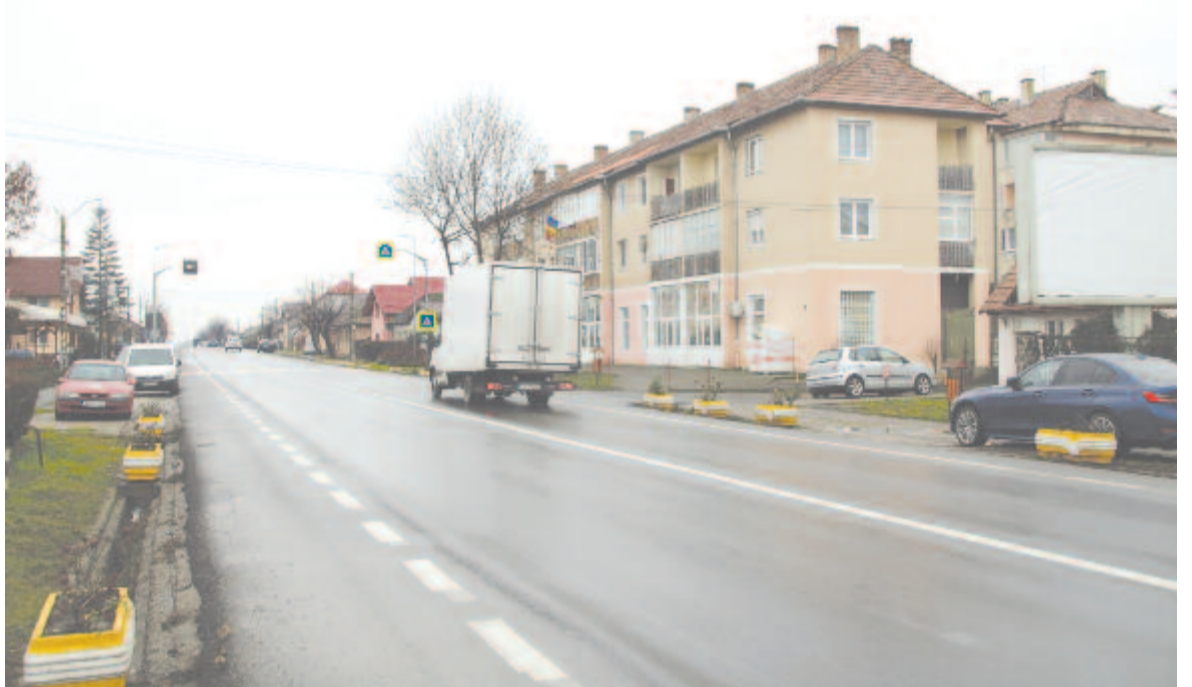
Sokat csökkent a gépkocsiforgalom