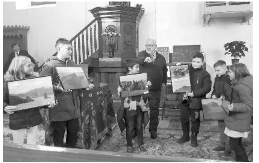
Első alkalommal mutatkozott be Nyárádszeredában a kanadai művész

A vendég Mozart Fantázia című zongorakompozíciójának előadásával mutatkozott be, majd egy csendes operarészlettel hangolt a fénykereső időszakra, mintegy válaszolva az istentiszteleti igehirdetésre, majd elmondta: első alkalommal jár itt, de máris jók a benyomások, örömmel térne vissza.