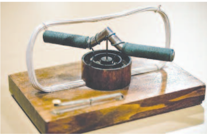
A „villamdelejes forgony”

Ha pedig azon elmélkedünk, hogyan lehetett ennyire kreatív Jedlik Ányos, gondoljunk a zenére, amely segítségével mindig frissen tarthatta elméjét!