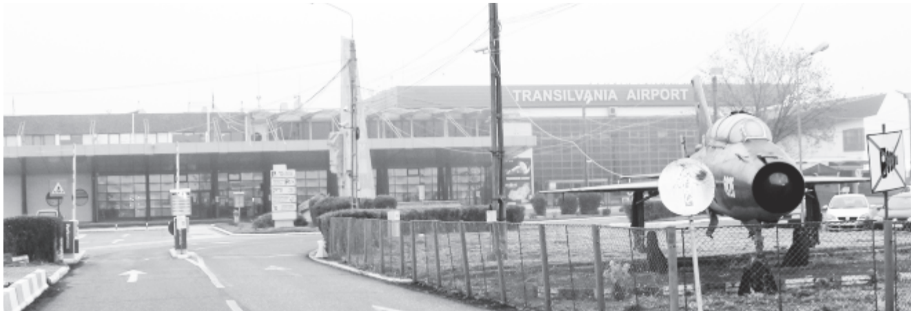
A marosvásárhelyi reptér

A nagyváradi repülőtér 8,8, a szatmárnémeti 7, a nagybányai 8,5 millió lejes finanszírozásban részesülne. A kormány ugyanakkor a szebeni repülőtérnek 6,6 millió lejt, az aradinak 7,9 millió lejt ítélt meg oda a tartalékalapból. (RMDSZ-tájékoztató)