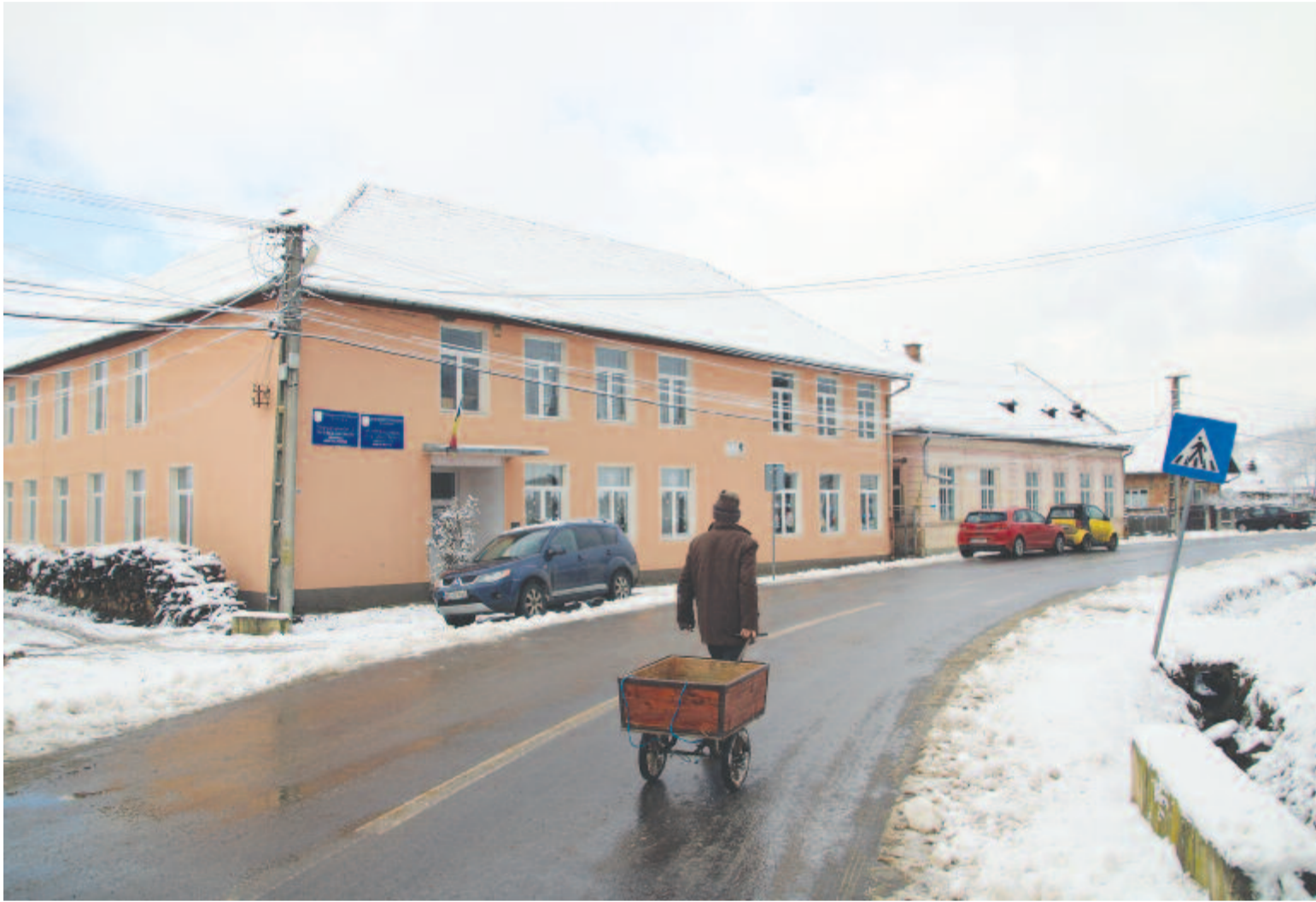
A jobbágytelki Petres Kálmán általános iskola