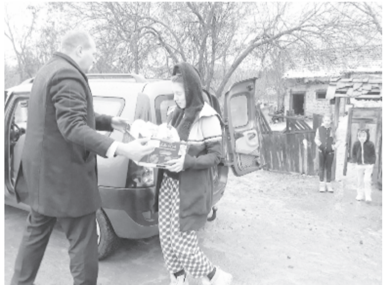
Berekeresztúron egy négygyermekes család élelmiszert, édességet, tűzifát kapott

Talán az eddigieknél magasabbra helyezték az elvárások „lécét” – vallotta be Kacsó István tűzoltóparancsnok, de a kezdeti nehézkesebb indulást követően „valami csoda folytán” megteltek a kosarak, ládák, és pénzádományok is érkeztek, így vásárolhattak olyan termékeket, amelyekből kevesebb volt, és idén is 100 családhoz juttattak tartós élelmiszert tartalmazó ládákat, 120 gyereknek pedig édességsomagot. Mindehhez a helyi Genesis pékség kalácsot, a Gabriella tejfeldolgozó