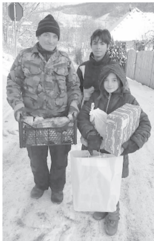
Nyárádszeredában és falvaiban a tűzoltók osztottak élelmiszert és édességet a rászoruló családoknak, gyerekeknek

ajándécsomagokat osztottak a 70. életévét betöltött 212 személynek, az iskola révén 110 gyerek is kapott ajándékot. Csíkfalva községben a 80. évüket betöltötték (80 személy) kaptak egyenként 20 lej értékű ajándékot, míg Nyárádgálfalva községben 13 ezer lejt (ebből 3 ezer a Surtec áruház hozzájárulása) szántak 226 gyerek és 95 idős (75. évét betöltött) megajándékozására. Székelybere községben 101 idős (75. éven felüli) és 170 gyerek kapott 20 lejes ajándécsomagot, Nyárádmagyaróson 220 gyerek és 160 idős (75. évnél idősebb) megajándékozására 15 ezer lejt fordítottak, Koronka községben 450 gyerek ajándékára 16 ezer lejt költött az önkormányzat, Ákosfalva község falvaiban a Surtec áruháznak köszönhetően 503 gyerek kapott ajándécsomagot karácsony előtt. A legbőkezűbb a backamadarasi önkormányzat volt, amely 12 ezer lejt szánt 200 gyerek megajándékozására, de Nyárádkarácson és Dózsa György községben is volt ajándékozás a gyerekeknek az iskolák költségvetéséből.