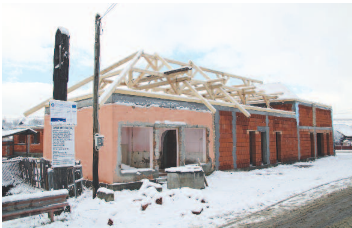
A jobbágytelki kultúrotthon

felépítését, aláírtuk vele a szerződést, nekifogott a munkának, és amikor a tetőt a régi épületről levette, az épület 80 százaléka összedőlt. A pályázat nem újjáépítésre, hanem felújításra szólt, amelynek értelmében a külső falakhoz nem szabad hozzányúlni, és a belsőt is csak illemhelyek, mosdók, kazánház kialakításakor szabad költöztetni. Ráadásul 2017 óta, kétszeres ráaszfaltozás miatt, emelkedett a megyei út szintje, ezért 40 centivel meg kellett emelni az alapot, ehhez pedig jóváhagyásra volt szükség Gyulaférvárról. Ez több hónapig váratott magára, addig nem tudtuk nekifogni az építkezésnek, az összedőlt falak miatt az épület 98 százalékát le kellett bontani, tulajdonképpen új épületet emelünk. Jelenleg a falak állnak, a kivitelező megöntötte a tetőszerkezet betonkoszorúját, ám az építkezési anyagok ára időközben annyira felment, hogy többször jelezte, ha nem találunk valami megoldást, inkább otthagyja a munkát. Az állam megengedte, hogy 26 százalékot rátegyünk az építőanyagokra az eredeti kiíráshoz képest, de ez sem elég ahhoz, hogy fedezze a költségeket. A gond az, hogy mi ugyan önrészből állnánk a hiányzó összeget – így is több mint tízmillió lejt az önrész