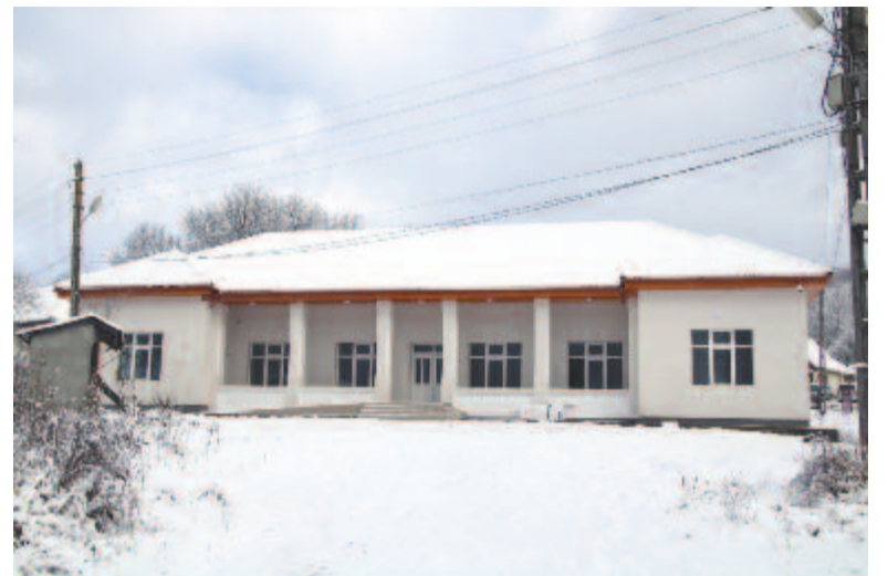
Az iszlói kultúrotthon

iskola teljes felújítására, a központi fűtés kialakítására, a kazánháznak otthont adó szárny felépítésére. Reméljük, hogy nyerni fog a pályázat, időben elküldtük, a kivitelezéssel együtt biztosan két-három éves folyamat előtt állunk. Két további kultúrotthonunk vár még felújításra: az ehedi és a hodosi. Utóbbit az elmúlt