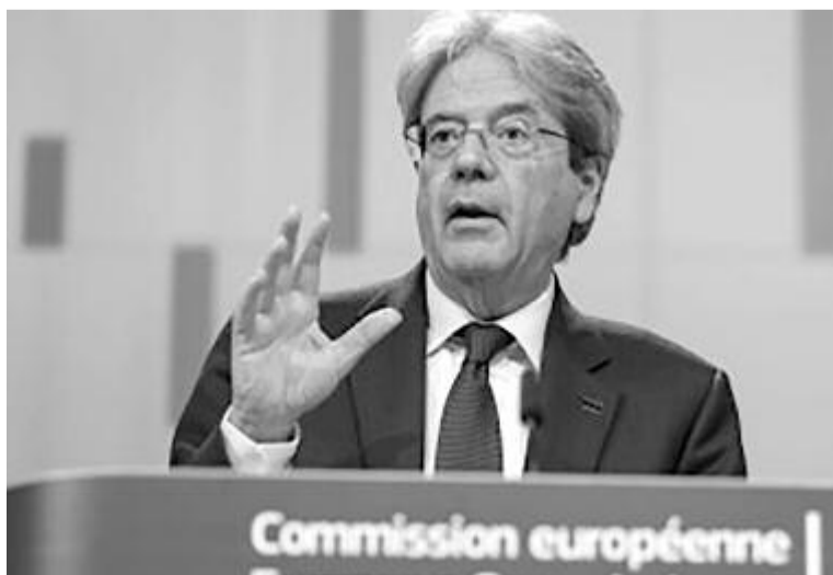
Margarethe Vestager (YouTube)

Hollandia adós a tervével, és a Bizottság a magyar, a lengyel, a svéd és a bolgár tervet nem fogadta még el. 17 tagállam már hozzájutott az összesen 52,3 milliárd eurós előfinanszírozáshoz. A helyreállítási és rezilienciaépítési eszközökből elsőnek várhatóan Spanyolország részesül 10 milliárd eurónyi vissza nem térítendő támogatásban azt követően, hogy a Bizottság úgy értékelte: az ország a kifizetési kérelméhez kapcsolódó legtöbb követelményt teljesítette. (mózes)