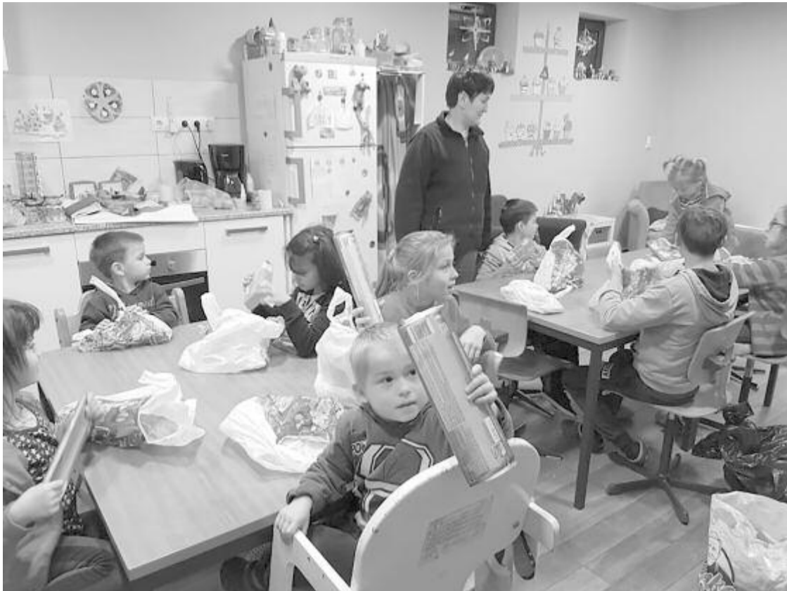
Az abodi gyereketthon lakói már meg is kapták karácsonyi ajándékaikat a rend tagjaitól