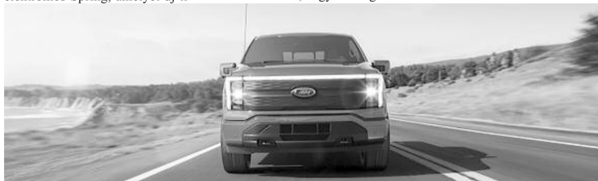
Ford F-150 Lightning pickup

De a Dacia Spring esetében sem fényesebb a helyzet. A teljesen elektromos Spring, amelyet új tí-