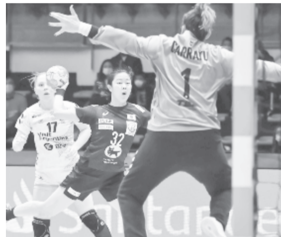
A nemzetközi szövetség elnöke szerint az idei tornán Japán nagyon jó teljesítményt nyújtott, így az ő fejlődése igazolja, hogy helyes a bővítési stratégia

Hasszan Musztafa felhívta a figyelmet, hogy a kis országok csapatainak az első meccse a spanyolországi tornán nem olyan volt, mint az utolsó, vagyis egy-két héten belül is látható volt némi fejlődés. „Nagyon fontos, hogy mindenhol legyen kézilabda, ne csak Európában. Ha megnézzük a legutóbbi férfi-világbajnokságot, nagyon jó csapatok érkeztek az öreg kontinensen kívülről is. Régen ez csak egy álom volt számukra” – magyarázta.