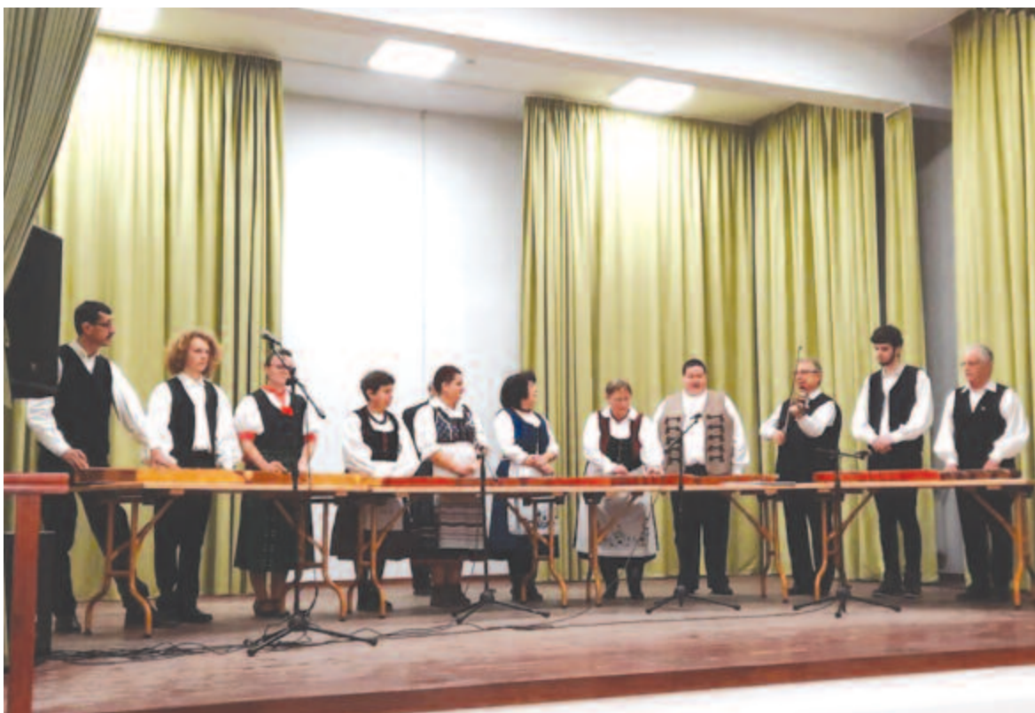
A Fagyöngy citerazenekar a felújított csittszentiváni kultúrotthonban