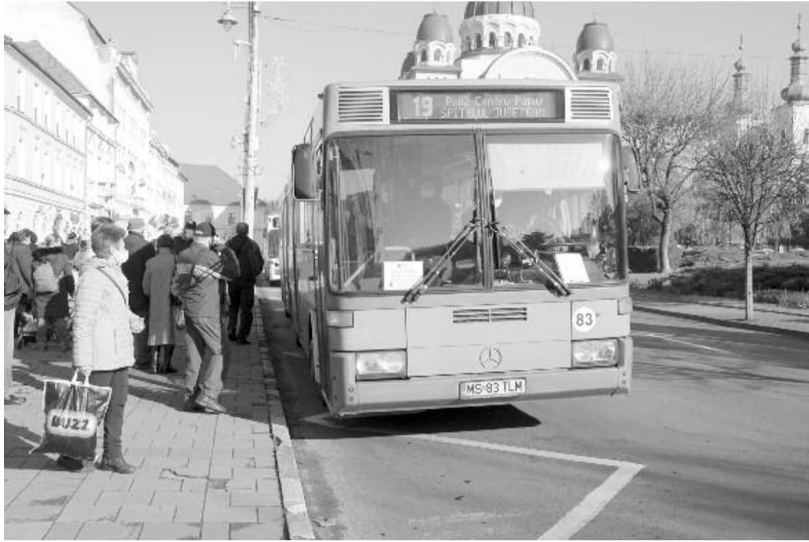
Fokozatosan lecserélik az autóbuszparkot

kat is meg kell építeni, ezeket most tervezik. A lassú töltőállomásokat a jelenlegi buszállomáson helyezik üzembe. A 12 méteres Solaris len-