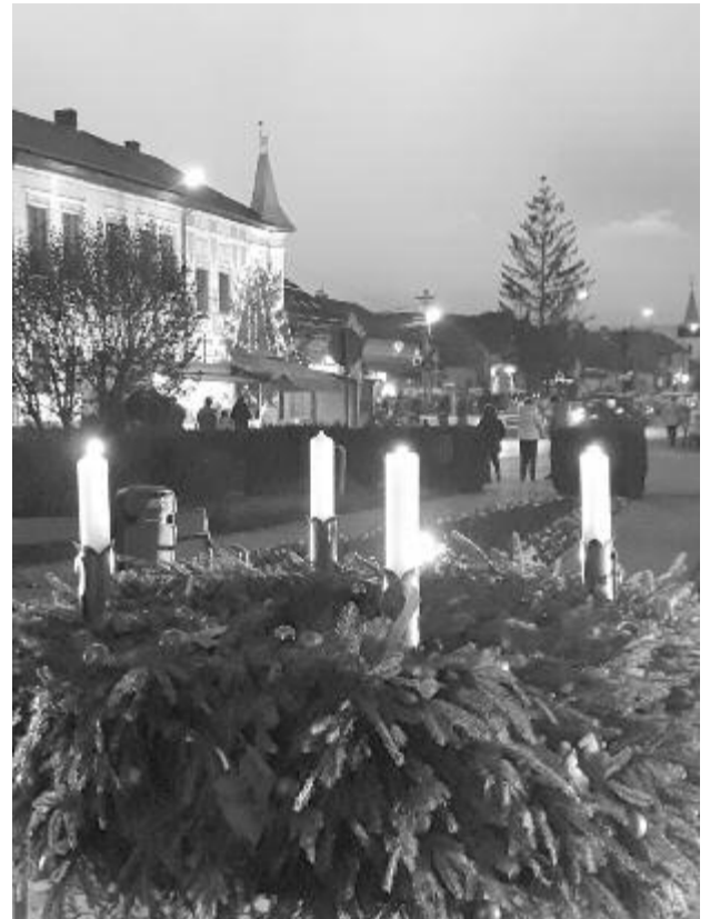
Az öröm lángját is meggyújtották a közösségi adventi koszorún

A szeredai adventi vásár a település Judit-napi (december 10.) egykori vásárainak hagyományára épülne. Nyárádszeredának 1790-ben három sokadalma volt: Polixénia