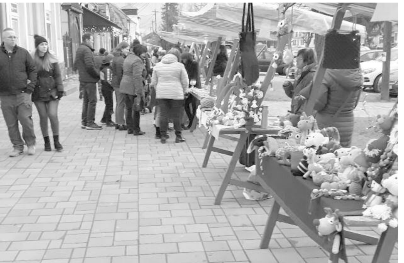
A kínálat gazdag volt, az időjárás kevésbé volt kedvező