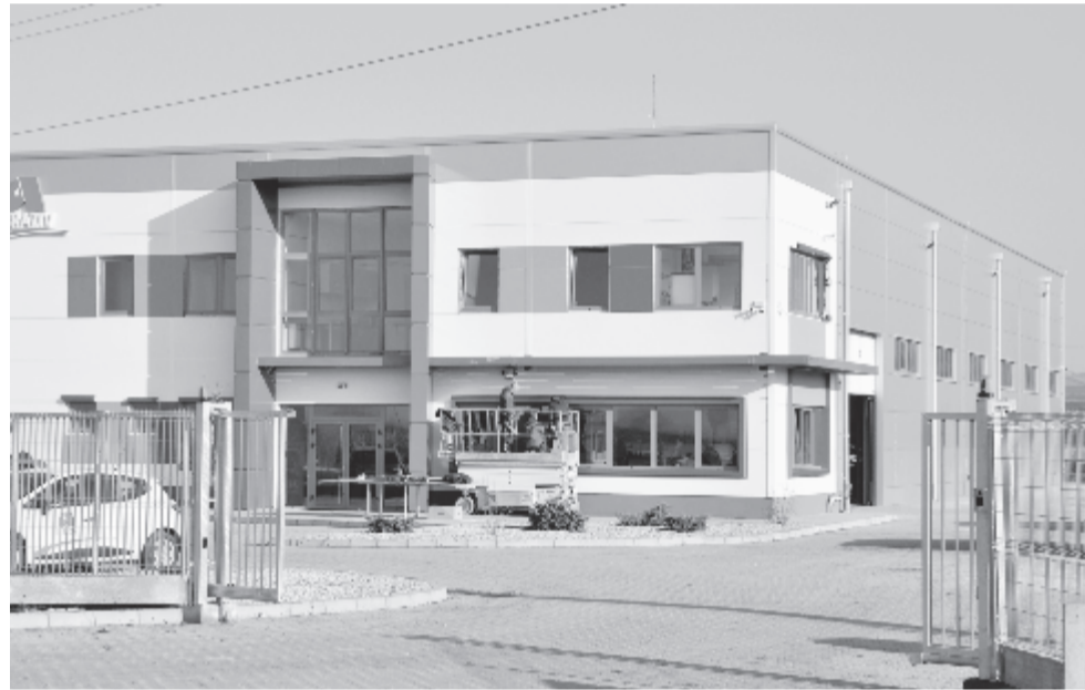
A kecskeméti Abráziv Kft. telephelye

A megyei ipari parkban levő, amerikai tőkével működő Euro Gas System – ipari kompresszorokat, kőolaj- és gázipari berendezéseket gyártó cég – bővítette telephelyét, még egy csarnokot épített, ahol több mint száz újabb munkahely lesz.