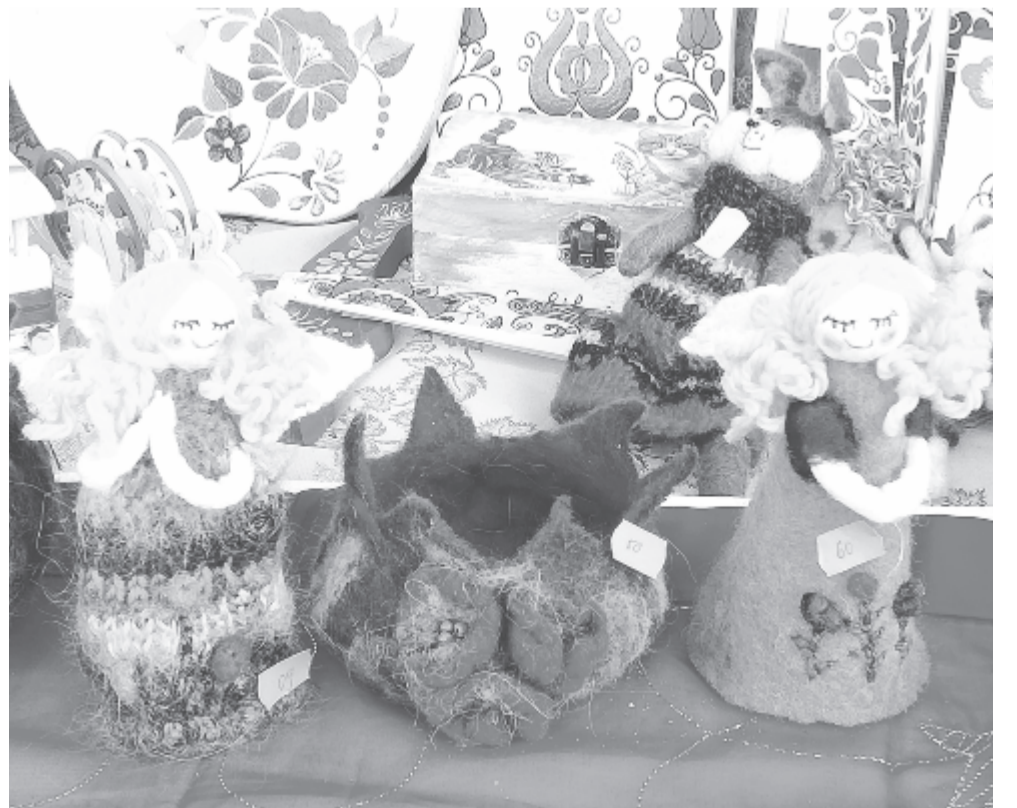
Kiss Katalin nemezeangyalkái a Színház téri karácsonyi vásáron

nak össze, miközben öröm volt, és öröm jelenleg is foglalkozni velük. És figyelhetném tovább a tárgyak nyomán kibomló emlékek sokaságát, amelyek úgy vesznek körül, mint kaptárt a vihar elől hazatérő méhek. De abahagyom, és arra gondolok, hogy mit adhatnék szeretteimnek ajándékba, hogy egyszer majd hasonló gondolatokat ébresszen bennük. (bodolai)