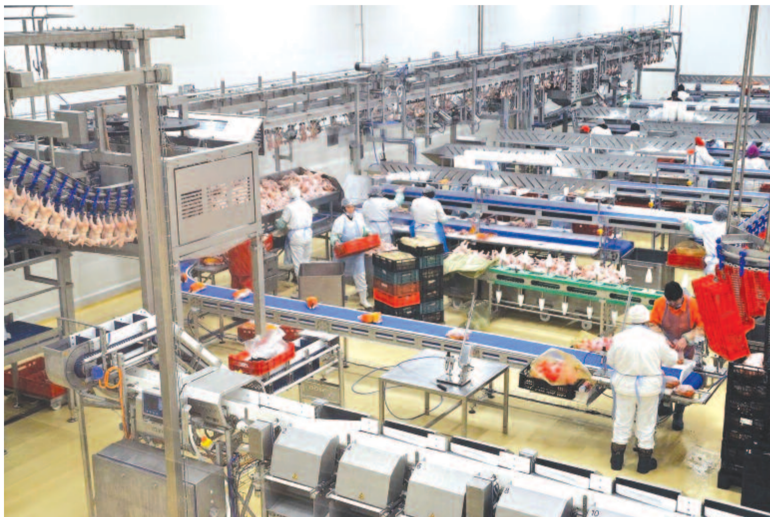
A kerelőszentpáli Oprea Avicom csirkevágóhídja