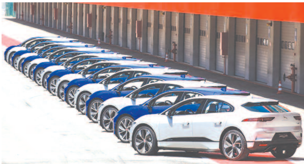
Jaguar I-pace flotta

Az elektromos kínálat feltehetően két crossoverrel és két kétajtós kupéval indulna, körülbelül 125 ezer eurós árnál kezdődne a legolcsóbb, ami, figyelembe véve a Bentley árszintjét, nem is olyan drága. Viszont nem szabad elfelejteni a vetélytársakat, hiszen a következő négy évben ők is előállhatnak valami hasonlóval (például a Bentley Bentayga elektromos változatával), és az nagymértékben csökkenthetné az új Jaguárok piaci képességét.