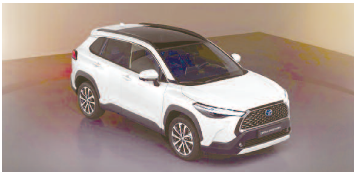
Toyota Corolla Cross