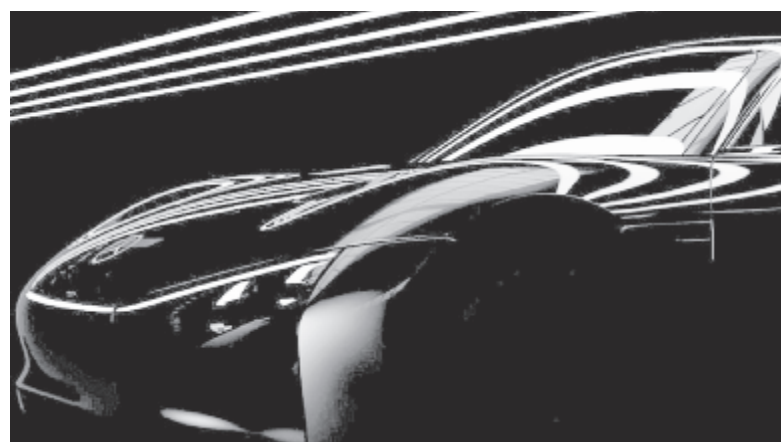
Mercedes EQXX koncepció

lesz első- és összkerekhajtással is. Továbbá a Toyotától megszokott módon ez a típus is hibrid lesz, méghozzá 5. generációs hibrid rendszerrel lesz szerelve, ami azt jelenti, hogy teljesen újratervezték az akkumulátorokat, ezek tömege 40%-kal kevesebb, mint az előző generáció esetében, valamint a hatékonyságuk nagyobb. Összességében 8%-kal nőtt a rendszer összteljesítménye. A gyártó szerint