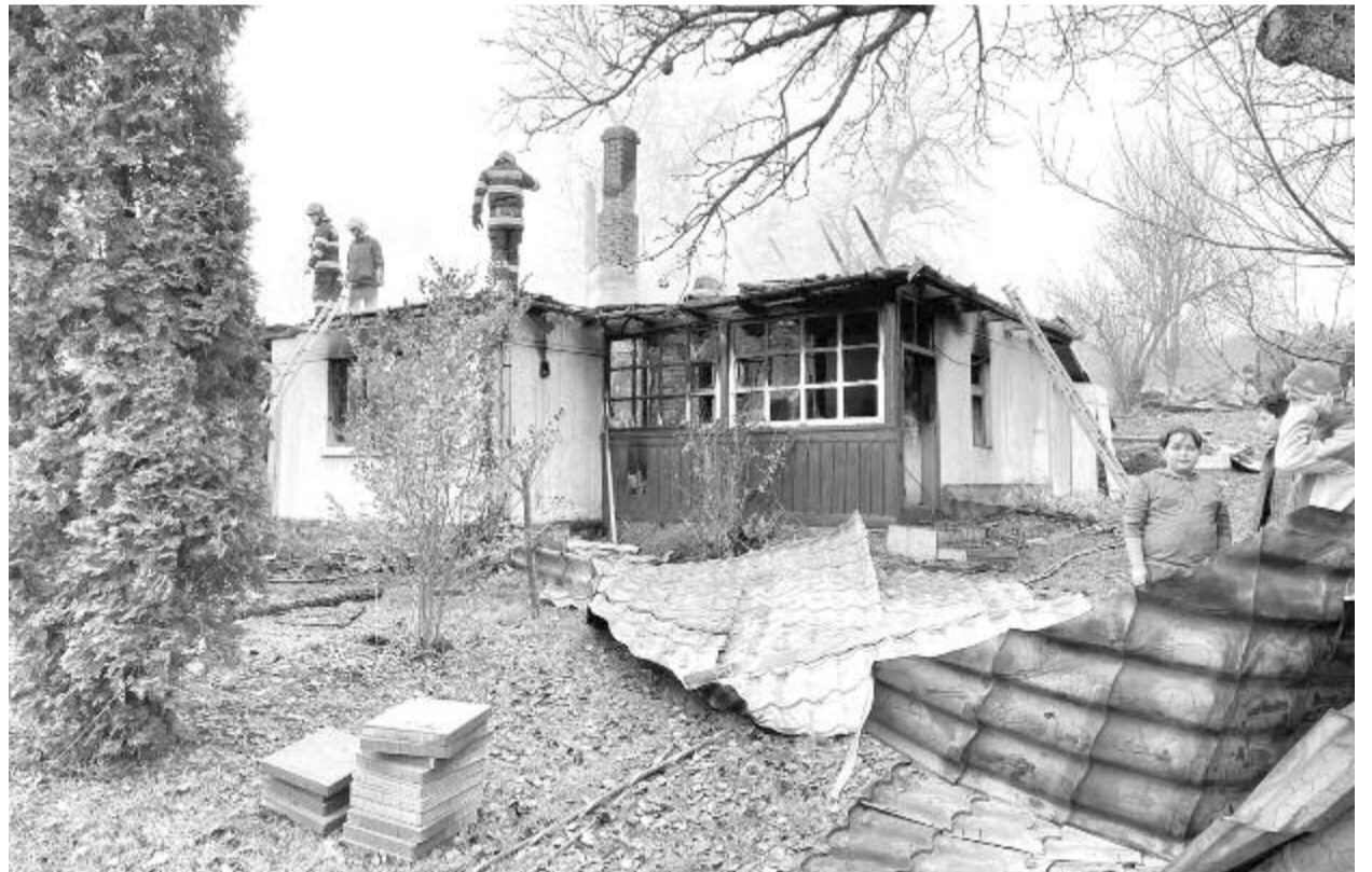
Nyárádmagyarósaon a figyelmetlenség okozott szerencsétlenséget

Pénteken este Marossárpatakon egy száz négyzetméteres lakóház kapott lángot. A helyszínre a marosvásárhelyi tűzoltókat hívták ki, akiknek sikerült megfékezniük a lángokat, de a ház teljesen leégett. (grl)