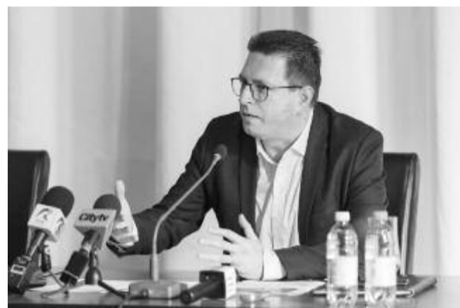
Vincze Loránt európai parlamenti képviselő

Vincze Loránt hangsúlyozta, hogy hatalmas lehetőség áll Románia és az erdélyi térség előtt, ezzel pedig muszáj élni. Az uniós pénzalapok lehetőséget teremtenek arra, hogy számos terület fejlődjön. Az európai parlamenti képviselő elmondta, hogy számos jó projektet mutattak be neki Marosvásárhely kapcsán, és reményét fejezte ki, hogy minél több megvalósul ezek közül. A képviselő tisztában van vele, hogy egy mandátum alatt lehetetlen az összes tervet és ötletet megvalósítani, de azon kell dolgozni, hogy minél több sikerüljön, hiszen a városra ráfér a fejlődés a többéves stagnálás után. Vincze Loránt arról is beszámolt, hogy a beruházásra