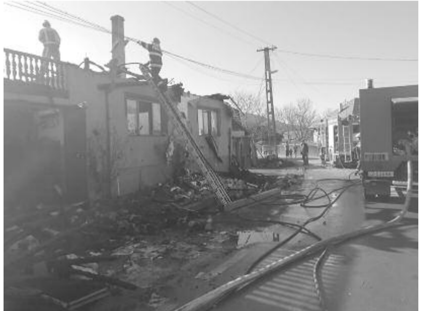
A tüzesetet követően a családi ház tetőzete teljesen elpusztult

A Molnár család lakásában múlt vasárnap délelőtt csaptak fel a lángok, a tűzoltókat 10 óra után néhány perccel risztotta a diszpécserszolgálat: a nyáradszeredai hivatásosok 4, az önkéntesek 6, a marosvásárhelyi hivatásosok 5, a csikfalvi önkéntesek pedig 8 személlyel siettek a tűz megfékezésére. A lakás tetőterében kiűtött tüzet már az elején sikerült elszigetelni, hogy ne terjedjen át a mellék- vagy szomszédos épületekre,