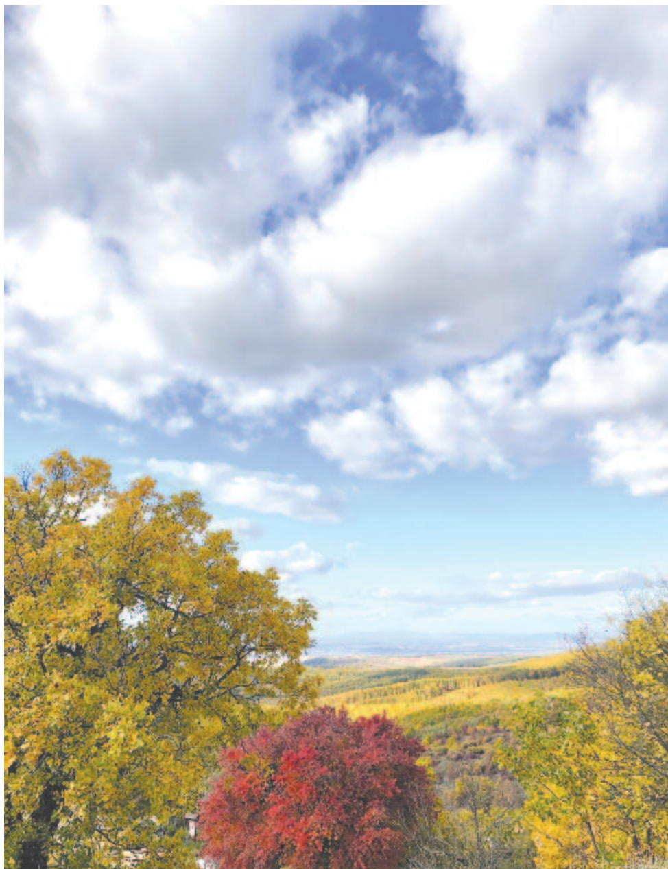
...az erdők tengerének árja, (...) fellegekben úszik koronája

Kelt 2021-ben, november 5-én, 88 évvel azután, hogy 1933-ban először vétőzta meg a spanyol állam a baszk önrendelkezést.