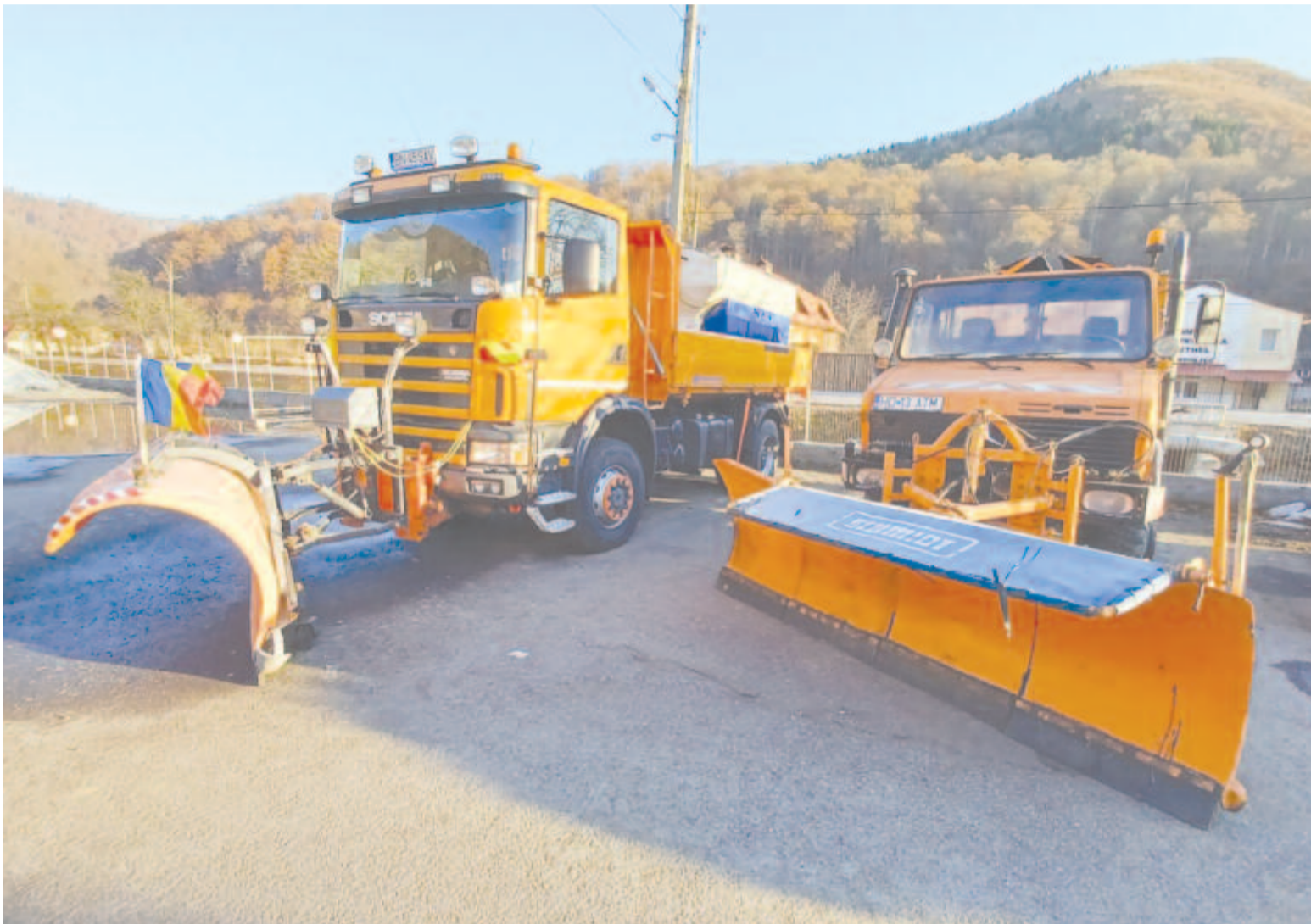
Maros megyei telephelyek