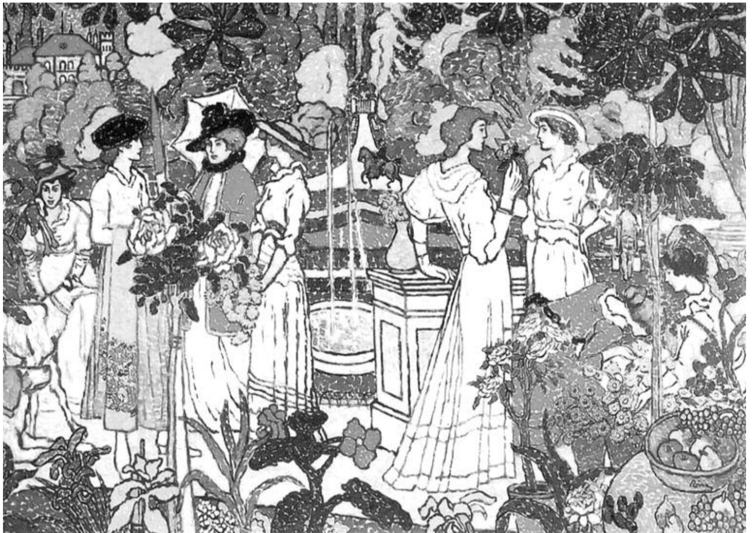
Asszonyok a parkban, 1908

1921. november 27-én, 100 évvel ezelőtt született Budapesten a Baumgarten-, József Attila- és Kossuth-díjas szerző, a huszadik század egyik legjelentősebb magyar költője. Elhunyt 1981. május 27-én.