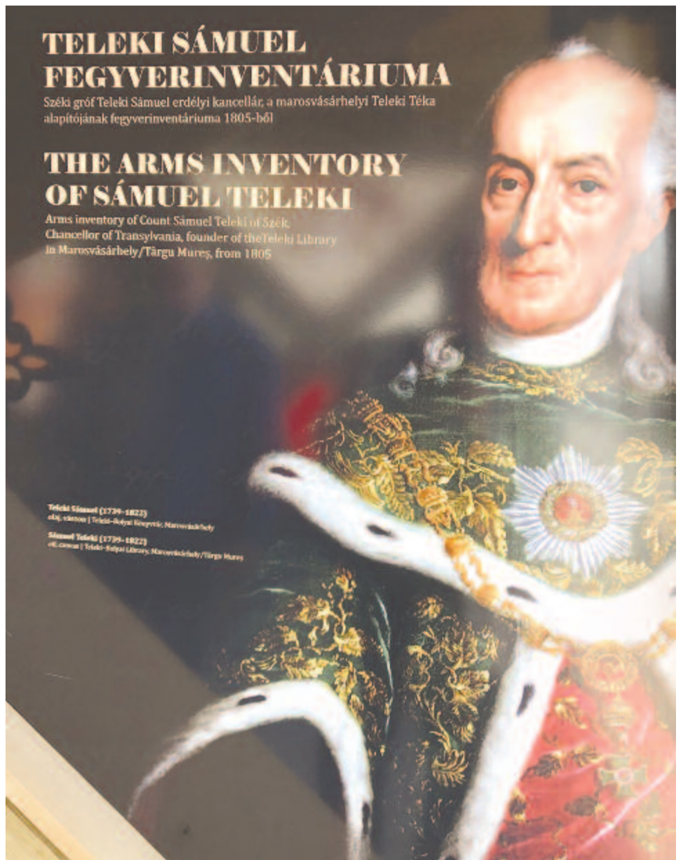
Teleki Sámuel fegyverinventáriuma 1805-ből a 2021-es Egy a Természettel Világkiállításon

A Homo sapiens szétszórt jó néhány in-vazív fajt a bolygónkon, s ez geológiai léptékben rövid távon, emberi lépték szerint hosszú folyamatként, a biodiverzitás ellen