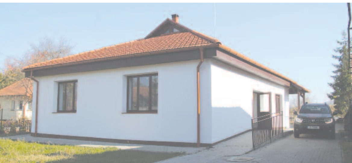
A felújított orvosi rendelő