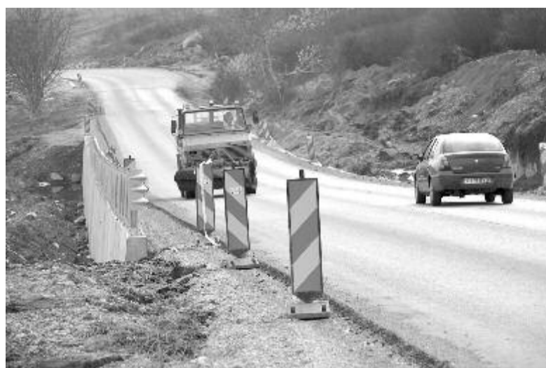
Aszfaltozás a csergedi tetőn

Folyamatosan bővül a marosvásárhelyi Transilvania repülőtér. Mint ismeretes, bővül az utasforgalmi területe, korszerűsítik az utasfogadó berendezéseket, bővül a repülőgép-parkoló, és folyamatban van a jelző-világítási (ún. vakleszálást irányító) rendszer korszerűsítése. Ezen kívül elkészült a leszállópálya esővíz-begyűjtő rendszere és az ehhez tartozó új szivattyúállomás. A fejlesztésekhez tartozik még egy ún. multimodális közlekedési csomópont kiépítése. A napokban választják ki versenytárgyalás nyomán azt a céget, amely elkészíti a megvalósíthatósági tanulmányt. A légikikötő vezetősége közben folyamatosan azon dolgozik, hogy bővítse a Marosvásárhelyről induló és ide érkező repülőgépjáratokat. Az idén a WizzAir légitársaság beindította a heti