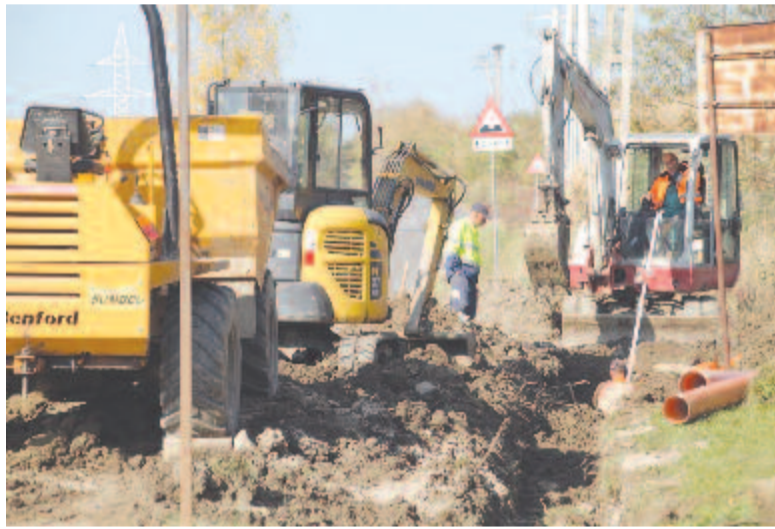
Dolgoznak a köhéri úton

pokban pedig benyújtottuk az ennek bővítésére szánt pályázatunkat. Leadtunk továbbá három tervet a vármezői iskola és óvoda, a kőszvényesi és mikházi óvoda teljes felújítására. A kőszvényesi iskolát visszakapta az egyház, azt magyar