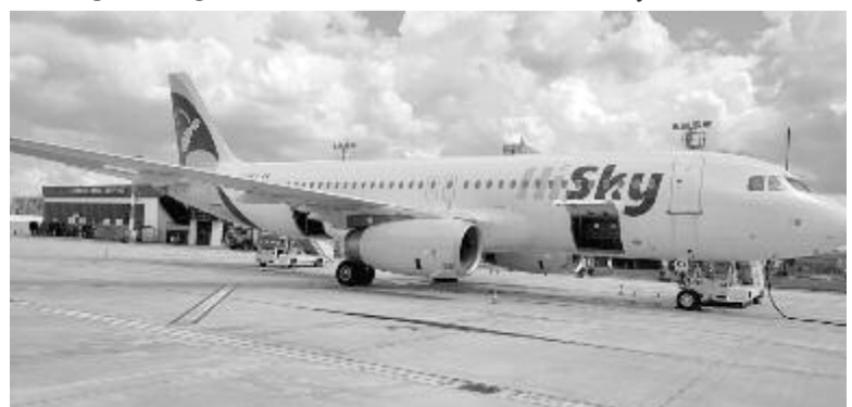
A HiSky légitársaság gépe a Transilvania reptéren

A megyei tanács – akár turisztikai desztinációként is – fenntartja és működteti a Transilvania Motor Ringet. Nemrég egyszerűsítették a pályabérlés szabályait, hogy minél többben vegyék igénybe ezt a lehetőséget. A vírushelyzet ellenére március-október között, a szabályokat betartva, 45 versenyt szerveztek, ebből az egyik a triatlon-Európa-bajnokság volt, és tíz motorkerékpár- és más országos bajnokság helyszíneként is szolgált a pálya, amelynek egyes szakaszain javítási munkálatokat is végeztek. A motorsport támogatásaként Mezőbánd határában egy 10 hektáros területen korszerű tereppályát (enduro) is kialakítanak. Amint többször tájékoztattuk olvasóinkat, képviselőházi döntésre vár az a jogszabálytervezet, amelyet, ha elfogadnak, átkerül a Marosvásárhely–Szováta közötti