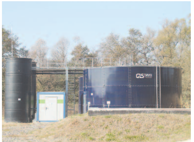
Az ülepítő csak az engedélyekre vár

– Két nagyobb gondunk van, az egyik a telekkelések helyzete. A község területét 8300 hektár képezi, a felmérés és parcellázás meg fog történni, mert bekerültünk az országos, a telekhelyzetet megoldani kívánó programba, ám ez idáig nem jött senki elvállalni ezt a munkát. A másik problémát a vadkárok jelentik: 10-14 iratcsomó, rengeteg panaszlevél tartalmazza ezeket. Vármezőn több helyre is bement a medve, tönkretette a kerteket, a medencéket, elvitt több malacot és tyúkot. Egy esetben egy idős asszony nem is látta, hogy mi jár hátul, és a kaput rányitotta a medvére, futott utána és üvöltött, gondolom, azt hitte, betörő jár a kertben. Látuk a