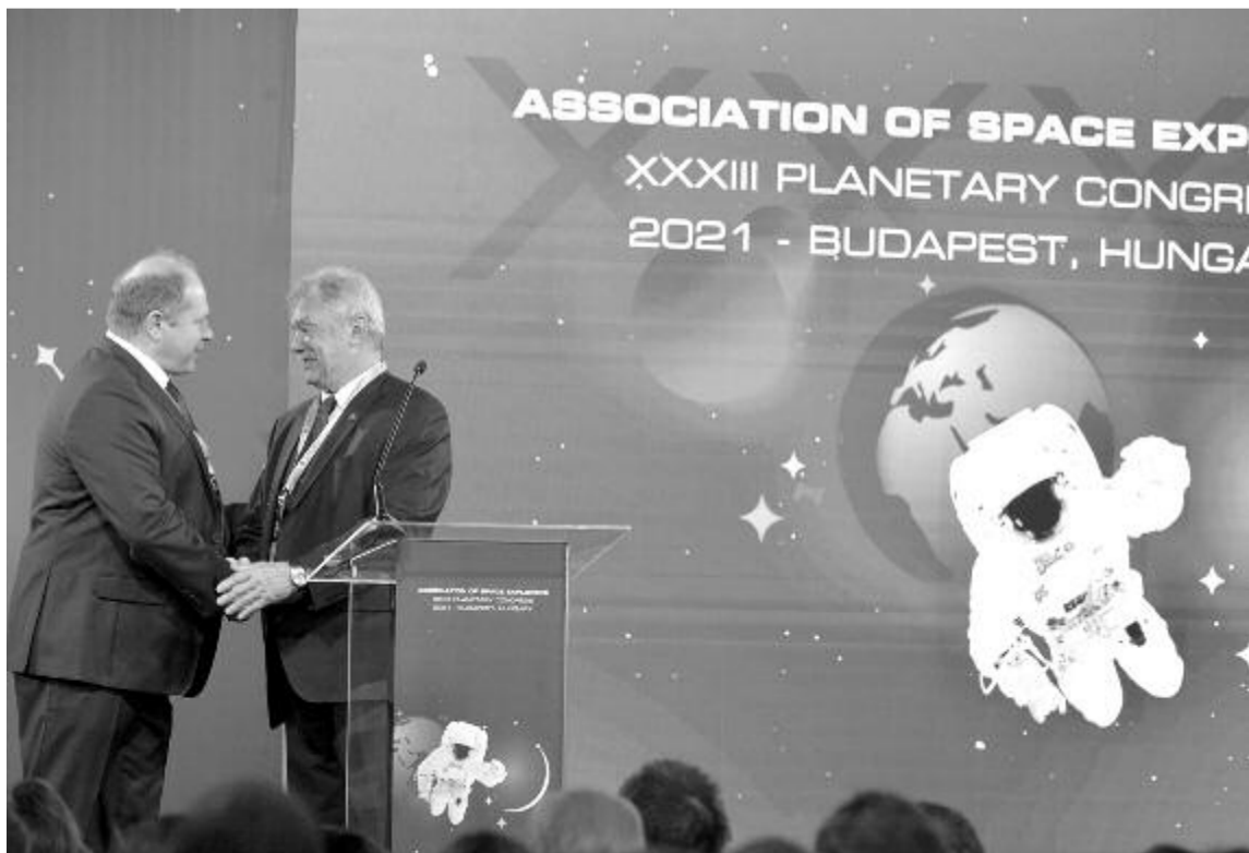
A Nemzetközi Űrhajós Szövetség 33. kongresszusa Budapesten