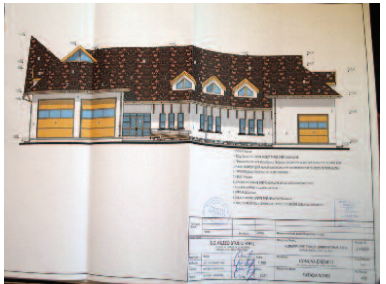
Az új tűzoltóépület tervrajza

– Számos helyre hívják az önkéntes tűzoltóinkat. Hozzánk tartozik például Köhér, de Szovátára is hívják, ha gond van. Két autónk van, és több mint húsz önkéntessel rendelkezünk. Ha megszólal a riasztó, mindenki azonnal megkapja az sms-t, hogy öt percen belül indulás, tűz van. Április 25-től öt riasztásunk volt, a legutóbbi október kilencedikén, Szovátára. A tűzoltóegységet egy alapítvány működteti, amelyet az önkormányzat is támogat, és nagyon szeretném, ha megvalósulna az egyik újabb tervünk, egy új tűzoltósági székhely felépítése. Az épület terve elkészült, az említett tornateremhez hasonlatos, a faluképbe illeszkedő székhelyet szeretnénk felépíteni, amely mindezzel rendelkezik az önkéntes tűzoltóság megfelelő működéséhez, működtetéséhez.