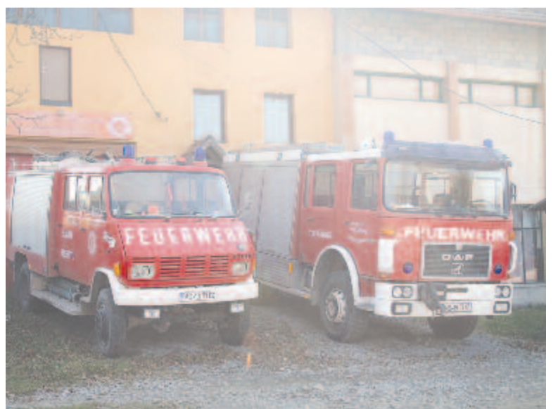
A tűzoltóság autói