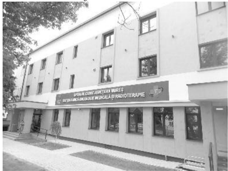
Felújították az onkológiai klinikát Az egészségügyi rendszer fejlesztése