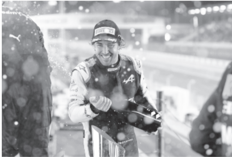
A kétszeres világbajnok spanyol pilóta 2014 után először örülhetett így a verseny végén.

A címvédő és hétszeres világbajnok Lewis Hamilton, a Mercedes brit versenyzője nyerte vasárnap az első Forma-1-es Katari Nagydíjat, ezzel nyolc pontra csökkentette hátrányát a vb-pontversenyben. A 36 éves Hamiltonnak ez volt az idei hetedik és pályafutása 102. futamgyőzelme.