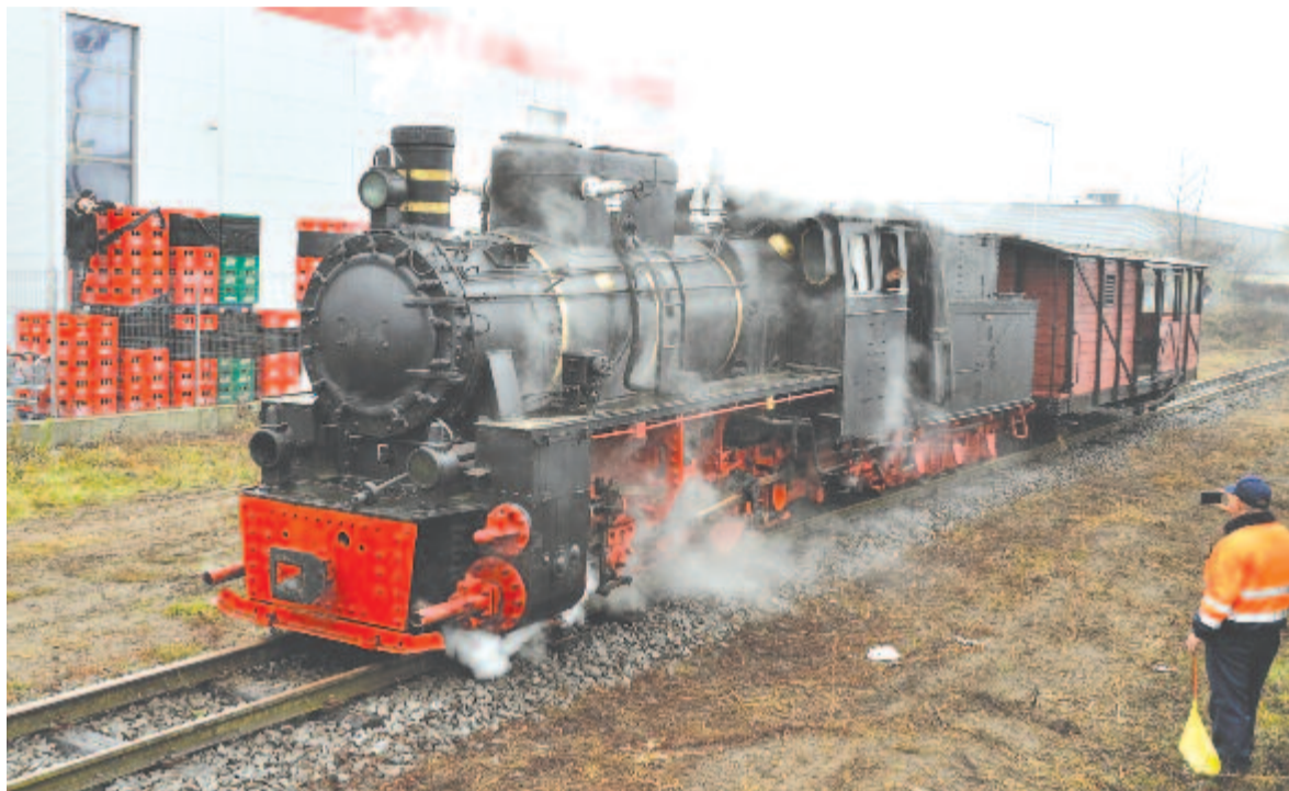
Gőzmozdony a kis nyomtávú síneken

A gyerekek és felnőttek öröme az állomás egyik helyiségébe – ahova egy múzeumot szándékoznak berendezni – egy vasúti terpasztalt is beállítottak, ahol a kis szerelvények alagúton közlekedtek, állomásban időztek, mint a nagy, igazi