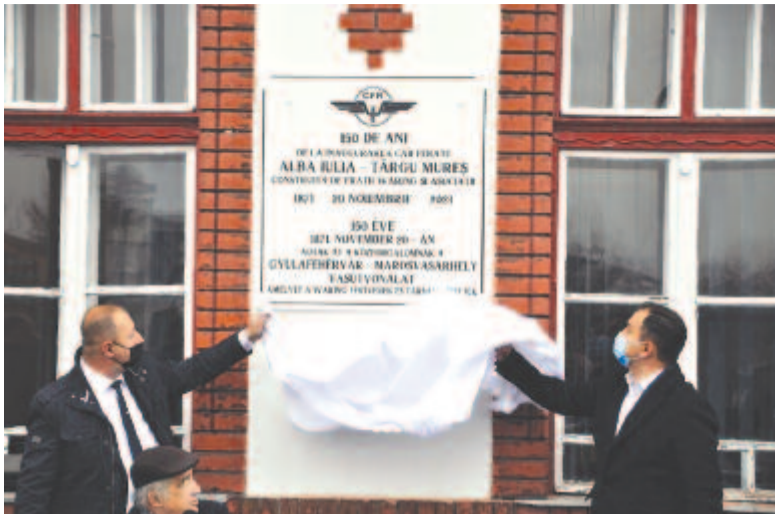
Leplezték a jubileumi emléktáblát