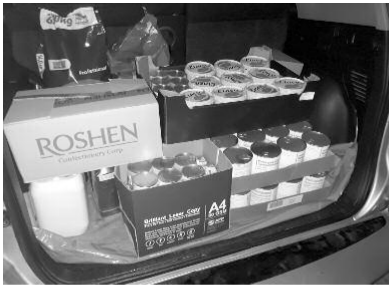
Hála az adományozóknak, élelmiszer, mosó- és tisztítószer is gyűlt.