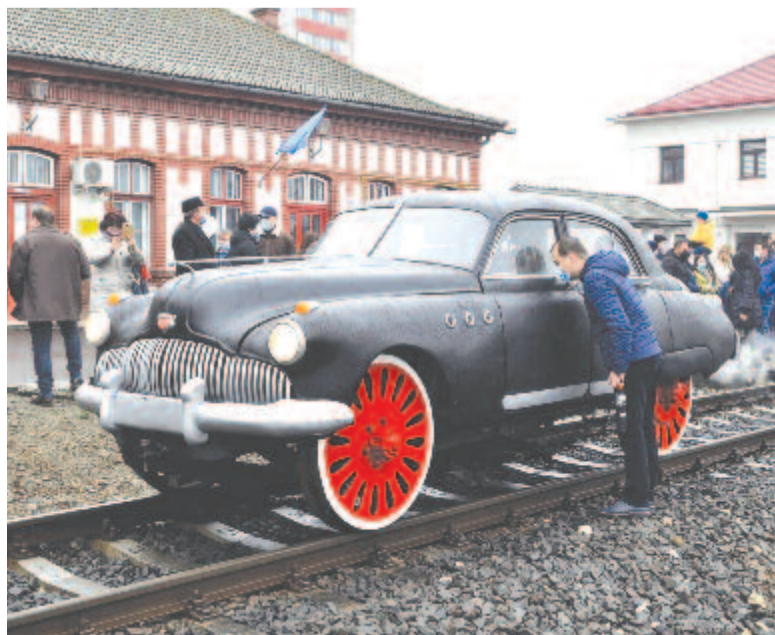
Az 1940-es Buick motoros pályakocsi

Tegyük hozzá, 150 esztendővel ezelőtt csupán három év alatt 600 km vasútvonalat építettek Erdélyben, ez példaértékű lehetne. Remélhetőleg végre valóban felzárkózzunk a civilizált közlekedésű európai társaságok közé, és nem kell újabb másfél évszázadot várni például a Székelykocsárd és Déda közötti vonal villamosítására.