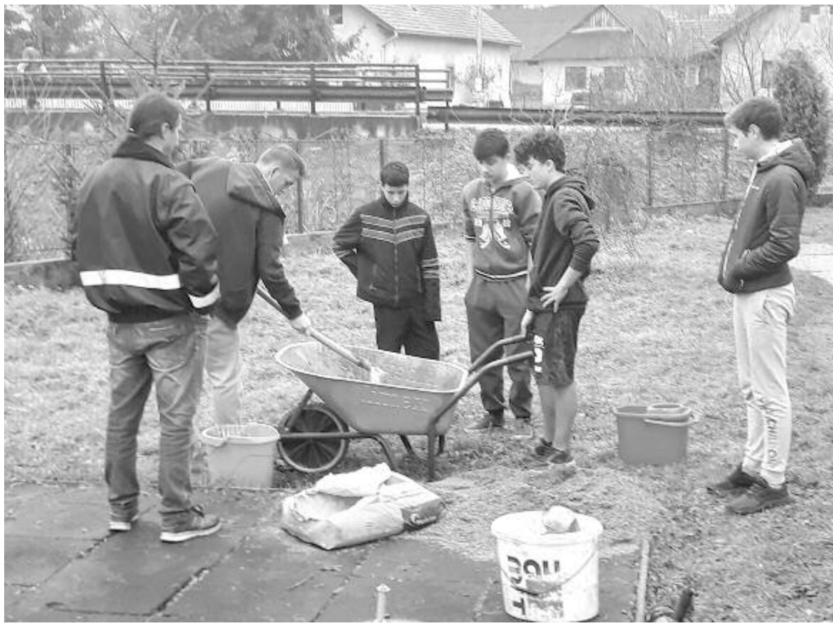
Az otthon lakói szívesen vettek részt a munkában