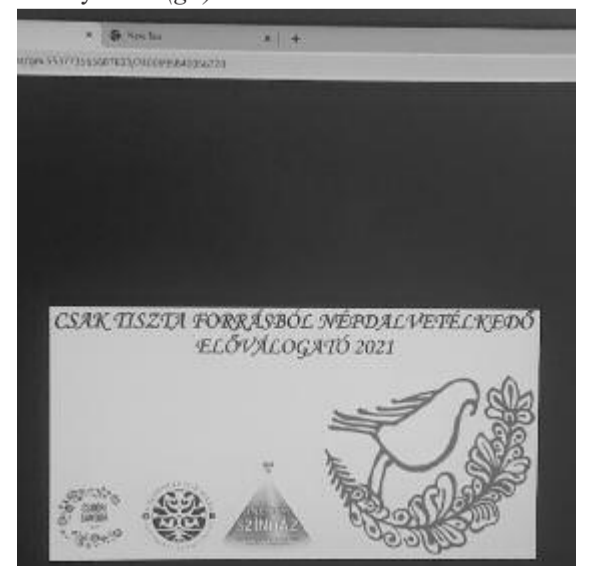
Az idei megyei válogatás online térben zajlott (Fotó: illusztráció)

Az eredeti elképzelés szerint a székelyföldi döntőre Székelyudvarhelyen került volna sor november 20-án, de a jelenlegi helyzetre való tekintettel ez módosul, az érintetteket időben értesítik a szervezők a további fejleményekről. (grl)