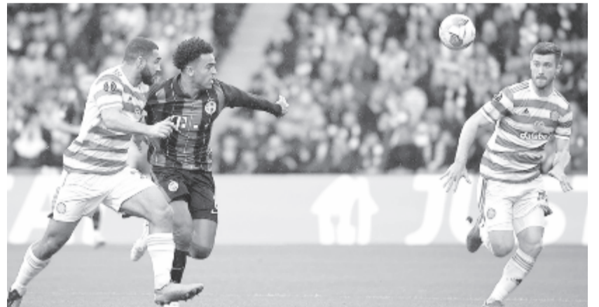
A Ferencváros Glasgow-ban zsinórban harmadszor veszített a főtáblán.

(angol) – Genk (belga) 3-0, Rapid Béc (osztrák) – Dinamo Zágráb (horvát) 2-1. Az állás: 1. West Ham