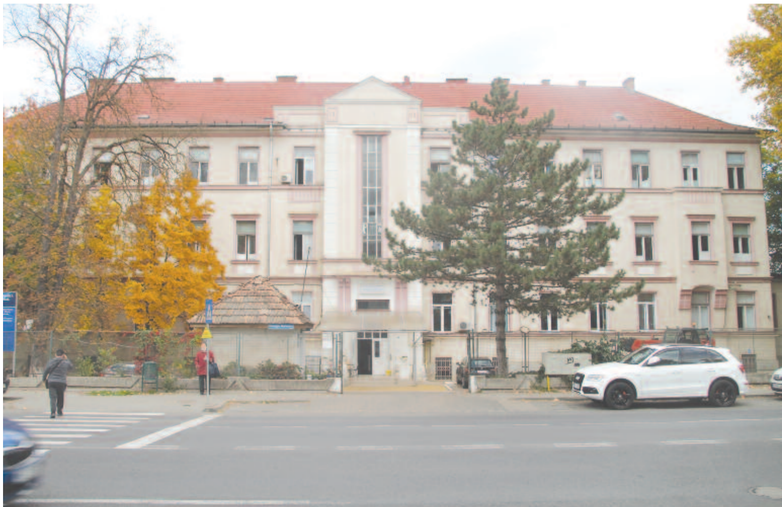
Felújítják a tüdőklinikát