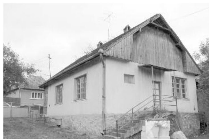
Felújítanák az egykori háziorvosi lakást

Évek óta üresen áll a nyárádmagyarósi önkormányzat tulajdonában levő ingatlan, amelyet korábban a községközpontban lakó családorvos használt. Nyugdíjba menetele után nem volt, aki beköltözzön, így romos állapotba került az épület. Hogy a fiatal orvosok számára is vonzóvá tegyék a községet, azt tervezik, hogy felújítják a lakást, és az udvaron levő új épületben rendelőkét alakítanak ki. Az utóbbi épület egy pályázatból épült, de miután lejárt a program, nem használták. Úgy tűnik, hogy a PNRR-s programon keresztül lesz pályázati lehetőség, csak még nem készült el az útmutató. Ahogy ez megjelenik, hozzáfognak a felújítási tanulmányokhoz. Mindenképpen a két ingatlan felújítása és rendeltetésszerű átalakítása a jövő évi költségvetés összeállításakor prioritás lesz – tájékoztatott a polgármester. (v. gy.)