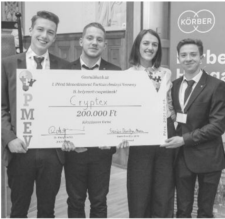
A Cryptex csapat

A versenyre 2021. október 16-18. között került sor a Pécsi Tudományegyetem Közgazdaságtudományi Karán. Témáját egy ingatlankezelő vállalat szolgáltatta. A Kárpát-medencei online selejtezőt sikeresen teljesítő tizenkét csapatnak 30 óra állt rendelkezésére megoldani a vállalat gazdasági problémáját. A vállalat egy adatközpontot akart