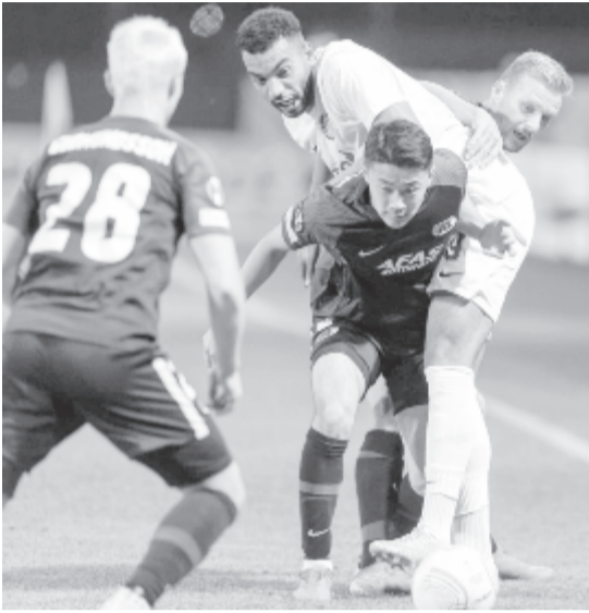
Eredménytelenül küzdött holland ellenfelével a román bajnok.

A második féldélben már hiába vette át a kezdeményezést a román bajnok, Bilel Omrani feje és lövése is középre ment, a végén pedig Claudiu Petrilă szabadrúgása után a felső léct súrolva került kapu fölé a labda.