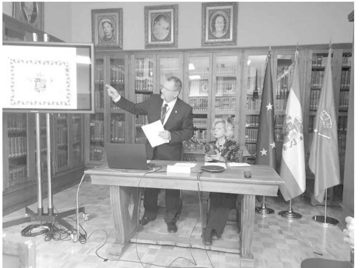
Előadás közben az Erdélyi Címer- és Zászlótudományi Egyesület elnöke