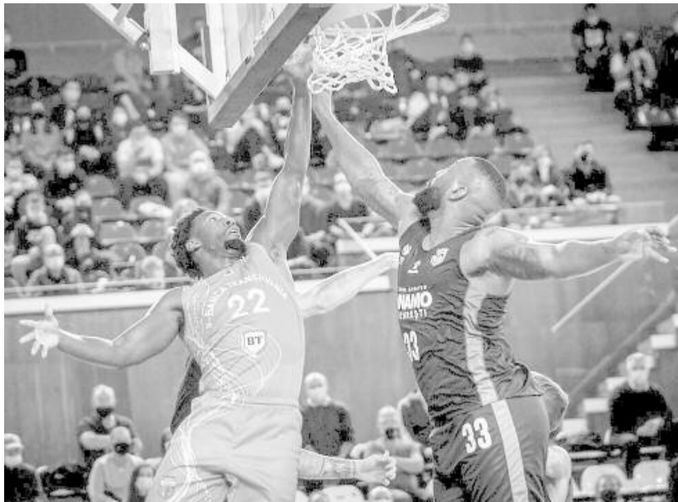
Kolozsvár simán nyert a Dinamo ellen

Kosárlabda Nemzeti Liga, 4. forduló: Bukaresti Dinamo – Zsilvásárhelyi CSM 94:91, Bukaresti Steaua – Bukaresti Rapid 91:88; 5. forduló: Foksányi CSM – CSM Ploiești 84:86, Kolozsvári U-BT – Bukaresti Dinamo 82:60, Csíkszeredai VSK – Bukaresti Steaua 86:89, FC Argeș Pitești – Konstancai Athletic Neptun 77:76, Zsilvásárhelyi CSM – Temesvári SCM OMHA 64:69, Nagyvárad CSM – Galaci CSM 84:62. A Bukaresti Rapid – SCM U Craiova és a Nagyszebeni CSU – CSO Voluntari mérkőzés lapzártá után fejeződött be.