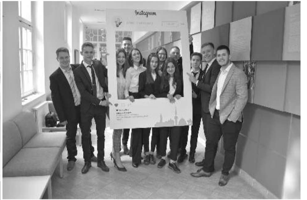
A BBTE versenyzői