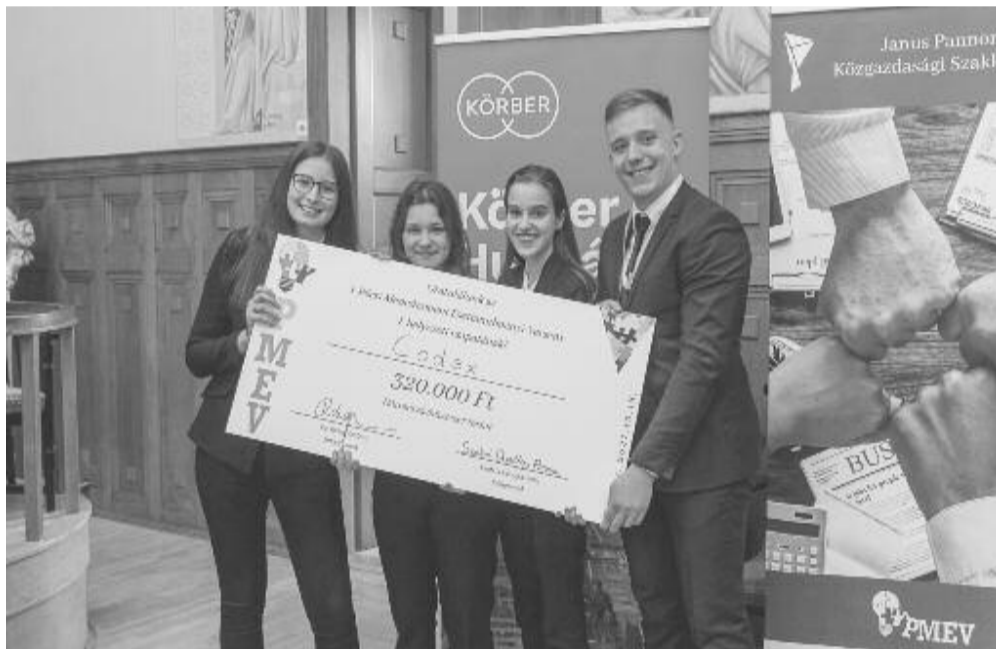
A Codex csapat

(A BBTE Közgazdaság- és Gazdálkodástudományi Karának közleménye)