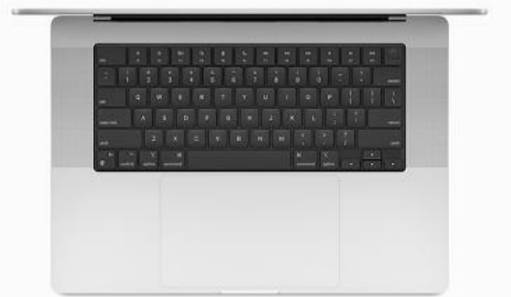
A billentyűzet új kialakítása

quid Retina Pro XDR-nek is szokta nevezni. A kijelző felbontása a 14 colos változat esetében 3024x1964 pixel, míg a nagyobbánál 3456x2234. Mindkettő kiemelkedően magas, egyértelműen a piacvezető kijelzők közé sorolja az Apple új laptopjait. Van egy érdekes meglepetés is, a laptopok tekintetében eltűnt a TouchBar – természetesen lesz olyan személy, akinek ez hiányozni fog, másoknak pedig egyáltalán nem. Ezt döntse el mindenki, hogy veszteség vagy sem a TouchBar. Viszont annak ismeretében, hogy egy sokkal jobb kialakí-