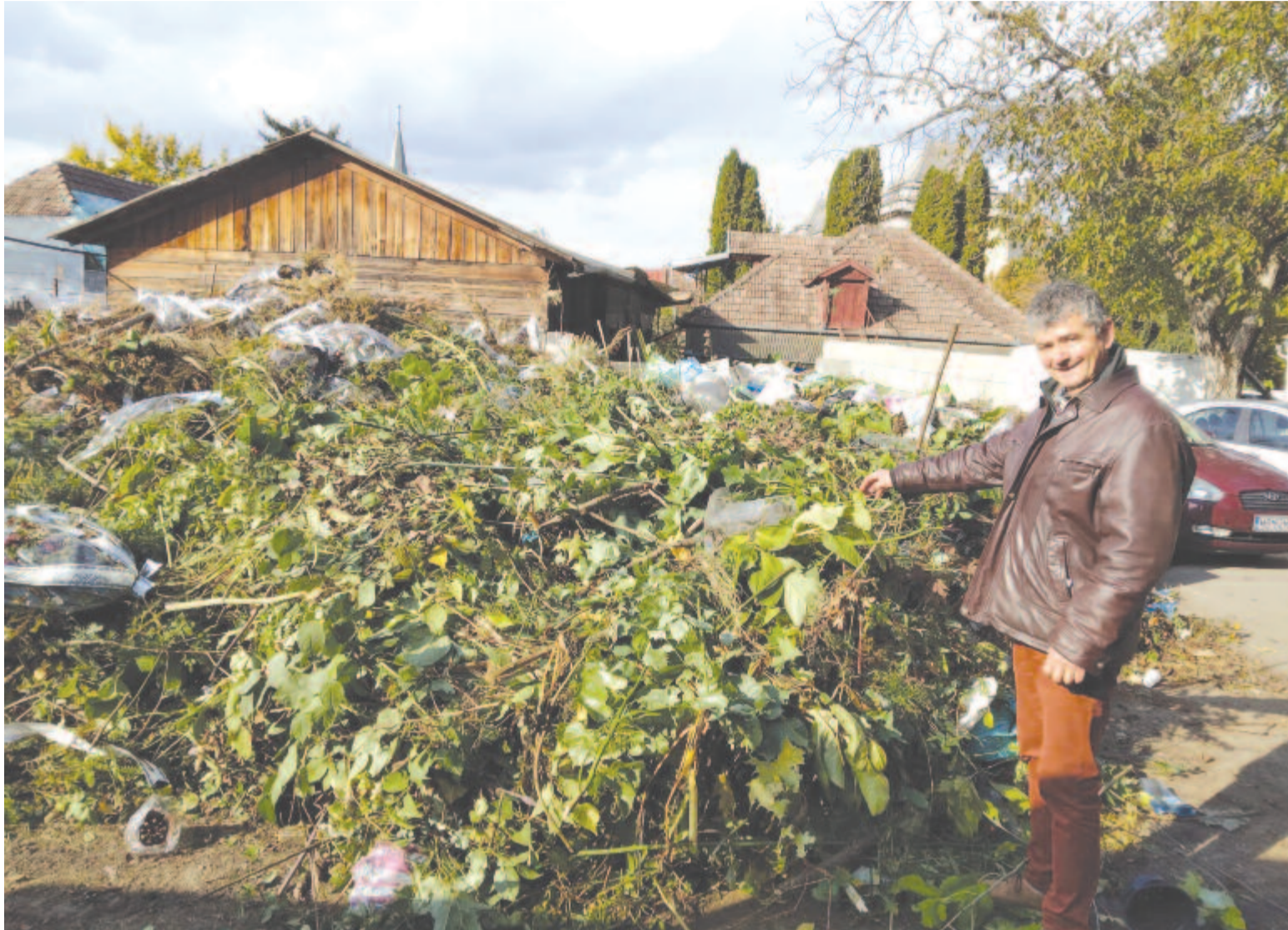
Az összegyűjtött szemét