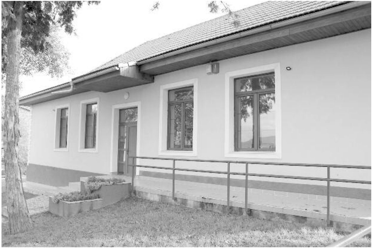
Lakókra vár a felújított, de üresen álló óvoda