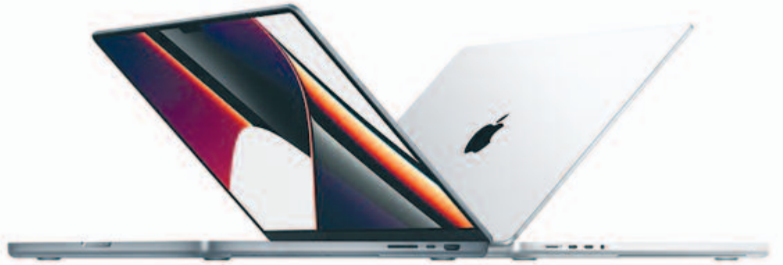
Az Apple új laptopjai

quid Retina Pro XDR-nek is szokta nevezni. A kijelző felbontása a 14 colos változat esetében 3024x1964 pixel, míg a nagyobbánál 3456x2234. Mindkettő kiemelkedően magas, egyértelműen a piacvezető kijelzők közé sorolja az Apple új laptopjait. Van egy érdekes meglepetés is, a laptopok tekintetében eltűnt a TouchBar – természetesen lesz olyan személy, akinek ez hiányozni fog, másoknak pedig egyáltalán nem. Ezt döntse el mindenki, hogy veszteség vagy sem a TouchBar. Viszont annak ismeretében, hogy egy sokkal jobb kialakí-