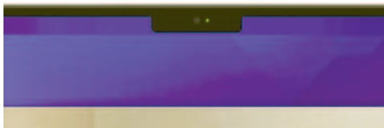
Notch a laptopokon

a MagSafe-re pedig lehetett számítani, hiszen ez az Apple saját töltőtechnológiája, ami egy másik kiegészítőt igényel, és ezáltal további bevételt hoz a vállalatnak. A bemutatón továbbá szó volt arról is, hogy az amerikai vállalat nagy hangsúlyt fektet a térbeli hangzásra, és elmondásuk szerint a harmadik generáció ugyanazokkal a fejkövetési technológiákkal van felszerelve, mint az AirPods Pro és az AirPods Max. De a fülhallgató mikrofonja is fejlődött, amely most már HD minőségű hangszintet kínál. Ezzel az Apple szerint tisztá, természetes kommunikációra van lehetőség. Az újdonság megkapta az AirPods Protól a már említett nyo-