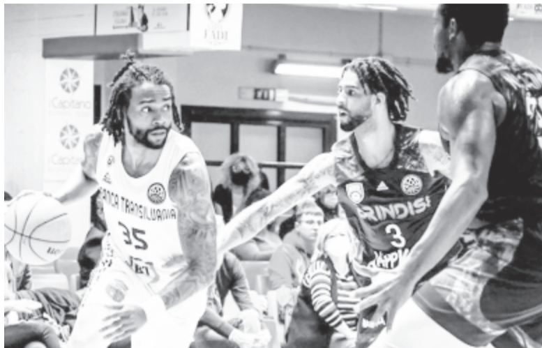
Második mérkőzését is megnyerte a Bajnokok Ligájában az U-BT

* A Kolozsvári U-BT megszerezte második győzelmét a kosárlabda Bajnokok Ligájában. Hétfőn az olasz Happy Casa Brindisi otthonában 76:71-re nyertek a kolozsváriak, akik 4 ponttal vezetik a G csoport tabelláját.