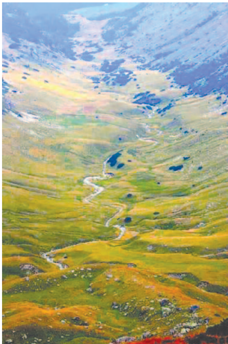
Megállítottak a patakos erdők

Vagy a túlnépesedést kell megakadályoznunk, vagy egy jobb és nagyobb bolygóra kell költöznünk. Az egyensúly nem tartható fenn a