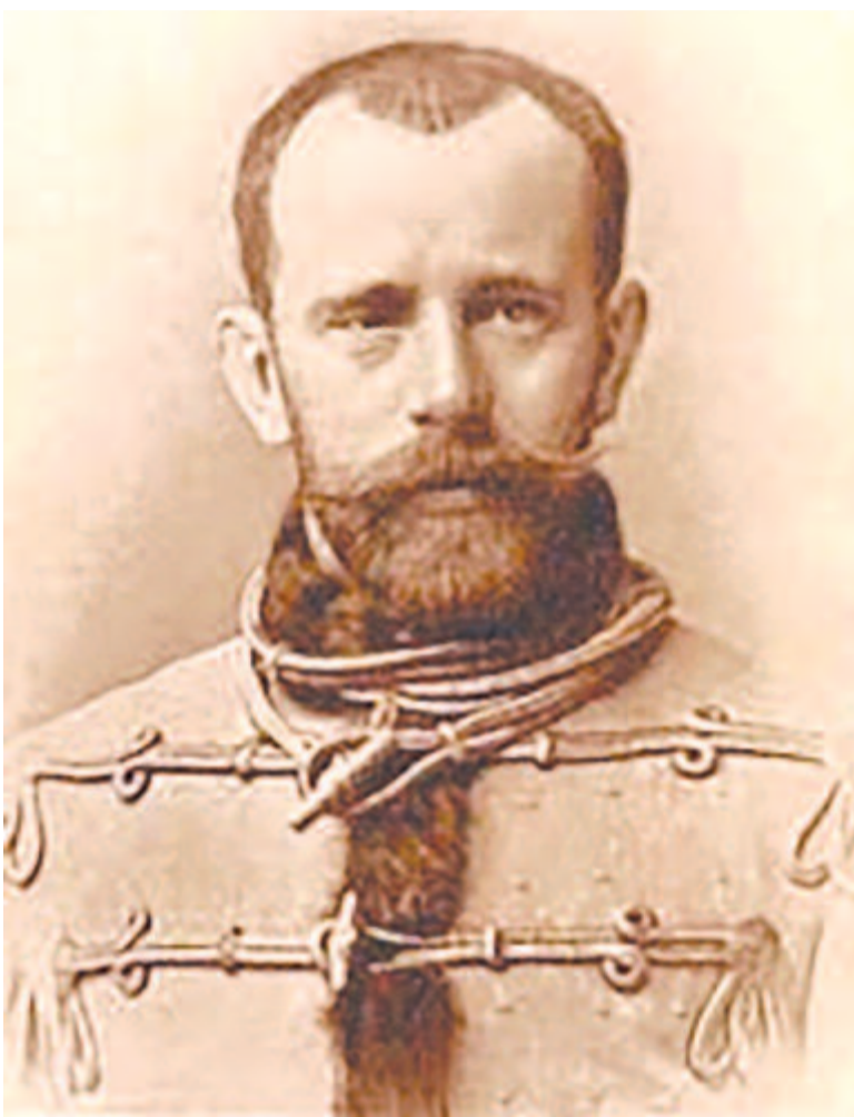
Telesi Sámuel (1845–1916) országgyűlési képviselő (1881–1916)

szolt. Többek között a következőket írta: „Nagyot vétkeztek. De bármilyen nagy legyen is a véték, nem olyan, amely nem jótáradható.” Erősd, aki a vármegyei autonómiapárt főszlopa volt, és a vármegyei fegyelmi bíróság döntését érvényesebbnek tartotta a miniszterinél, nagyobb támogatottságot élvezett. Azok, akik a belügyminisztertől várták Maros-Torda vármegye fegyelmi bírósága felmentő döntésének jóváhagyását – így ifj. Ugron főispán, Désy államtitkár és a negyvennyolcas függetlenségpárti hívek – a vármegyei közgyűlésen, szavazáskor 48 szavazattal (86/38) alulmaradtak. Erősd személyisége, nagyobb népszerűsége a közgyűlés megkezdésekor ismét érzékelhető volt a megfellebbező ellenfél számára.