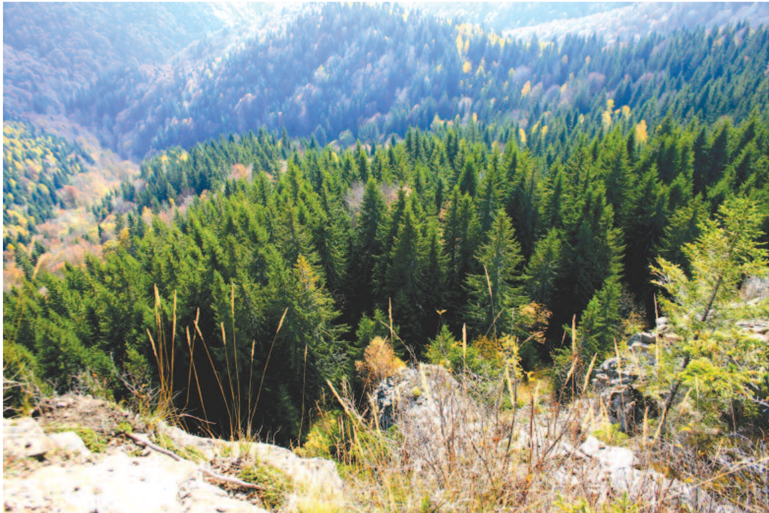
A végtelenség szomszédja ez – gyalog nekivágni

Kelt 2021. októberében, a gyaloglás nemzetközi napján