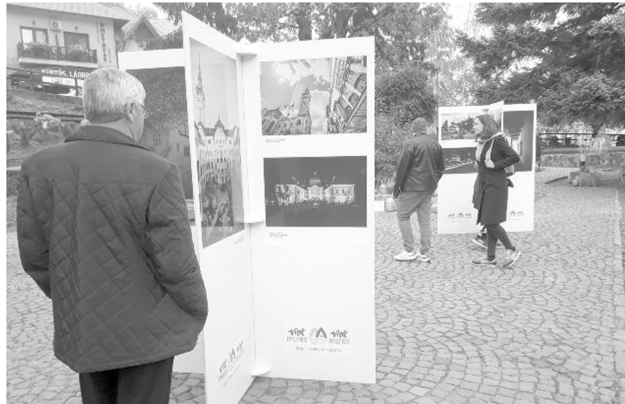
Szováta sokan megtekintették a fotókiállítást a hét végén, ezen a héten pedig a vásárhelyi várban látható