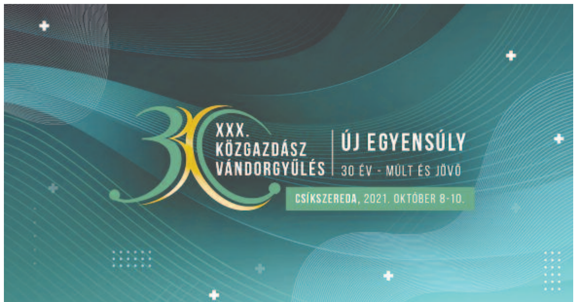
A 30. Vándorgyűlés plakátja