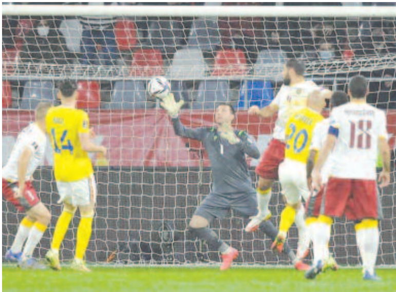
A mérkőzés egyetlen gólját Alexandru Mitriță (20) szerezte.

A J csoport harmadik mérkőzésén Izland magabiztosan győzte le Liechtensteint.