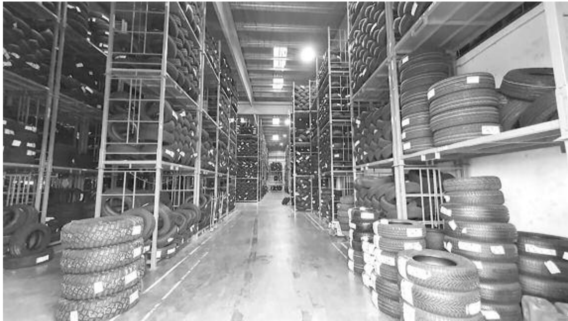
A Marsorom nagygyári lerakatában