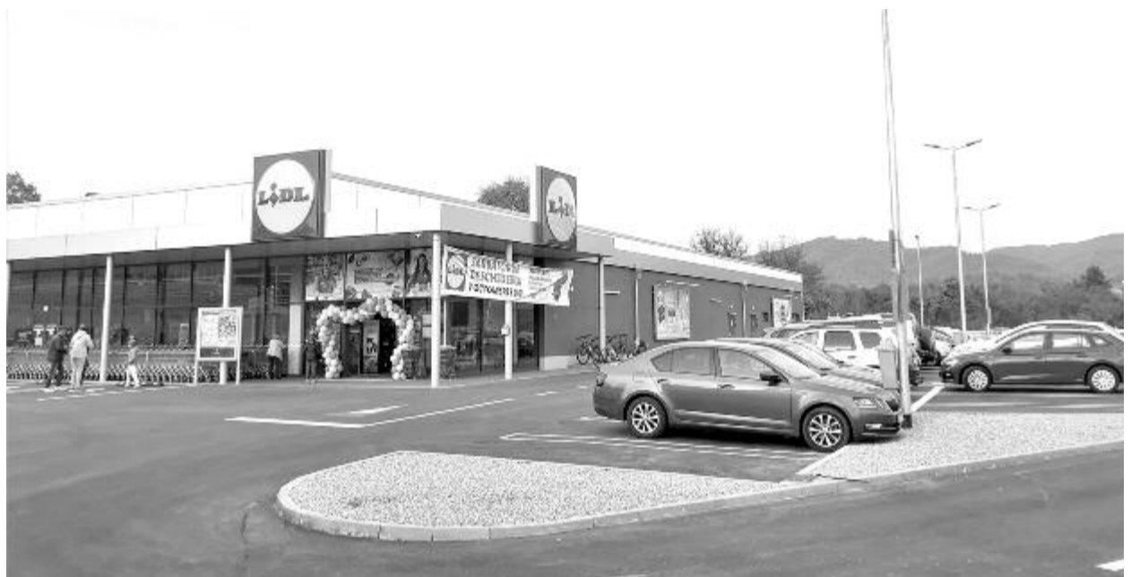
A Penny és Kaufland után a Lidl is jelen van a fürdővárosban