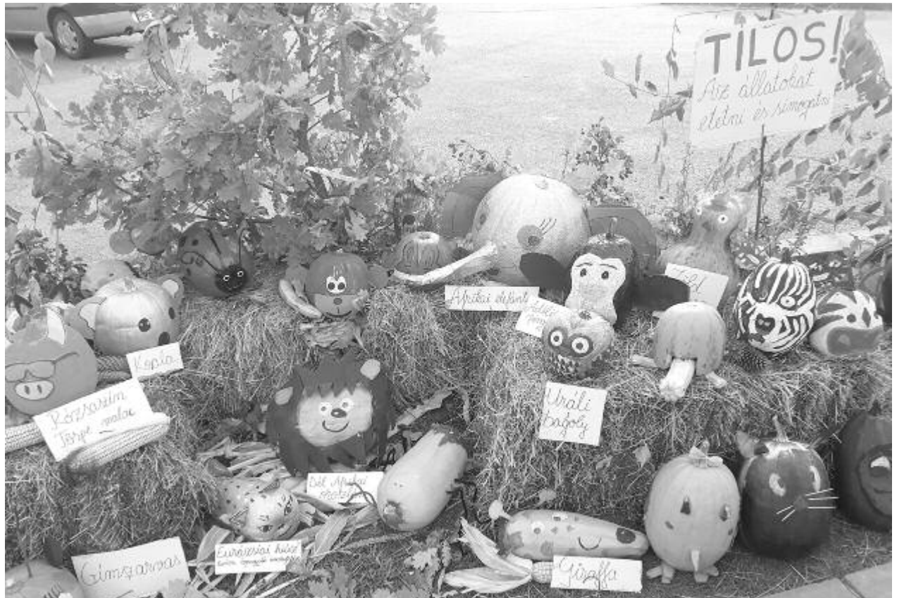
Számos érdekes tökös alkotást mutattak be, sokan tekintették meg