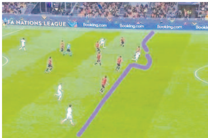
A televíziós közvetítésről kimerevített felvételen jól látható, hogy a franciák támadója volt a legközelebb a spanyol kapuhoz

A DigiSport megszólaltatta a korábbi híres játékvezetőt, Ion Crăciunescut, aki a következőképpen nyilatkozott: „A játékos minden kétséget kizáróan lesen állt, amikor kiugrott. Miközben a labda feléje tartott, az egyik védő (Eric Garcia) megpróbálta becsúszva háritani a labdát, de nem sikerült. A védő