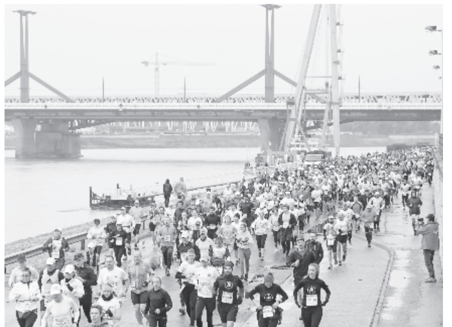
A 36. SPAR Budapest Maraton Fesztivál maraton távjának résztvevői a Henryk Slawik rakparton október 10-én

Több mint 13 ezren vettek részt a 36. Budapest Spar Maratonon, amelyen szombaton családi programokat és a rövidebb távú viadalokat rendezték meg, vasárnap pedig a 30 kilométeresek, a váltók és a maratonisták taposták a főváros utcáit.