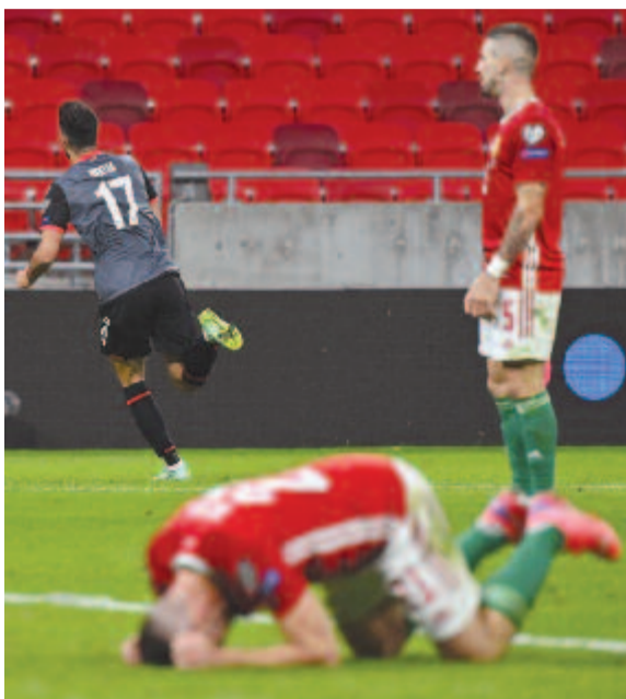
Armando Broja (b), miután gólt szerzett a Magyarország elleni világbajnoki selejtező mérkőzésen a Puskás Arénában