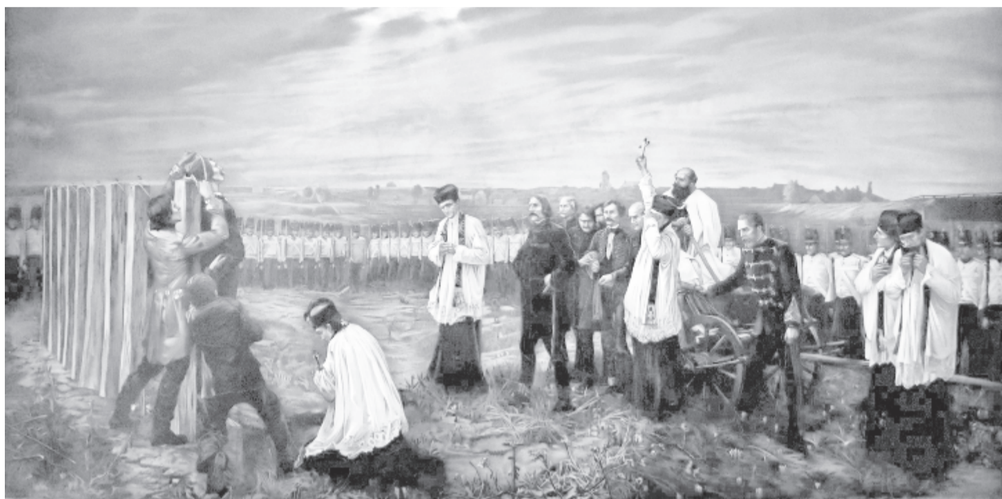
Thorma János: Aradi vértanúk

(Az ÁVH pincebörtönében, 1950. október 6-án)