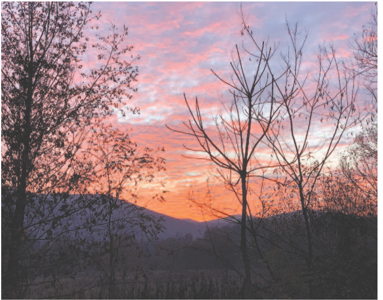
Nyarat játszik az október, az eget elárasztja sötétlila felhőivel

Az égben csatazaj: ólomgolyók görögnek, távolról morajlanak. Sötét a táj. Az eső lába lóg.