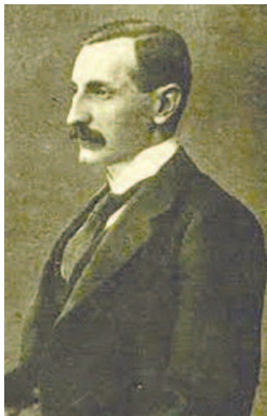
Ifj. Ugron Gábor (1880–1960) Maros-Torda vármegye főispánja (1907–1910)

amiért az egyik közgyűlési határozat köszönetet szavazott neki. (76) A marosvásárhelyi küldöttség egyik legfontosabb következménye Farkas Albert eltávolítása a főispáni székből.