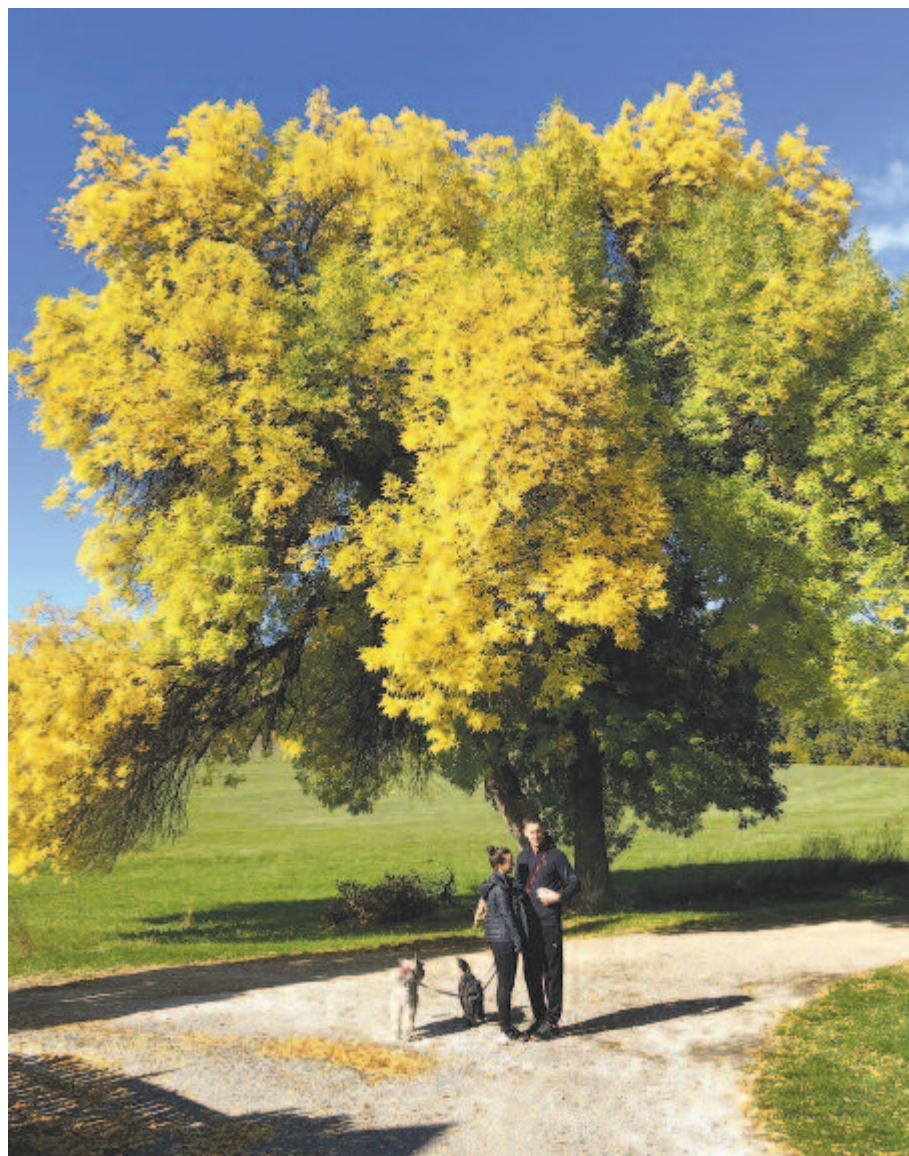
Még nemhervadó füvek szaga a léghen, de sárga lombok csillognak már a fényben