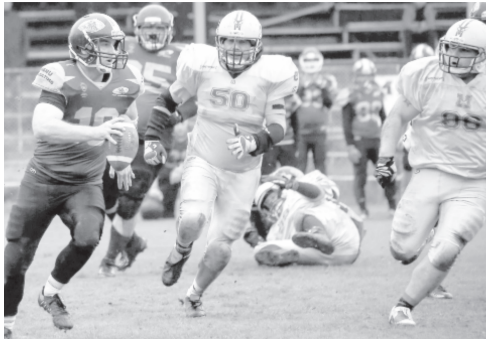
Több esetben a házigazdák futója talán a vártnál könnyebben kigyózott át a védők között a célvonal felé.

Feltűnt, hogy a találkozóon a játékvezetők nagyon sokszor ítélték a marosvásárhelyi csapat ellen különböző játékhelyzetekben, míg a házigazdák ellen lényegesen kevesebbszer. Mivel a nézők előtt ezek a hibák sokszor