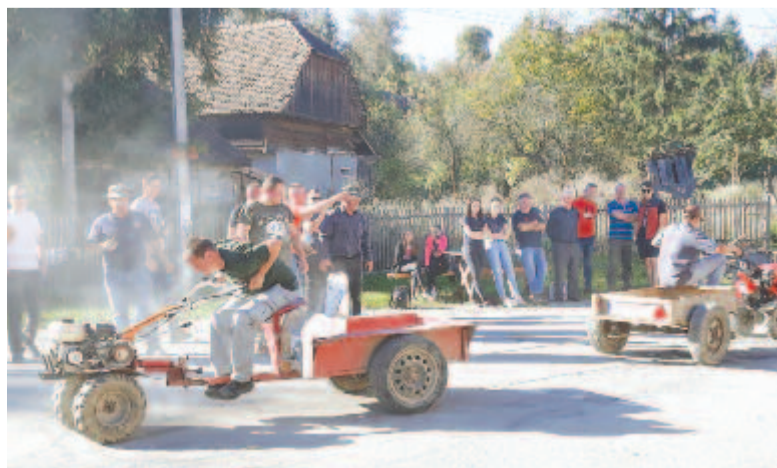
Nem mindennapi, nagy érdeklődésre számot tartó esemény volt a rotakapák versenye