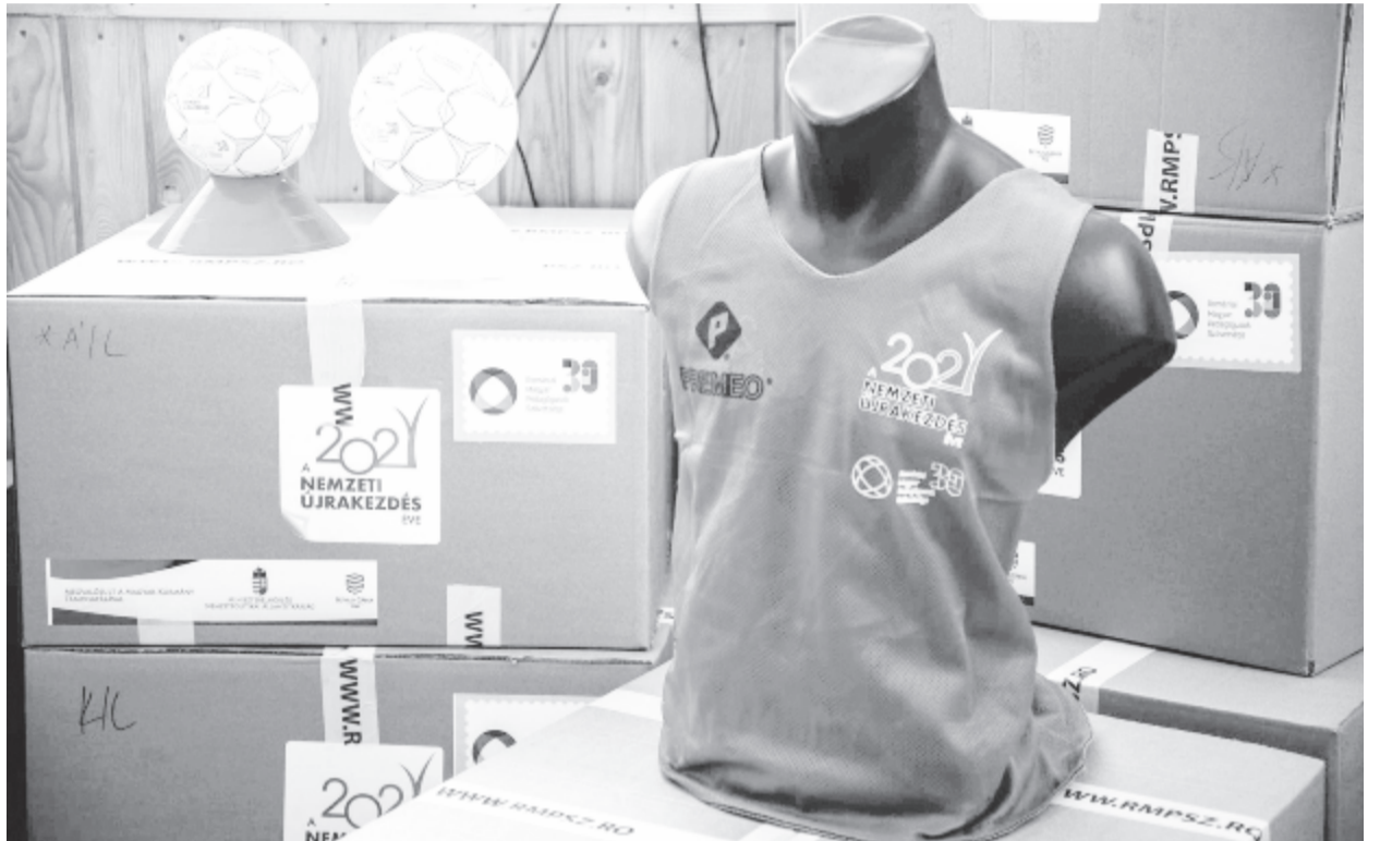
Szombaton már át is adták az első sportszercsomagokat

A küldemények kézbesítése a jövő héten is zajlik, hétfőn Szilágy és Maramaros, kedden Szatmár, szerdán Bihar, csütörtökön Arad és Temes megyék kapják meg a sportszercsomagot, jövő pénteken pedig ismét Hargita megyébe, a csíkszéki térségbe érkeznek adomány. (grl)