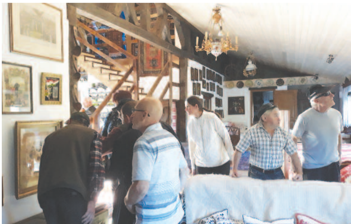
Erdély egyik legnagyobb magángyűjteményét, a Csűrümúzeumot is megtekintették a helyiek