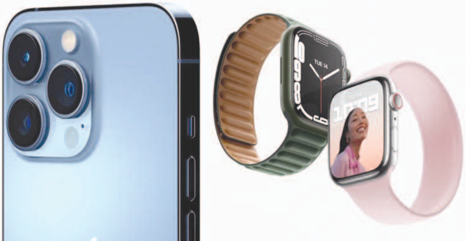
Az iPhone 13 és az Apple Watch 7.

Mindössze egyetlen kérdés maradt: hogy tudnak ennyi eszközt gyártani, miközben a világon eluralkodott a félvezetőhiány? Vajon megérkeznek időben a készülékek? Erről nem beszéltek az eseményen, így csak reménykedni lehet, hogy nem korlátozza a vállalatot annyira a hiány.