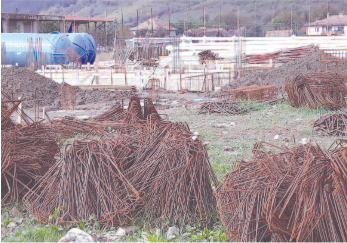
Alapozzák a sportcsarnokot