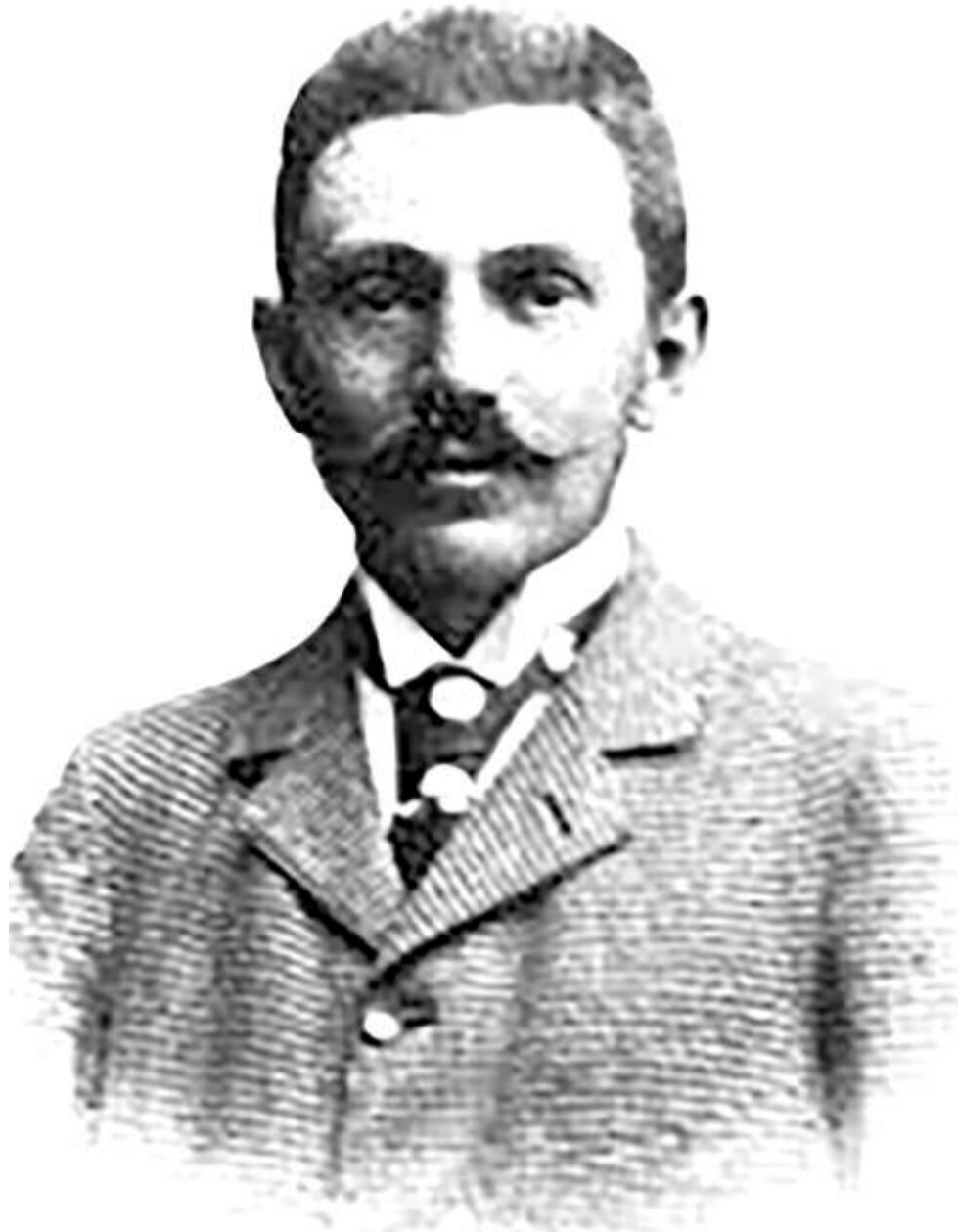
Désy Zoltán (1862–1915) országgyűlési képviselő (1910–1915)

közigazgatási „minta iskoláról” a helyi sajtó megjegyezte: „A tanfolyam jelentőségének színvonalának legjobb tükrét nyújtotta Erősd Sándor, az új igazgató szép megnyitó beszédében, s bizonyára mindenki készséggel elismeri az abban hangoztatott elveknek igazságát.” (27) A tanfolyam záróvizsgáit június végén tartották. Két vizsgáztató bizottság alakult a tanárok, valamint a minisztérium által kinevezett kültagok részvételével. Egyik elnöke a főispán, a másiké Erősd Sándor volt. (28) Meg kell jegyeznünk, hogy a Székelység című napilap többször is ellenzéki magatartást tanúsított az Erősd által irányított közigazgatási tisztikar és az általa vezetett tanfolyam ellen. (29) Az 1905–1906-os tanév 52 tanulót számlált, akik között szászok és románok is voltak. (30)