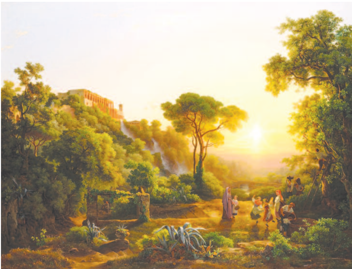
Id. Markó Károly: Tájkép Tivoli mellett, 1846

Kelt 2021-ben, Szent Gellért napján, mikor a Nap a mérleg havába lépett