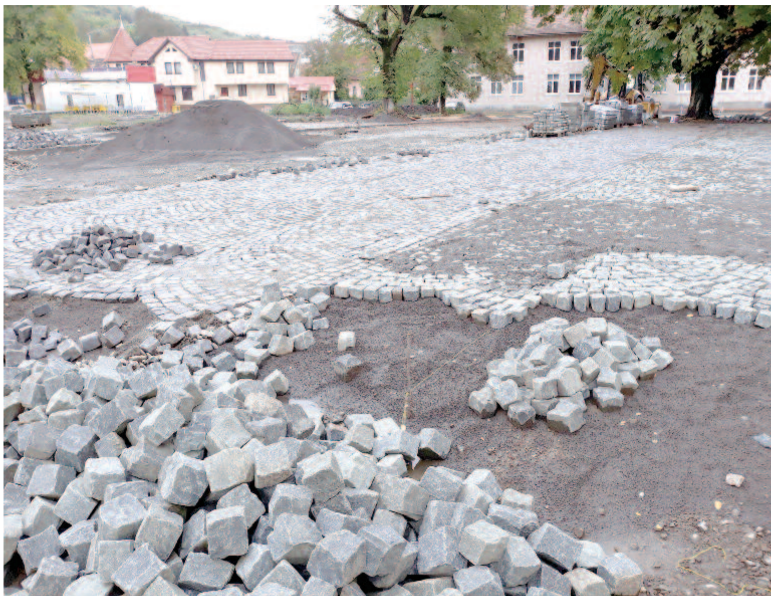
A főtéri park is megújul