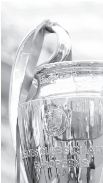
Vajon milyen színű pántlikákat kötnek majd a serlegre a jövő tavaszi döntő után? – teszik fel a kérdést a sorozat közösségi oldalán közölt felvételt kapcsán.

A Barcelona 26. alkalommal szerepel BL-ben – ami közös rekord a Real Madriddal –, a korábbi 25 nyitómeccse közül csak