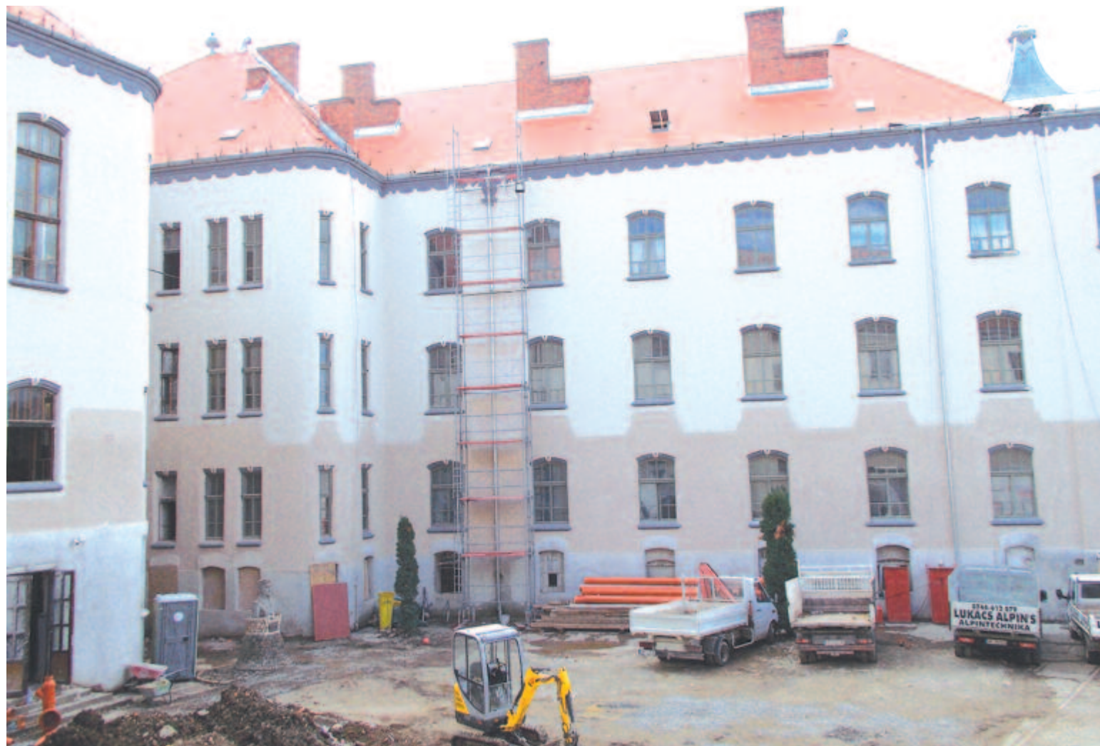
Kívül-belül megszépült az iskola Bolyai utcai szárnya