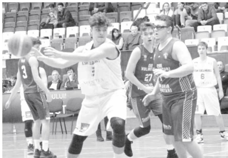
A marosvásárhelyi kosárlabdacsapat vagy feljut a következő idényben, és a leendő zárt ligában játszik majd, vagy örökre elbúcsúzhatunk attól, hogy a városnak ismét élvonalbeli együttese legyen

Vagyis, ha nagyon sarkítani akarunk, a marosvásárhelyi férfi-kosárlabdacsapat vagy feljut a következő idényben, és a leendő zárt ligában játszik majd, vagy örökre elbúcsúzhatunk attól, hogy a városnak ismét élvonalbeli együttese legyen. Persze az ügy ennél bonyolultabb, de a szövetség ezzel gyakorlatilag ellehetleníti az amúgy is alig működő alacsonyabb szintű bajnokságokban szereplő csapatok helyzetét. Ez pedig aligha lehet a cél.