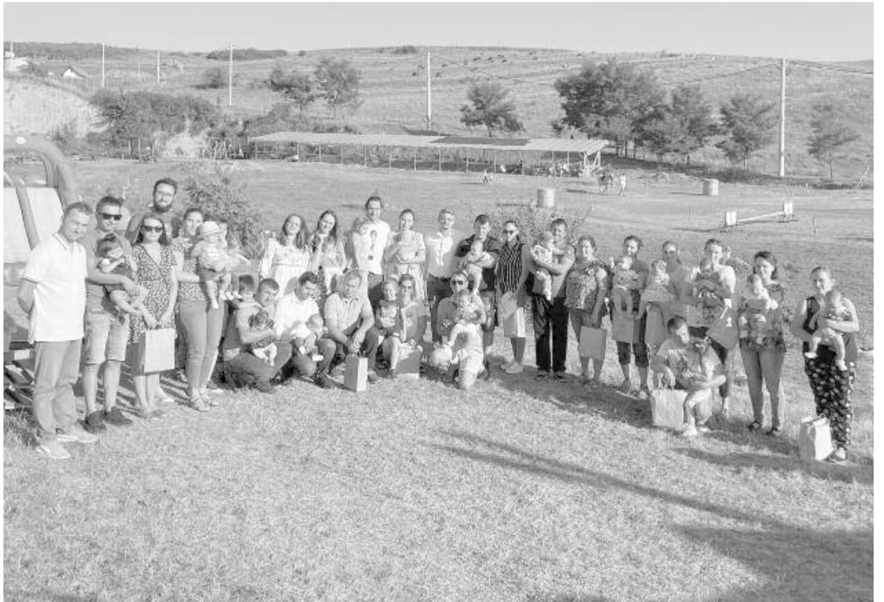
Idén ötödik alkalommal tartottak családi pikniket