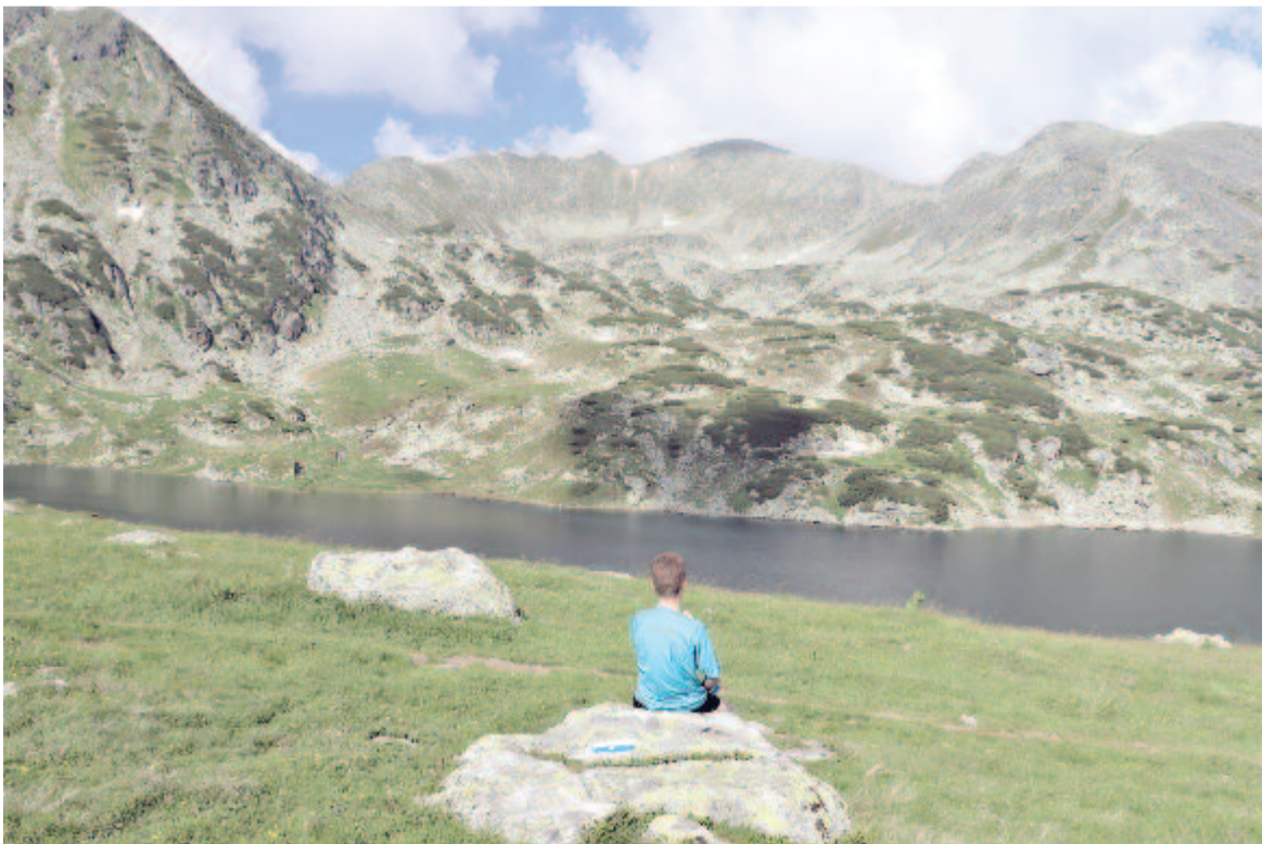
Bucura-tó és Peleaga-csúcs

– Látod, fiam, ezt most majdnem megjártuk, de a lényeg az, hogy nem adtuk fel. A szivárvány emlékeztessen téged Noéra, és ne téveszd össze azzal a hatszínű zászlóval, ami alá ma olyan sokan felsorakoznak embervédőnek, főleg olyanok, akik az igazán jelentős ki-sebbségek érdekében semmit sem tesznek. Te abban higgy, hogy a rosszat jó követi, ahogy a Retyezáton, úgy az életben!