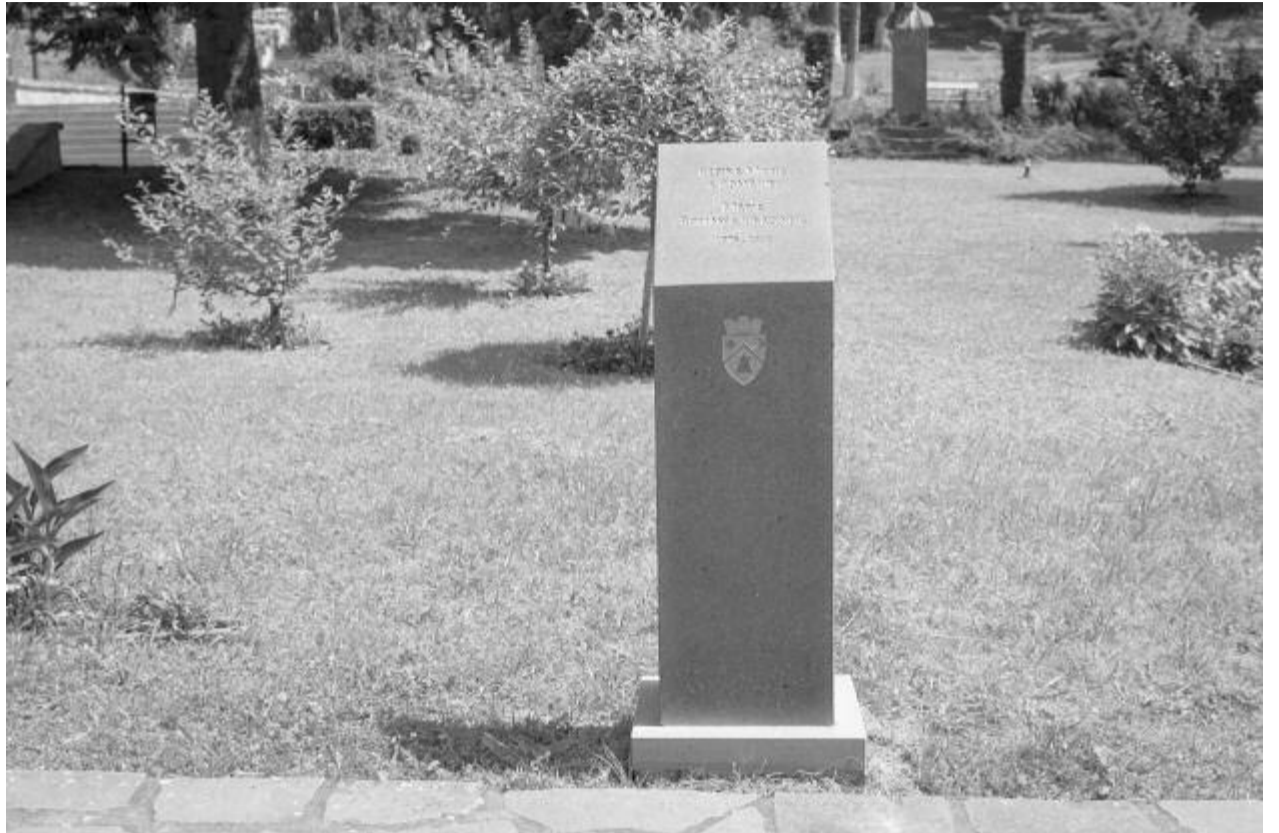
Három emlékkövet állítottak fel a fürdőtelepen