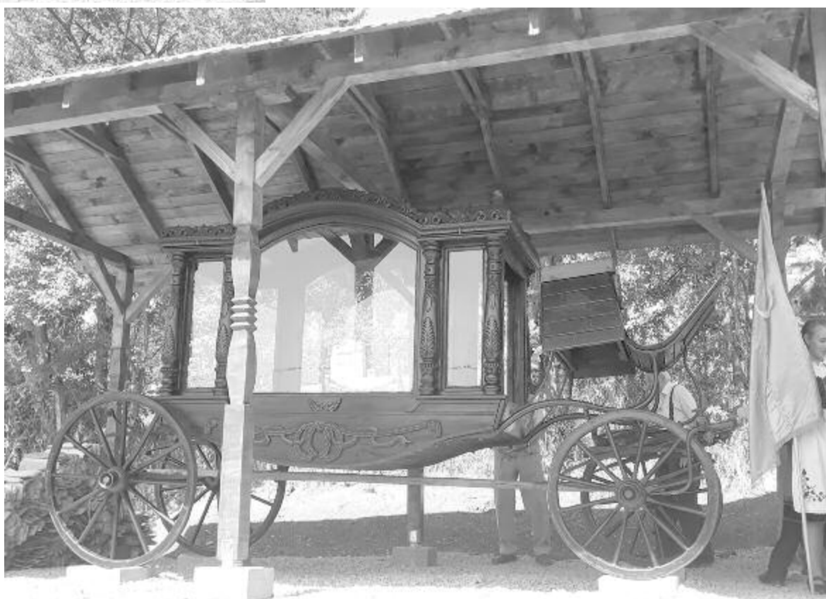
A patinás halottaskocsi is méltó helyre került

A székely kapu felállításának ötlete már korábban megszületett, az új lelkész felkarolta, és mellé állt az egész gyülekezet. Sok apró csoda tette lehetővé, hogy ilyen rövid idő alatt elkészült; kezdetben kétséges volt, hogy összegyűl a szükséges 15 ezer lej, de mára 17.085 lej jött össze gyülekezeti adományokból, aztán a faanyag hiányzott, de az is került, s amikor már a halottaskocsi színje is állt, egész Székelyföldön nem találtak rá zsinelyt. Akkor a közeli Székelymosonból érkezett segítség egy román férfitől.