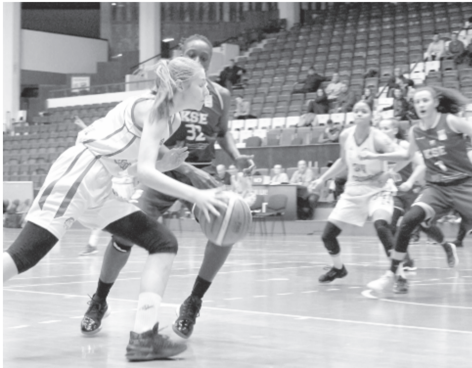
A női kosárlabda az egyik visszatérő

A mentalitásbeli hiányosságok a női foci esetében is nyilvánvalóak, hiszen a Ladies marosvásárhelyi bejegyzett székhellyel jutott az 1. ligába, ám székelyudvarhelyi háttérrel. A városi sportklub pedig sietett felszámolni a saját csapatát, ha már egy várost képviselő privát klub ott van az élvonalban. A Ladies persze Marosvásárhely névvel szerepel majd, de mindaddig, amíg a legjobbjaira a Székelyudvarhelyi Vasas Femina, a patrónus klub