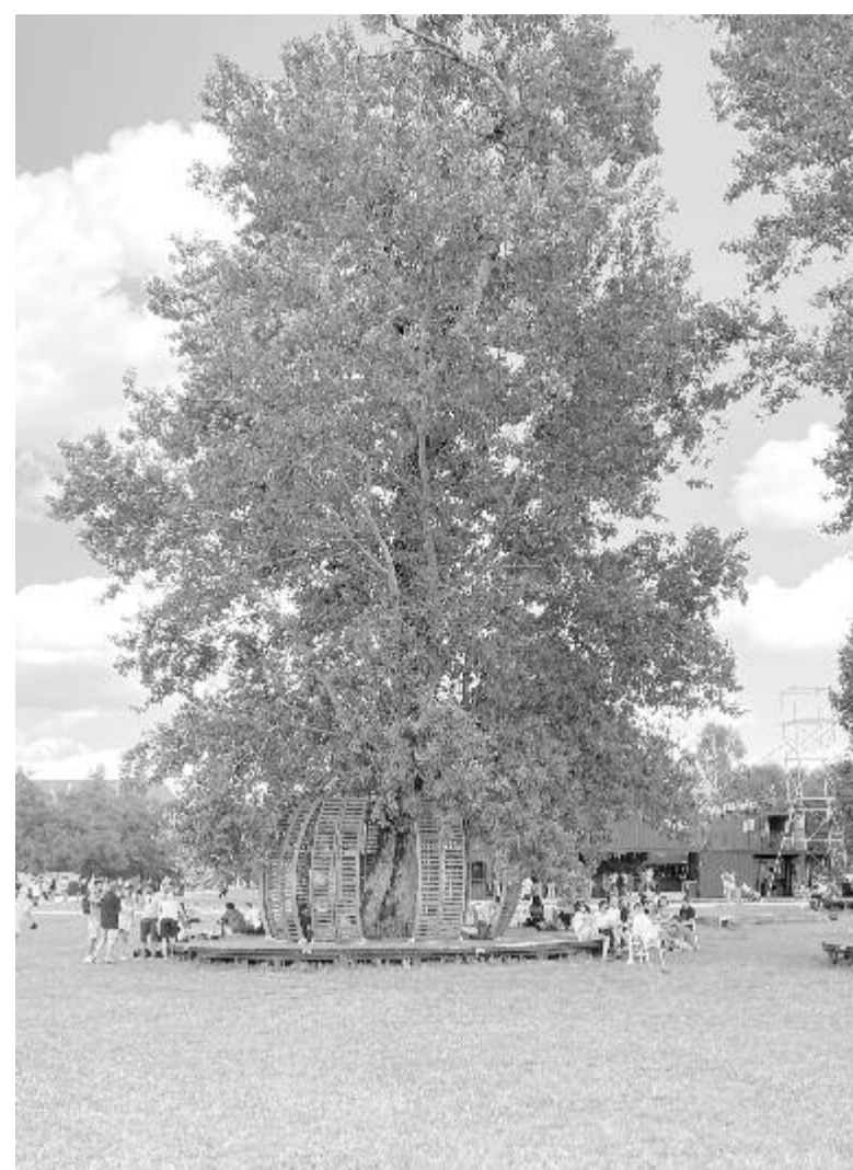
Pihenőhely a fák árnyékában

léggör, ahol mindenki szívesen és önzetlenül segít a másoknak, nem neveti ki, hanem mellé áll – ismeretlenül is –, amikor baj van. Velem esett meg 2015-ben, amikor először vettem részt a fesztiválon. Abban az évben óriási esők voltak