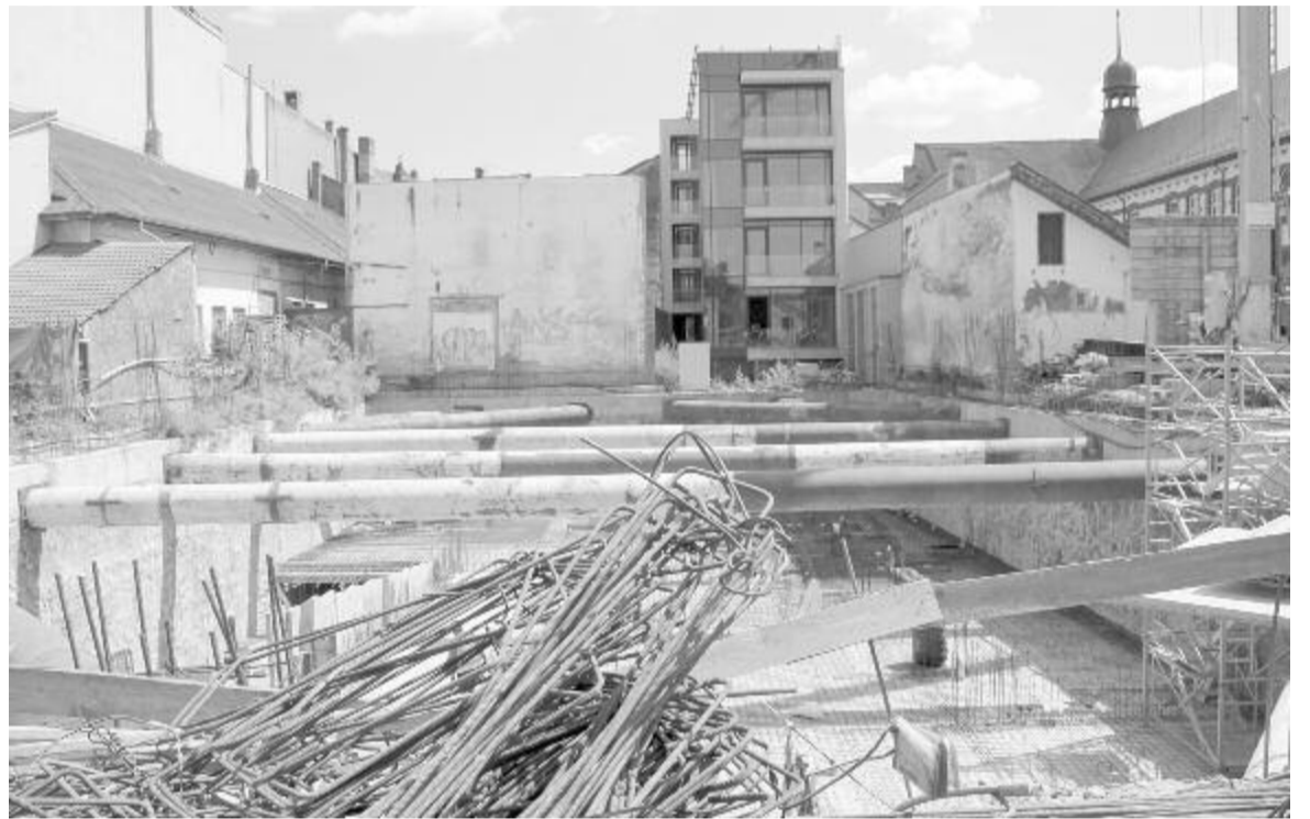
Építkezés a Nyomda utcában