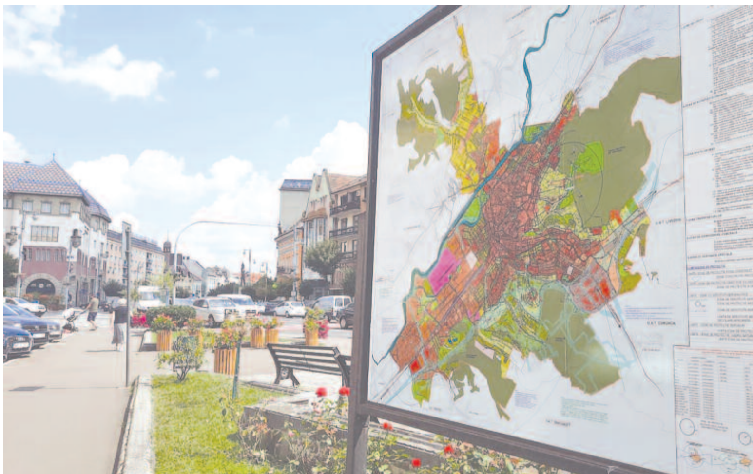
A városrendezési terv