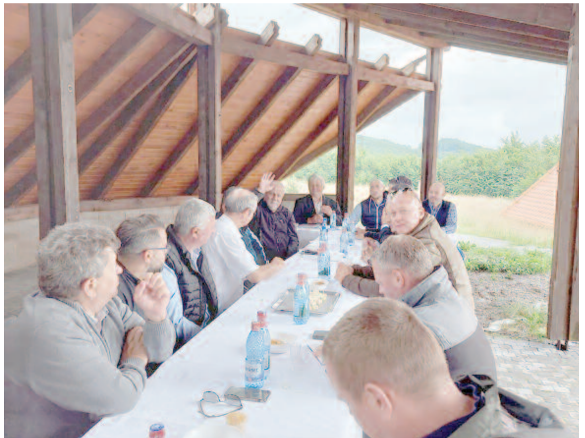
Múlt héten döntött a közgyűlés a bónuszösszeg elosztásáról

zelték, és két-három, még megvalósítás alatt álló projekt kivételével le is zárták őket, így országos szinten nem állnak rosszul, ugyancsak a rangsor első harmadában vannak. Évről évre próbálnak javítani a teljesítménymutatókon, s ez a legutóbbi ülésen is szóba került, hiszen ha jól teljesítenek, esetleges további bónuszkeretek leosztásakor további fejlesztési pénzekhez juthatnak, ezért folyamatosan szem előtt tartják azt, hogy minél több és minél jobb pályázat érkezzen az egyesület által meghirdetett kiírásokra.