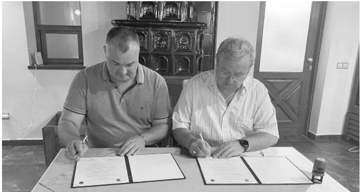
Múlt pénteken írt alá testvértelepülési szerződést a két község vezetője