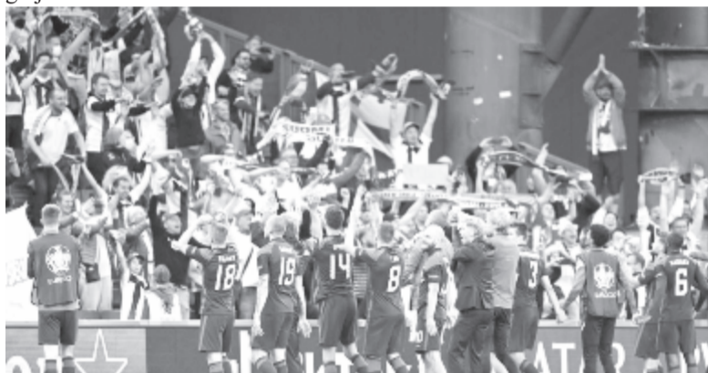
Finn foci-rajongók az Eb-n – Pannon RTV