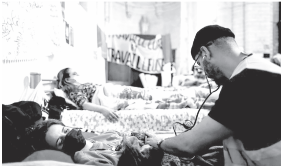
Éhségstrájkoló migránsok egy brüsszeli templomban