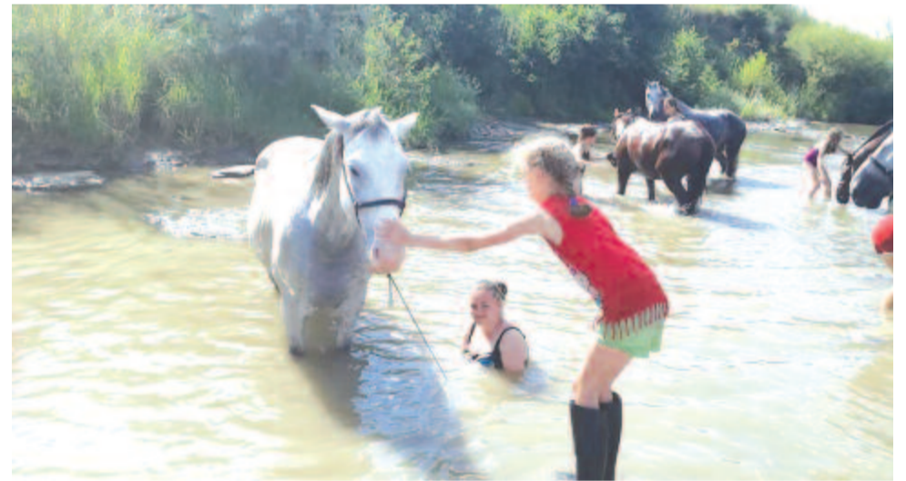
Art Equest Lovasiskola