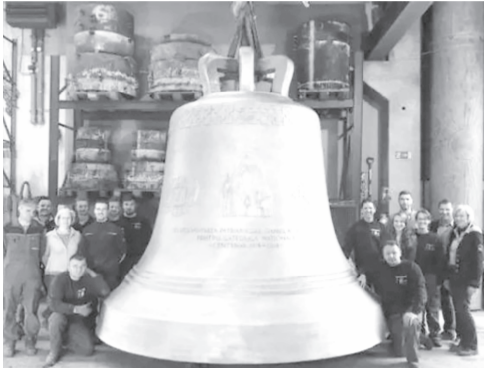
Érdekesség: „A nagyharang egész pontosan 252 mázsát nyom, magassága 3,3 méter, átmérője pedig 3,35 méter. Ezekkel a méretekkel a bukaresti nagyharang lett Európa legnagyobb harangja. 25 európai szakértő vett részt az öntésben. A harang rézből és ónból készült, és három héttig hűlt az öntés után.” (Fötér, 2017. – https://foter.ro/cikk/20170405_na_kie_a_legnagyobb_harang/ )

1960-ban acélmiseséjét tartotta. Ekkor már érezhető volt, hogy meggyengült élete harangjának a húzója. Még két évig szólt lelke harangja, egyre halkabban, míg végül 1962. február 1-jén utolsót kondult ez a harang. 95. évében az ország legidősebb papjaként távozott. Szelleme azonban tovább él minden harangban, amely az általa megalapozott tudás szerint készült.