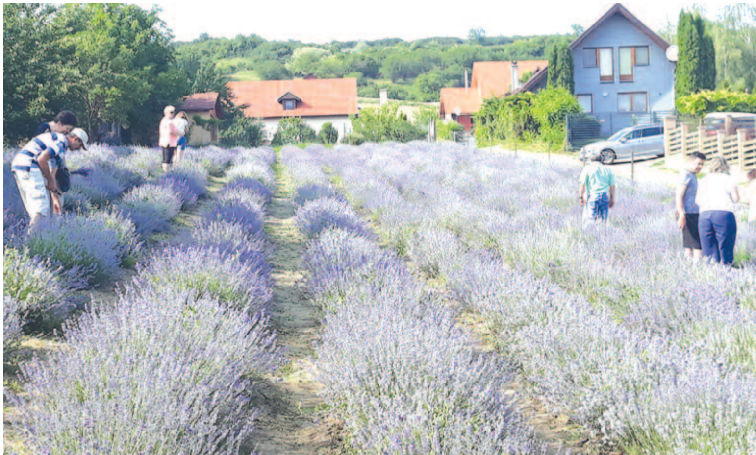
A levendulagyűjtés mindig kellemes élmény – erre várnak mindenkit a hét végén Kenden és Szentbenedeken