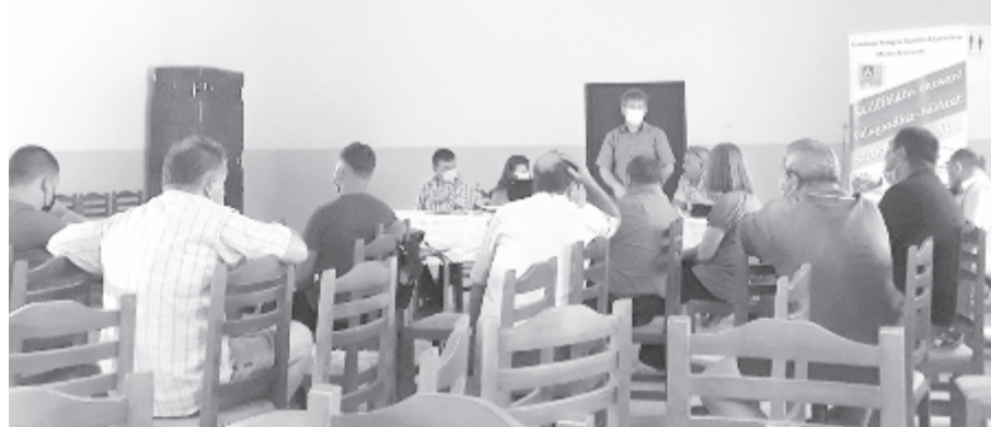
Hat vidéki találkozó lesz

Az RMGE Maros hat térségi találkozón szeretné lefedni a megye magyarok területét, a következő egy-másfél hónapos időszakban Gernyeszegen, Héderfán, Mezőbándon, Erdőszentgyörgyön tartanak tájékoztatót, míg a Marosvásárhely közeli községek gazdáit valószínűleg a megyeközpontban levő székházban informálják. A cél, hogy a gazdák lakhelyéhez minél közelebb mutassák be a lehetőséget, nem egyetlen ponton, ahol sok ember lesz egy helyen. Kimennek vidére olyan gazdákkal találkozni, akik komolyan gondolják, hogy beruháznának a gazdaságukba, és akik első kézből ismerhetik meg a feltételeket és a lehetőségeket. A körutat a megyei AFIR is a lehető legnagyobb jóindulattal és odaadással támogatja, ennél hatékonyabban már nem is tudnák eljuttatni az információkat a célcsoportokhoz.