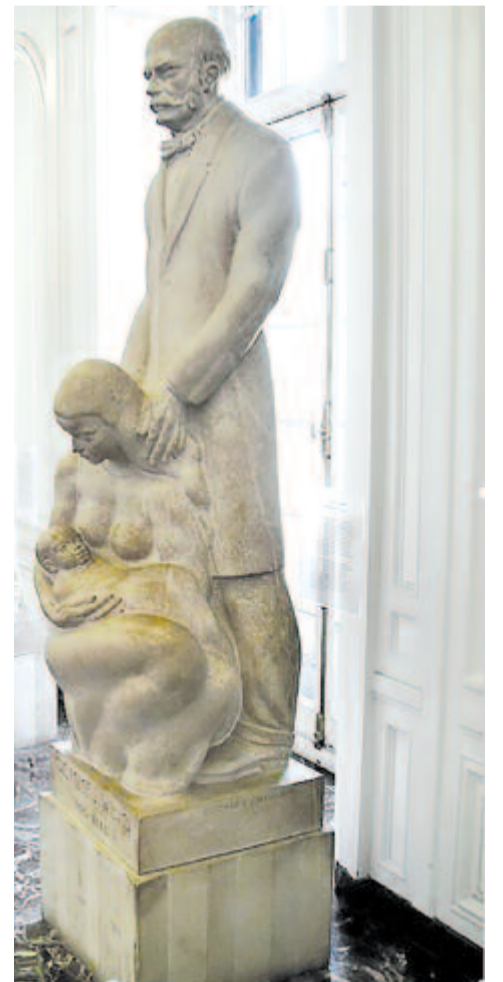
Semmelweis szobra a Halhatatlanok Csarnokában, a Chicagói Nemzetközi Sebészettudományi Múzeumban

Hamvait felesége 1891-ben Budapestre hozatta családjának sírboltjába. 1965-ben új sírba helyezték szülőházának udvarában, mely jelenleg a Semmelweis Orvostörténeti Múzeumnak ad helyet. A Semmelweis Egyetem 1969-ben, hosszú folyamat eredményeként vette fel egykori tanárának, Semmelweis Ignácnak a nevét.