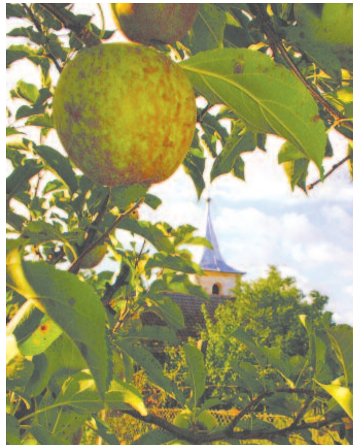
Almát érlelő áldott nyári délután Abosfalván

Az Oroszlán havába lépve, Aldott nyári délután próbáljuk meg átérezni a lét végtelen rövidegét, mint tette azt Tóth Árpád 1925-ben keltezett versében: