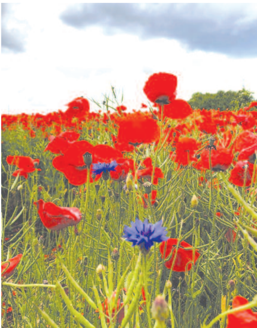
Kigyúl, mint egy piros szív, a pipacs virága

Maradok kiváló tisztelettel. Kelt 2021-ben, 76 évvel az első kísérleti atombombarobbanás után