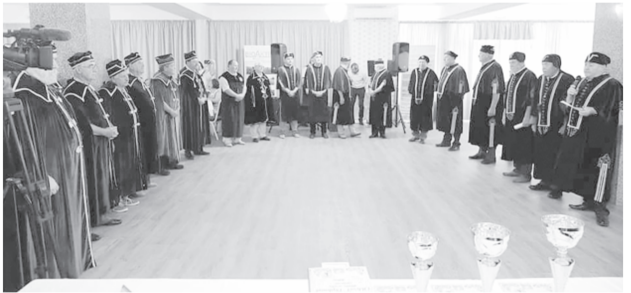
Két hazai és két anyaországi borrend lovagjai is felvonultak a díjkiosztón