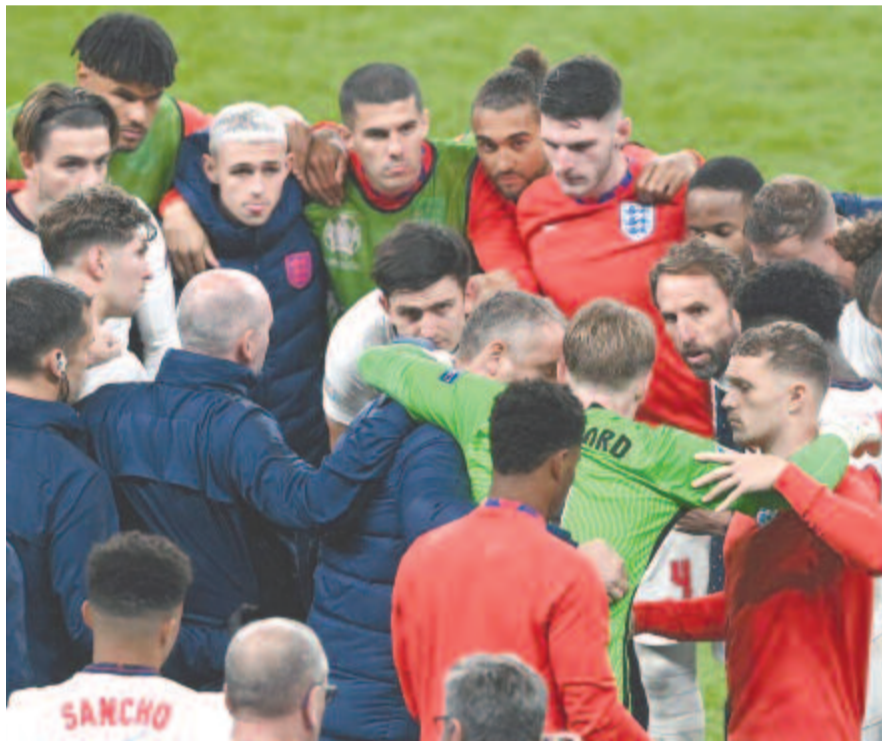
Kupaktanács az angoloknál a tizenegyespárbaj előtt: a csapat szövetségi kapitánya (középső sor, j2) mintha Pickfordtól várna ötletet

Amúgy az angolok csak önmagukat hibáztathatják, hogy ide jutottak, mert a korai vezető találatuk után túl könnyen engedték át az olaszoknak a terepet, a kelletnél jobban bíztak abban a védelemben, amely korábban csak egy gólt kapott a torna során. Ami pedig az olaszokat illeti, úgy nyerték meg az Eb-t, mint még soha. Végig támadó szelleműben, látványosan, egyáltalán nem „olaszosan” futballozva, négy győzelemmel a rendes játékidőben, eggyel hosszabbításban, kettővel pedig büntetőekkel. S valamennyi nyilatkozatukban a kiváló csapatszellemet emelték siker titkáként.