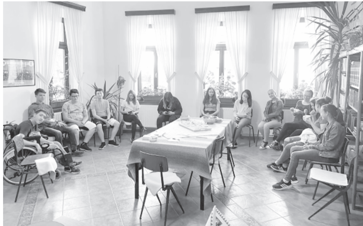
Sikertörténet az idei ifimunka – szeptembertől folytatják

vagyunk képesek együtt – és mindent a gyakorlatban is leterestelték. A sikertörténetként elkönnyelhető sorozat egy hete zárult szeretetvendégséggel, Balde Ernő felajánlásából. A munka azonban csak iskolakezdésig szünetel, hiszen a nyár a táborozások időszaka (is) lesz. Augusztus második felében ifitábor szerveznek, ugyanabban az időszakban kerül sor a nagyobbak vallásórás csoportja és a konfirmandusok táborára is. Ezekre Gegesben foglaltak le helyet: közel is van, ismerős a helyszín, és kedvező áron használhatják. Jövőre viszont már egy nagyobb külföldi tábor gondolata is megfogalmazódott, egyik céljuk eljutni a Pál apostol által is bejárt görögországi helyszínekre, Athénba, Thesszalonikiba. Ebben már van gyakorlatuk, kétszer is bejárták azokat a tájakat, és ez nemcsak kirándulás lesz, hanem bibliaismereti szempontból is hasznos tanulmányút.