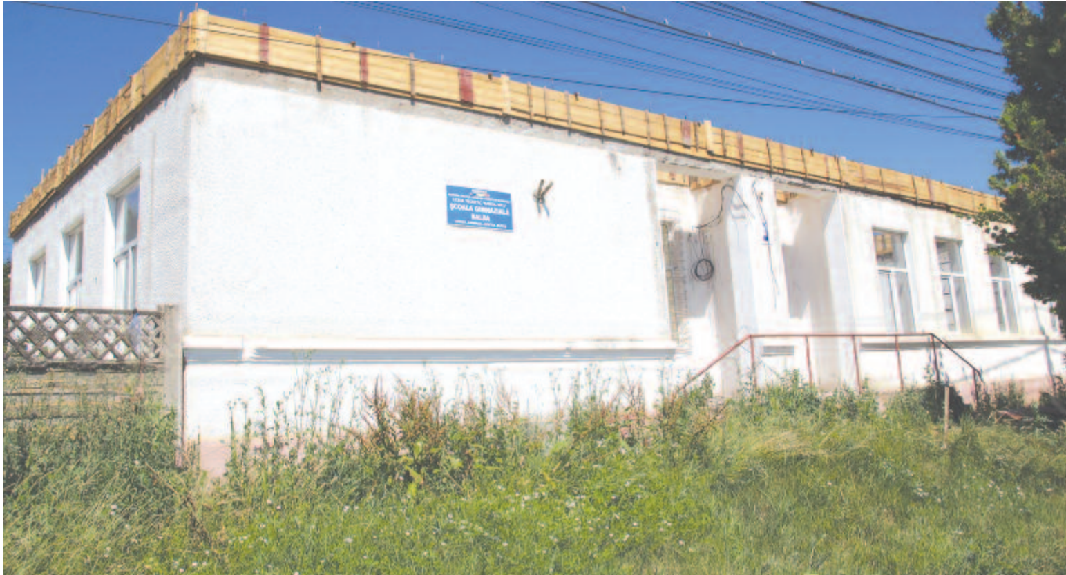
A báldi általános iskola. Nagysármási vendégoldalunk a 6. oldalon.