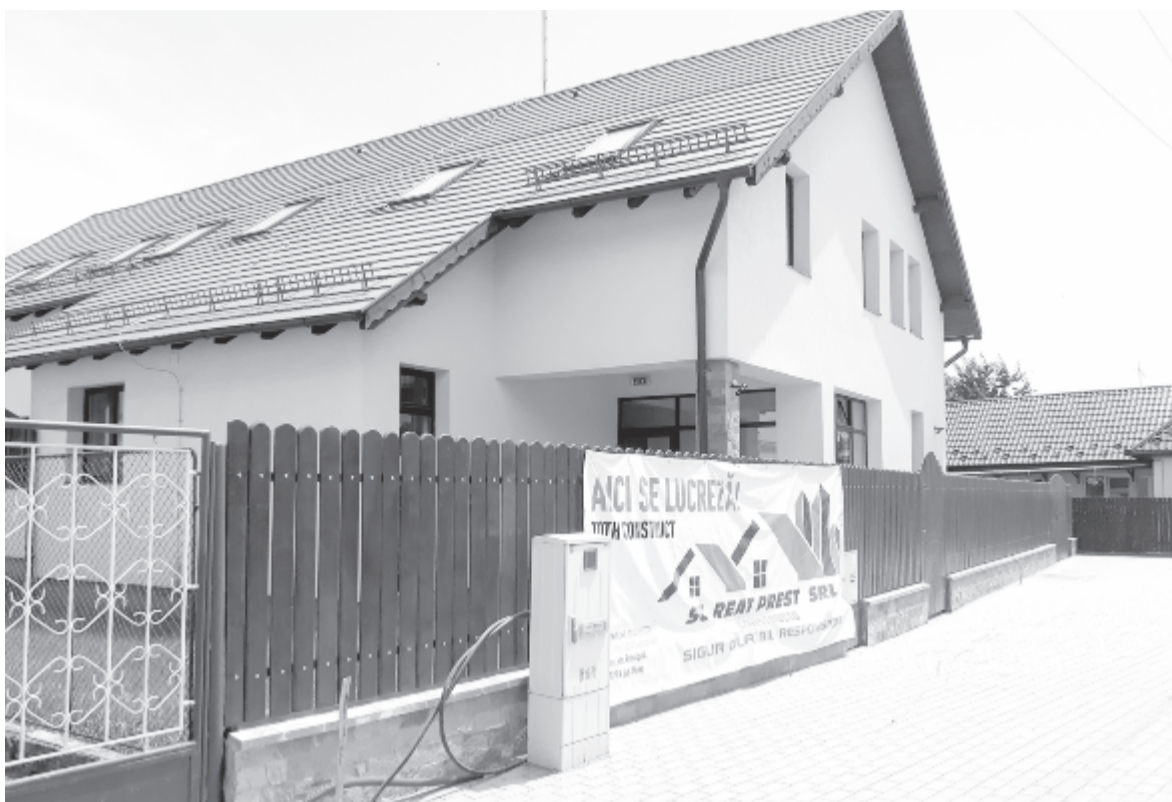
A bölcsőde már az önkormányzat kezében van, a tervek szerint szeptemberben avatják fel