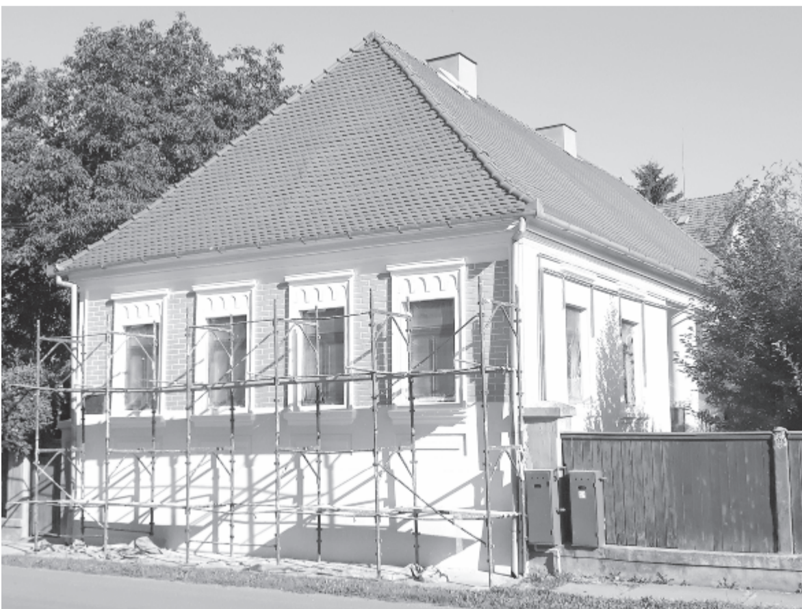
Szakszerűen felújítják az 1876-ban épült parókiaát

A tervek szerint szeptemberben a gyülekezetet látogat a püspök, de nem(csak) ezért folyik a munka. És nem(csak) ezek megtekintésére érkezik az Erdélyi Református Egyházkerület vezetője, hanem szeptember 13-án többek között itt is sor kerülne az egyház és a magyar kormány együttműködése révén megépült bölcsőde avatására. Az épületet nemrég az egyházközség átvette a kivitelezőtől, és átadta az önkormányzatnak használatra, az pedig igyekszik minden engedélyt beszerezni a tanévkezdésig.