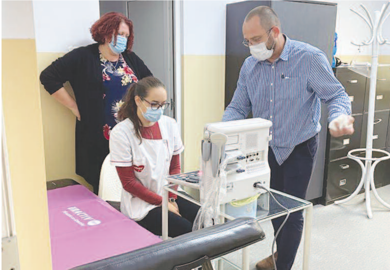
Nemrég adta át az új echográfot a kórháznak az önkormányzat