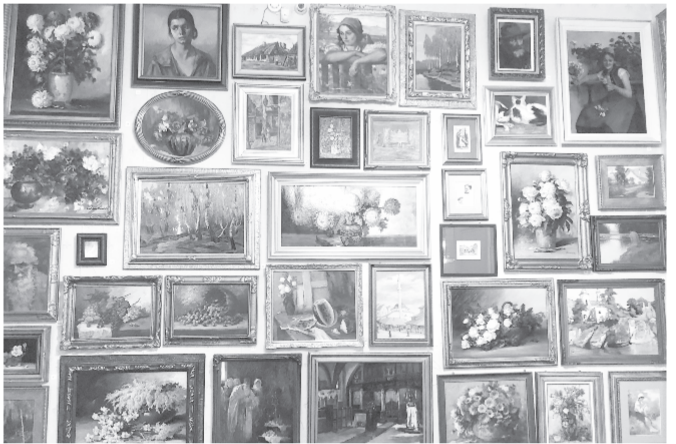
Egy eddig ismeretlen kollektiót bocsátanak árverésre (5. oldal)

75 éve, 1946. augusztus 3-án született Budapesten a költő, képzőművész, performer, univerzális alkotó, akinek a nevéhez kötődik a magyarországi performansz művészet megteremtése. Elhunyt 33 éves korában, 1980. július 27-én.