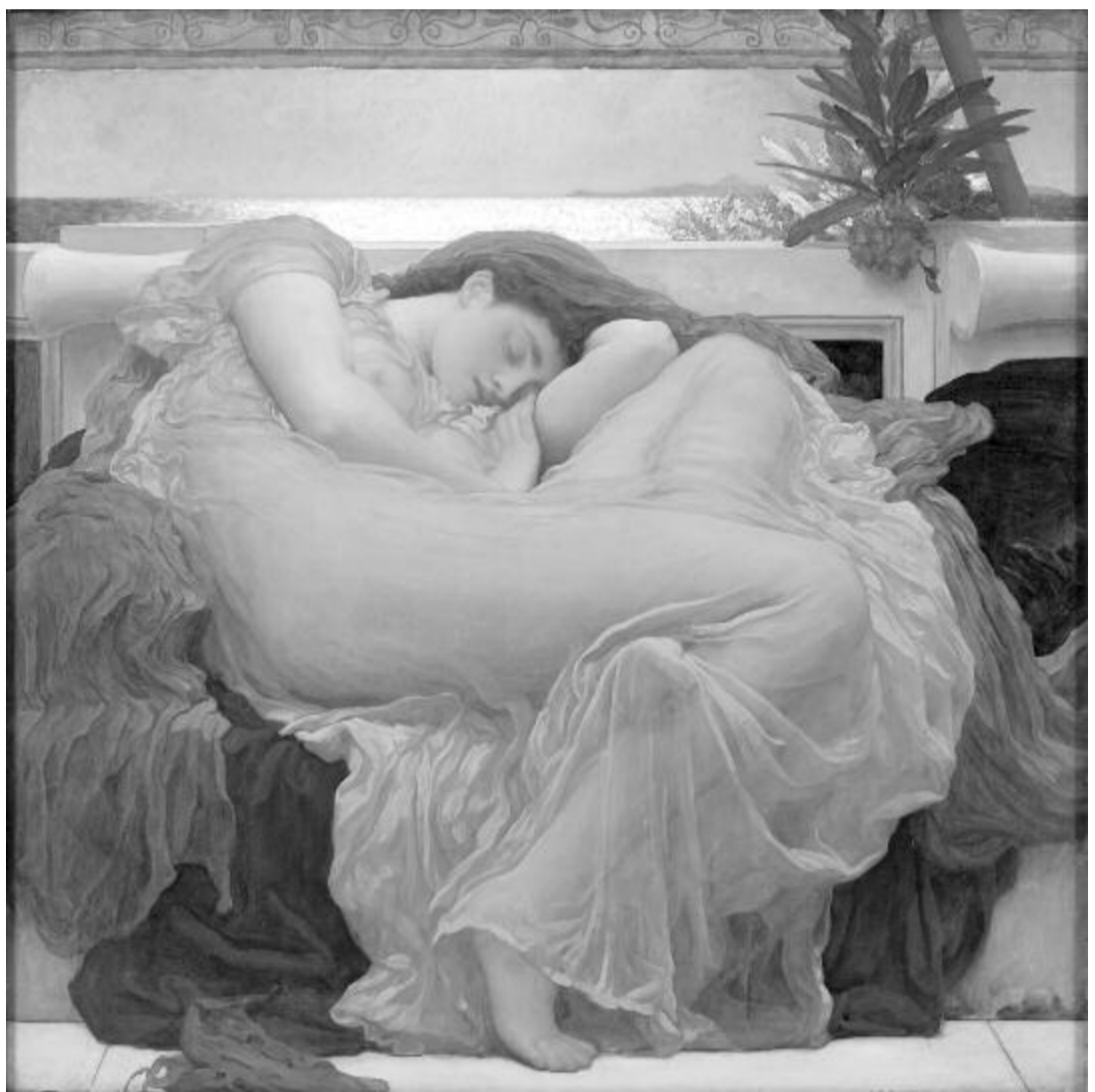
Lord Frederic Leighton (1830-1896) – Lángoló június

141 évvel ezelőtt, 1880. június 10-én született Nagykárolyban Kaffka Margit, a „nagyon-nagy író-asszony” (Ady Endre), a magyar irodalom egyik legjelentősebb női írója. Az I. világháború után, 38 éves korában, 1918. december elsején kisfiával együtt a spanyolnátha áldozatává vált. December 4-én a Farkasréti temetőben helyezték őket örök nyugalomra.