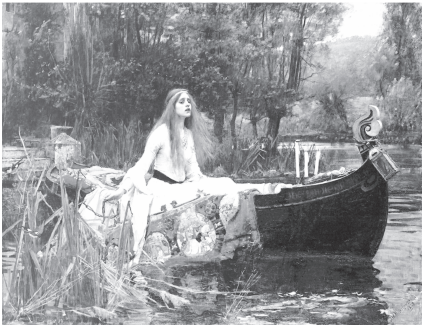
John William Waterhouse: A shalotti lány, 1888