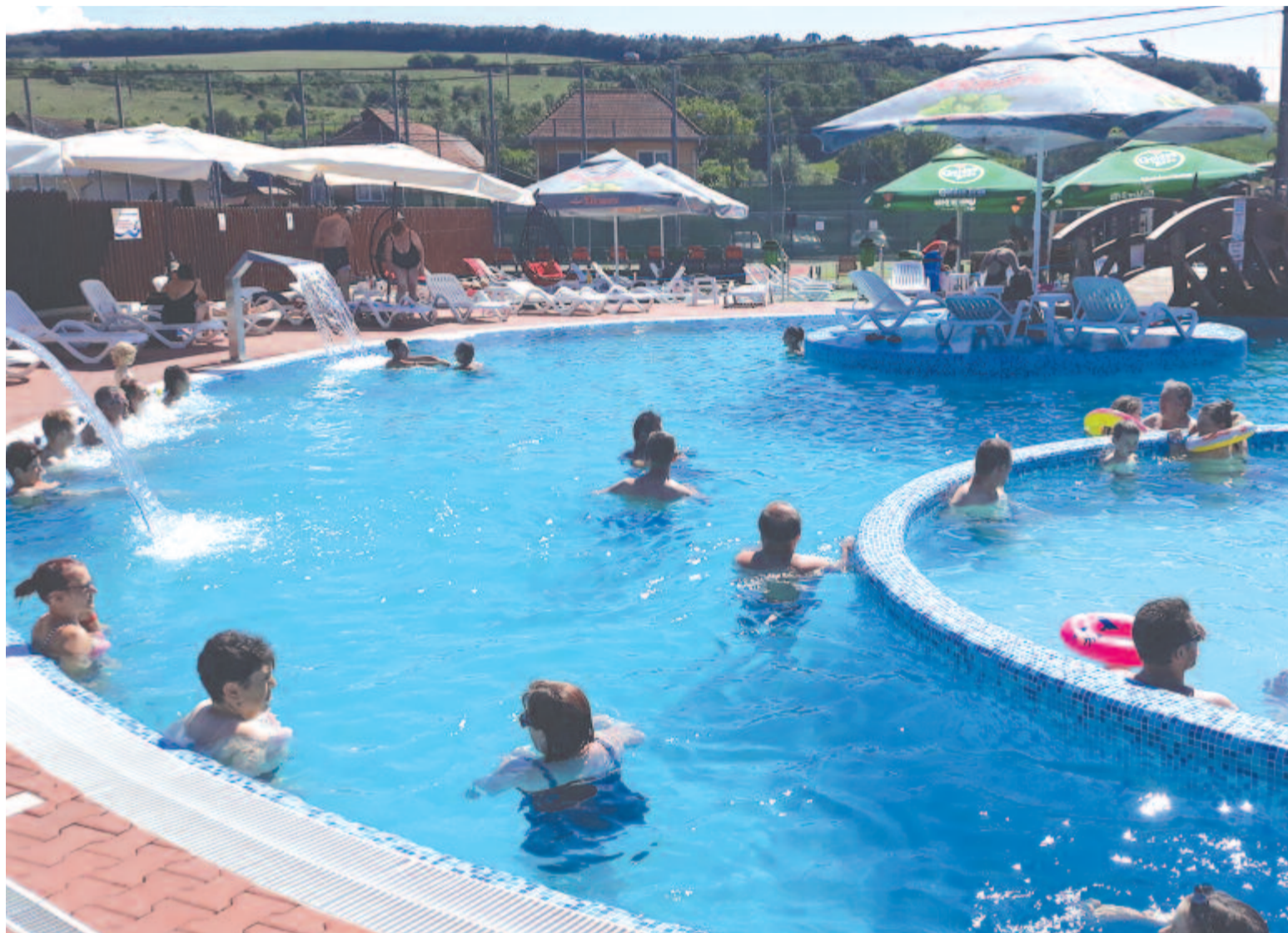
A gyerekek is, felnőttek is kedvelik a harasztkeréki strand vizét