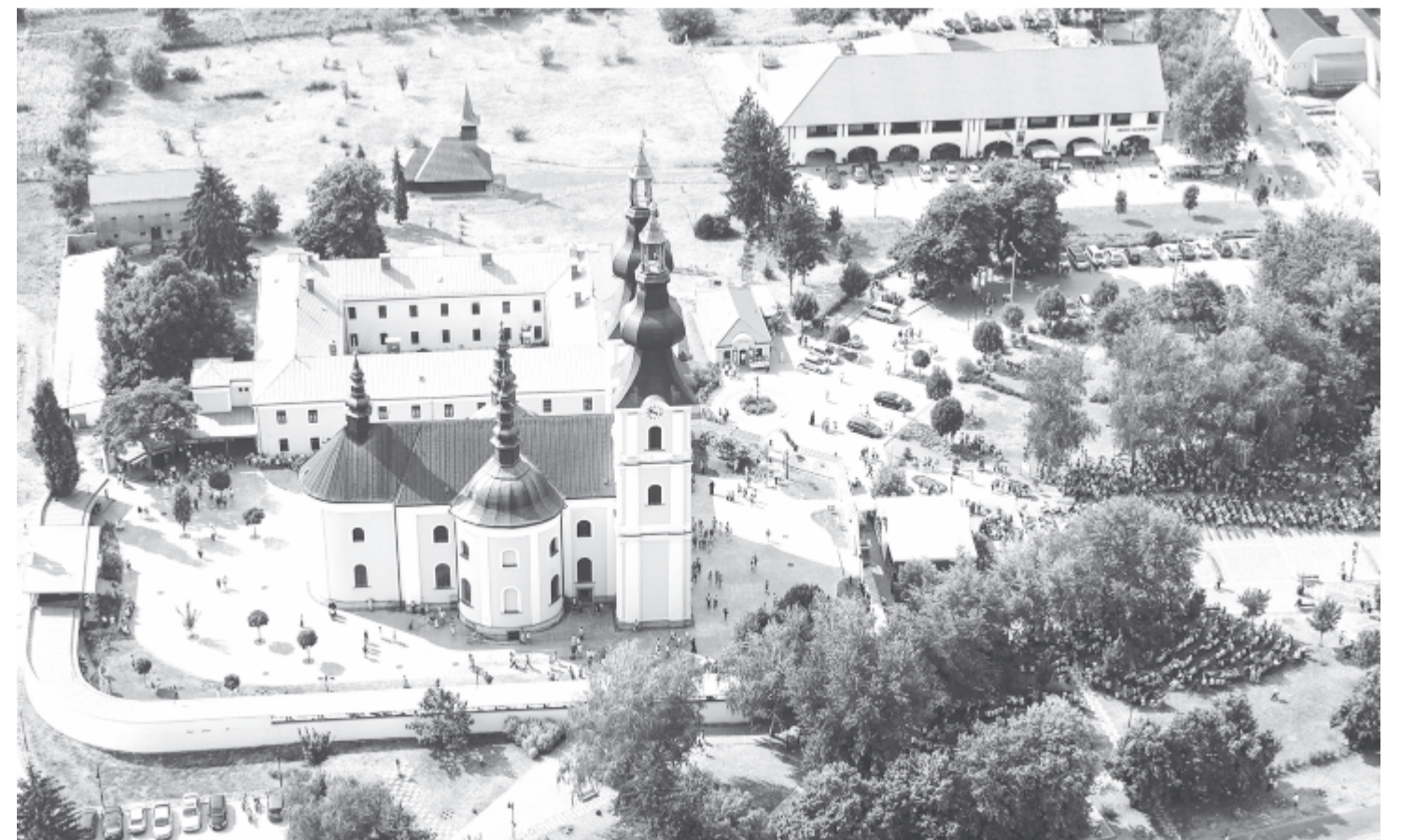
A máriapócsi kegytemplom

celán ékszer. A miniszteri biztos szerint a korábbiakhoz hasonlóan a Magyar Értéktár új elemei is egyedi, vonzó magyarságképet jelenítenek meg. Kiválasztásuk fontos szempontja, hogy ne csak a magyarság múltjára, hanem a jelenére is utaljanak – tette hozzá.