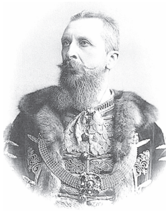
Apponyi Albert fényképe 1900-ból