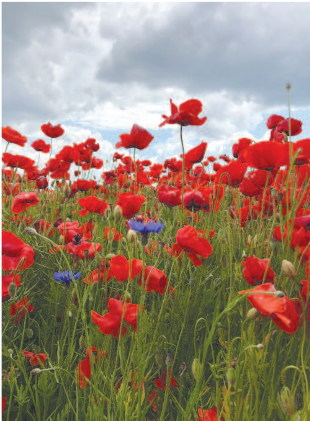
Pipacstenger Medárd záporára várva

Kelt 2021-ben, a trianoni diktátum aláírása után 101 évvel, a nemzeti összetartozás napján