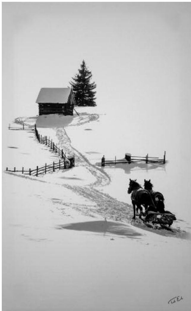
Tordai Ede: Gyimesi tél