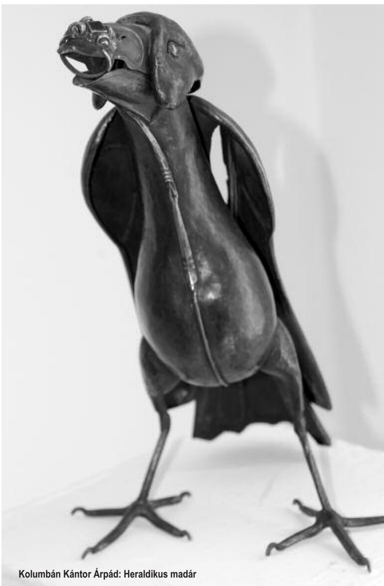
Kolumbán Kántor Árpád: Heraldikus madár

A tavalyi évben kilenc új pályázatot írt ki az NFI, hogy minél több tévés és streaming bemutatásra készülő alkotás valósulhasson meg. Eddig 2112 filmtervet dolgozott fel a szervezet és a Televíziós Döntőbizottság 208 pályázatot támogatott. Több mint 7,5 milliárd forint támogatással készülnek a mozgóképek. Ebben az évben a tévés és streaming platformra készülő alkotások közül elsőként a tévéfilmek és sorozatok forgatókönyveinek fejlesztésére, gyártás-előkészítésére és gyártására lehet pályázni, de a tervek szerint még az első félévben elérhető lesznek a dokumentum-, a kisjátékfilmek és az animációs tartalmak pályázata is.