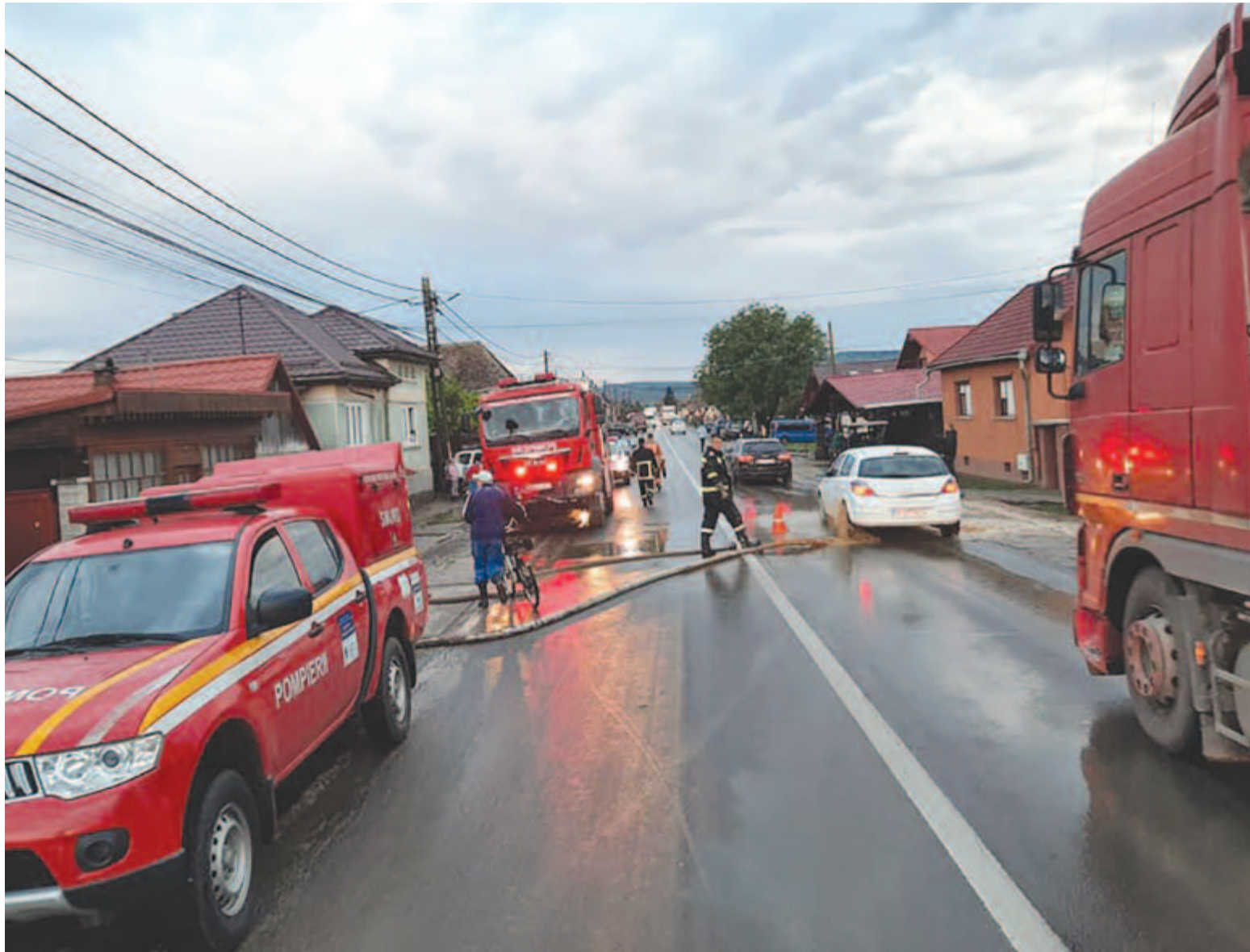
Több településen kellett beavatkozni a hivatásos és önkéntes tűzoltóságok