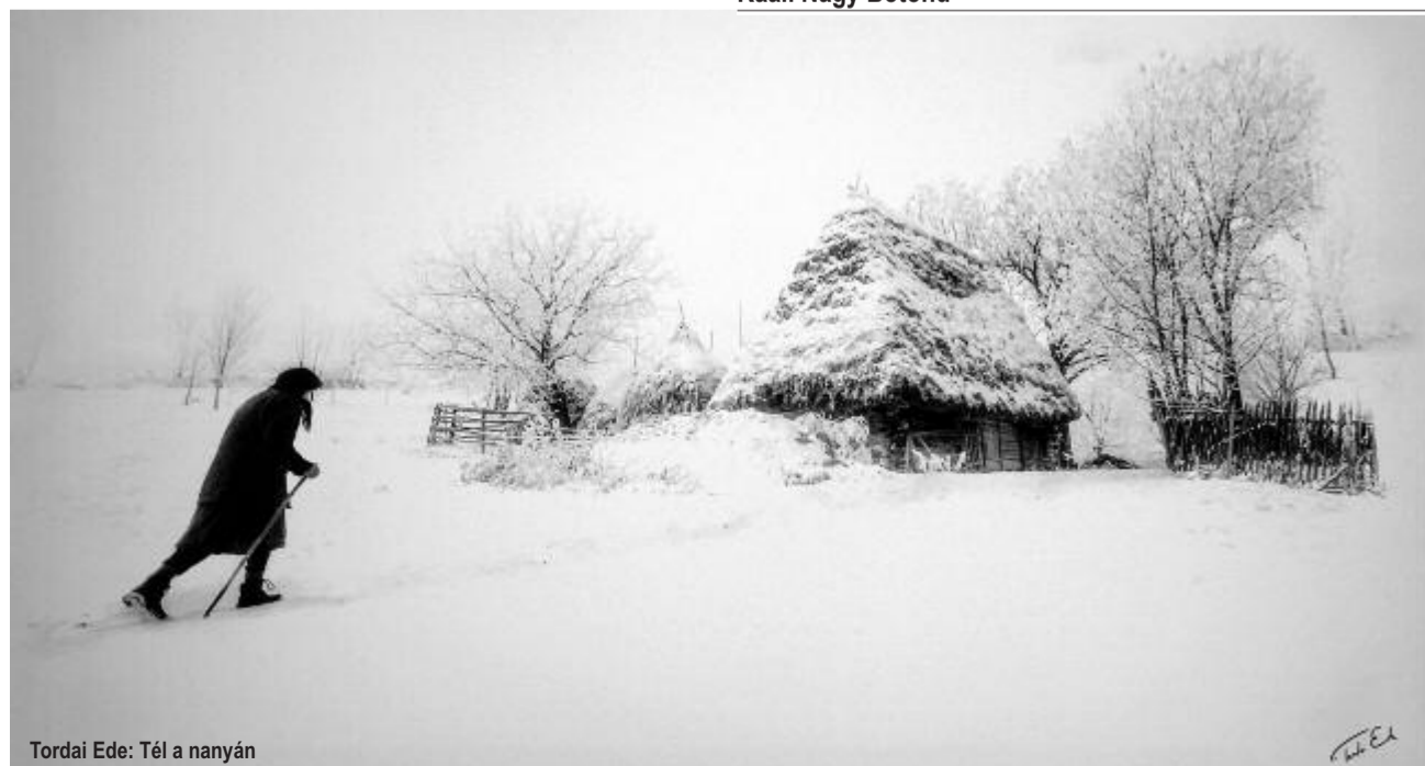
Tordai Ede: Tél a nanyán

Gothár Tamás költő 1995-ben született Csíkszeredában. 2014 óta publikál verseket és fordításokat erdélyi és magyarországi lapokban. Első önálló kötete 2018-ban jelent meg Váltás címmel a Fiatal Írók Szövetsége gondozásában.