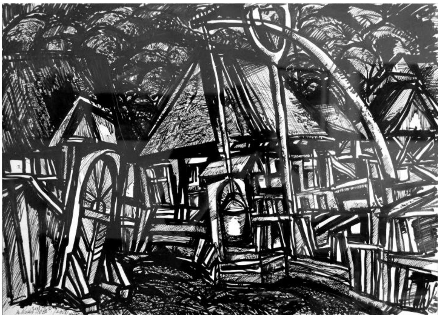
Sz. Kovács Géza: Régi struktúra

Negyven éve, 1981. április 23-án, 74 éves korában hunyt el Budapesten a Baumgarten-, József Attila- és Kossuth-díjas költő, a Digitális Irodalmi Akadémia posztumusz tagja. Született 1906. december 18-án Érmihályfalván.