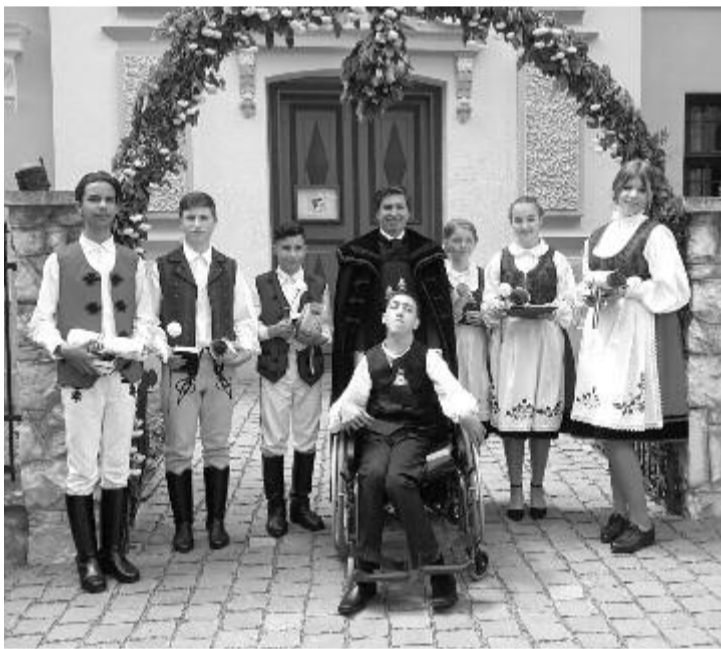
Igazi közösséggé forrt össze három hónap alatt a hét konfirmandus.

A zöld végtelenjében alig érzékelhető a hófehér sziget mozgása. Mintha az égbolton gyülekező égi vándorok ereszkedtek volna le a szelíd domboldalra, hogy lassan, ráérősen, egymáshoz simulva körbejárják, megismerjék, birtokba vegyék. Hangjuk, járásuk nem hallatszik át a szemközti esztenához, ezért is tűnnek onnan annyira légtelennek. De a juhásztanyán sem hétköznapi a világ, a városi lármából jött szemlélődő számára legalábbis semmiképpen nem.