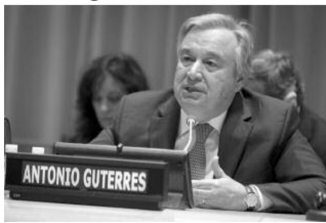
Fotó: António Guterres ENSZ-főtitkár

Guterres – aki szerint a múlt év elején kezdődött pandémia „szendvedescunamit” zúdított a világra – azt mondta, hogy a vírus miatt közel 500 millió munkahely szűnt meg. A főtitkár nemzetközi összefogást sürgetett, hangsúlyozva, hogy ennek híján a vírus a szegényebb, elegendő oltóanyaggal nem rendelkező országokban tovább mutálódik, ez pedig több százezer ember halála mellett lassítja a világgazdaság újjáéledését is.