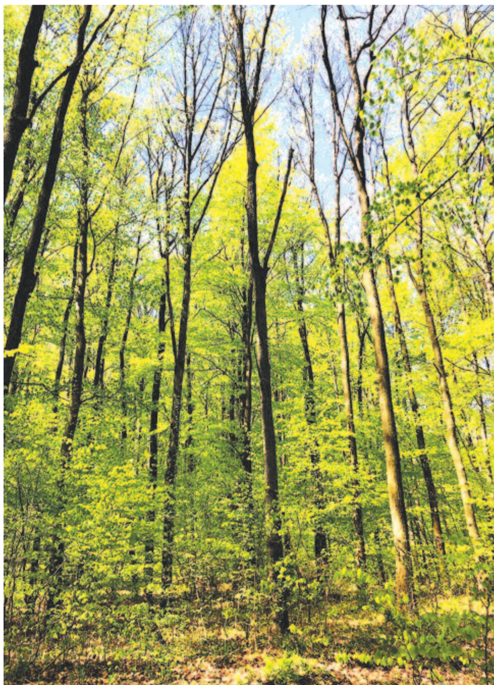
Csókolt minden az Ég alatt

Maradok kiváló tisztelettel. Kelt 2021-ben, pünkösdre várva, pénteken