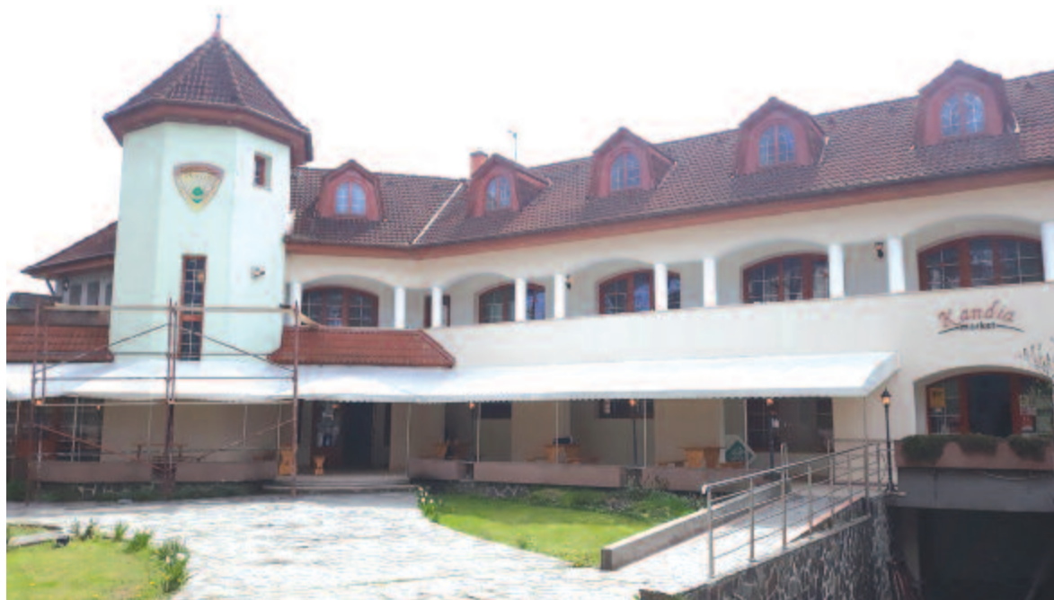
Teljesen felújítják a panziót, amelyet átkereszteltek, és arculatán is változtatnak egy keveset

A művészet támogatása mellett gróf Sándor Béla nagyon fontosnak tartja azt, hogy részt vegyenek a helyi közösség életében, és természetbarát gazdálkodást is indítsanak. A Farm to table (azaz a termelőtől a fogyasztóig) nevű koncepcióból kiindulva azt tervezik, hogy ők is helyben termelnek meg minél több alapanyagot, amelyet az itteni és szovátai konyháikon dolgoznak fel és szolgálnak fel. Ilyen megfontolásból már el is kezdték a mikházi kert művelését, és azt tervezik, hogy amit nem tudnak megtermelni, vagy nem kellő mennyiségben, azt a helyi termelőkötől veszik át és hasznosítják. A cél, hogy legjobb minőségű helyi termékekből készült finomságokat, hagyományos ízeket és ínycsikketet szolgáljanak fel az étteremben.