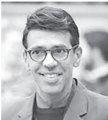
Younous Omarjee (Franciaország), a Regionális Fejlesztési Bizottság elnöke

Younous Omarjee (Franciaország, baloldal) szerint: „Az éghaj-