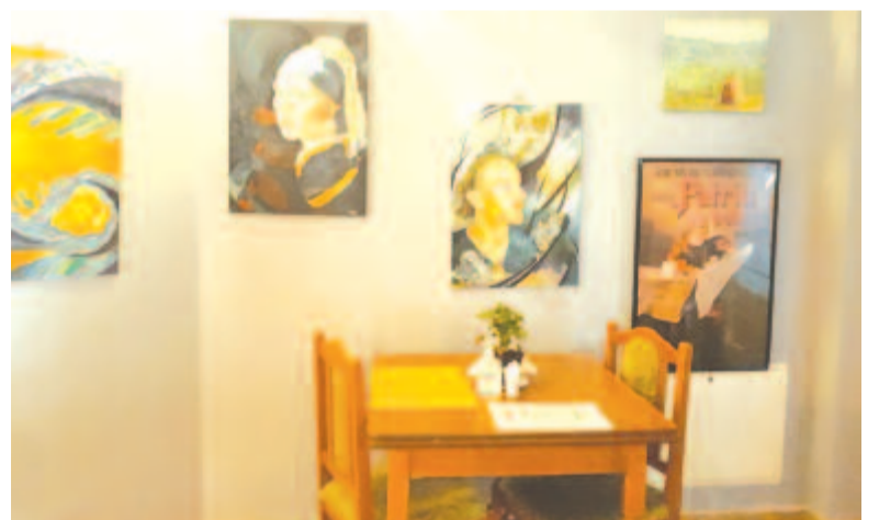
Művészbisztró – a mikházi étterem falán fiatal művészek alkotásai kapnak helyet