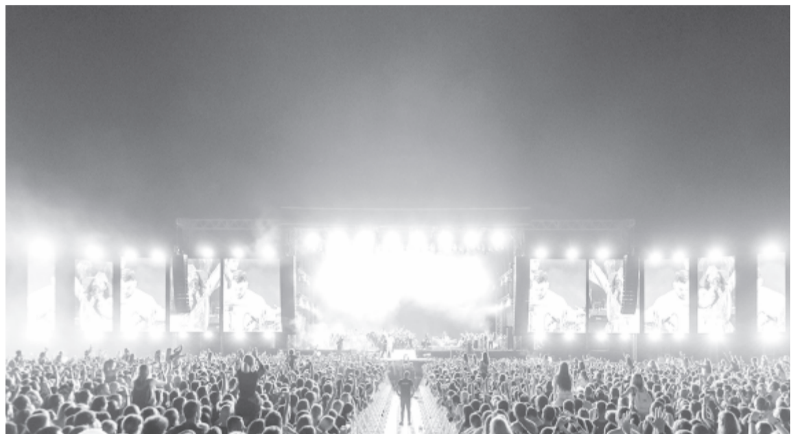
Electric Castle – illusztráció.

A szervezők szolidaritásukat fejezik ki azokkal, akik szintén a fesztiváliparban dolgoznak, és reménykednek abban, hogy jövőben visszatérhetnek a koncertek és a nagy rendezvények az emberek életébe. Addig is azt kéri, hogy vigyázzunk magunkra, vigyázzunk egymásra!