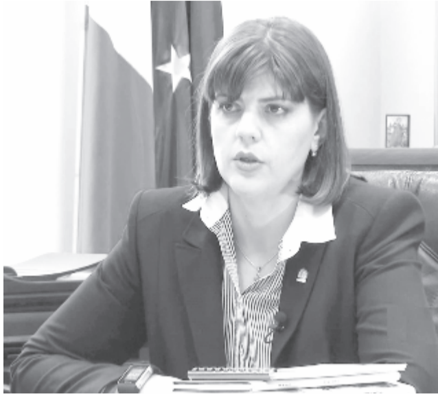
Laura Codruța Kövesi

A testület tagjait a 22 részt vevő országból delegálták, és ez Luxemburgban működik majd. Nem teljes viszont a tagországokban működő ügyészek listája, ugyanis Luxemburg, Finnország és Szlovénia esetében még nem egyeztek meg az ügyészek személyéről. A szóvivő szerint Luxemburg esetében hamarosan megoldódhat a helyzet, Szlovénia és Finnország ügye azonban problémás lehet. A testület azonban ennek ellenére megkezdheti a munkáját június elsején.